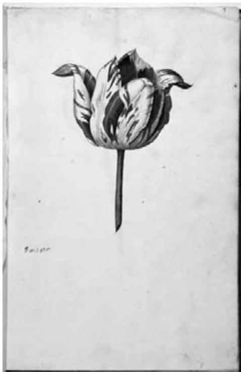
Illustratie door Jacob Isaacs van Swanenburch van een 'Switser'-tulip uit 1637.

De tulpenhandel bood de doopsgezinden een nieuwe manier om sociale status te verwerven. Wie voldoende vermogen had, kon deelnemen aan de (ongereguleerde) tulpenrage. Met hun kennis over de tulpen konden doopsgezinde bloemisten nieuw aanzien verwerven bij familieleden en andere bekenden. Doopsgezinden waren een getolereerde en achtergestelde minderheid. Zo mochten overheidspersonen niet doopsgezind zijn omdat openbare ambten waren voorbehouden aan gereformeerden. Daarnaast werd doopsgezinden niet in dank afgenomen dat zij weigerden wapens te dragen. Hierdoor konden zij geen burgerwachtters worden en moesten zij extra belasting betalen ter compensatie. 65