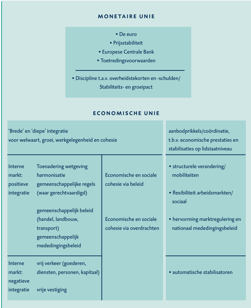
Figuur 3.1 Economische en Monetaire Unie

en interventie. Daarenboven is inmiddels algemeen aanvaard dat het goede functioneren van de economische unie tevens afhangt van het aanpassingsvermogen en de kwaliteit van beleid op lidstaatniveau. Aangezien lidstaten autonoom zijn wat betreft het economische beleid dat buiten de ‘brede en diepe’ integratie valt, dient dit door coördinatie of andere wijzen van besturing te geschieden. Dat is de betekenis van de artikelen 98 en 99 van het EG-Verdrag, die tot coördinatie verplichten op basis van de vaststelling dat nationaal economisch beleid tevens een ‘aangelegenheid van gemeenschappelijk belang’ is.