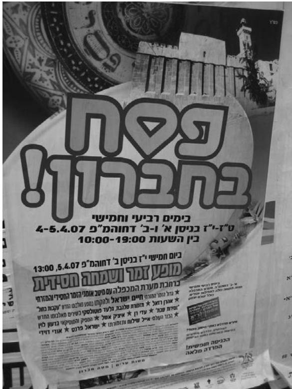
Figura 4. Pesah be-Hevron , «Pasqua a Hebron». Poster che sostiene e promuove la presenza a Hebron durante la Pasqua ebraica.