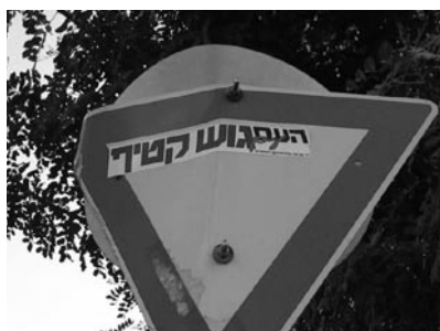
Figura 2a. ha Am im Gush Katif , «Il popolo (di Israele) è con Gush Katif». Questo adesivo, che riprende lo slogan precedente, è stato elaborato nel periodo del ritiro da Gaza (estate 2005). Gush Katif era infatti il blocco principale degli insediamenti nella striscia di Gaza.