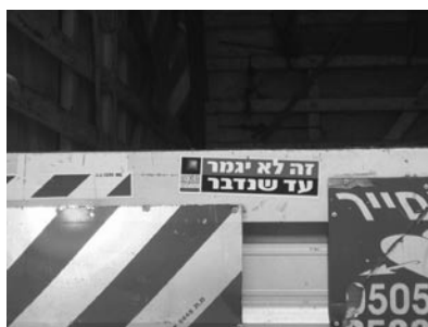
Figura 9. Ze lo igmar ad she-neddaber , «Non finirà finchè non parleremo». Adesivo del Parents'circle, associazione mista israelo-palestinese che promuove il dialogo tra le due parti.