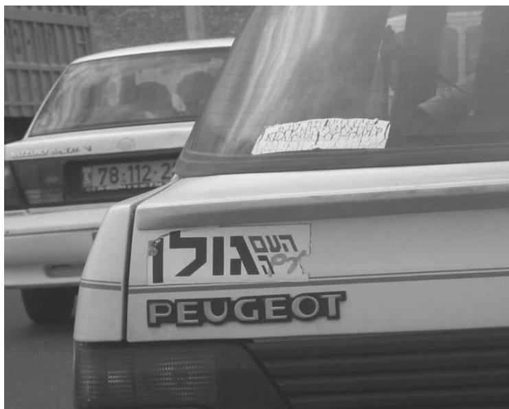
Figura 1. ha Am im ha Golan , «Il popolo (di Israele) è con il Golan». È uno degli adesivi più diffusi in Israele; è stato distribuito principalmente alla fine degli anni '90 nell'ambito di una campagna politica che si opponeva alla restituzione delle alture del Golan.