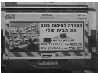
Figura 6. Annuncio pubblicitario per la vendita di immobili nella zona di Gush Etzion.