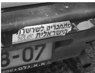
Figura 2b. Methabberim le-sharsheret Ha-israelit , «Ci connettiamo alla catena israeliana». Questo adesivo contro il ritiro da Gaza presenta due elementi interessanti: il verbo lehithabber in Ebraico si traduce con connettere, legare, unire ed ha il significato opposto di hitnatkut (lett. slegare), il vocabolo ebraico che rende la parola disengagement ; inoltre nell'adesivo si fa riferimento alla catena umana che il 25 luglio 2004 venne organizzata per creare un continuum tra Gaza e Gerusalemme.