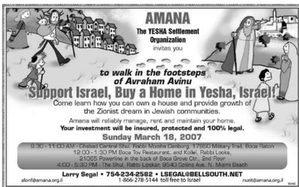
Figura 5. Annuncio pubblicitario di Amana (il braccio amministrativo del Gush Emunim) che pubblicizza la vendita di case negli insediamenti. L'annuncio pubblicitario è rivolto al mercato americano.