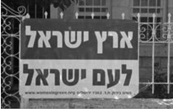
Figura 3. Eretz Israel le-Am Israel , «La terra di Israele al popolo di Israele». Poster generico distribuito da Women in green, un'organizzazione che sostiene la colonizzazione nei territori.