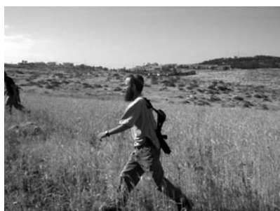
Figura 8. Colono nazional-religioso.