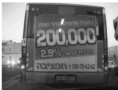
Figura 7. Annuncio pubblicitario per la vendita di immobili a Maaleh Adumim e Har Homa, due colonie situate nelle vicinanze di Gerusalemme.