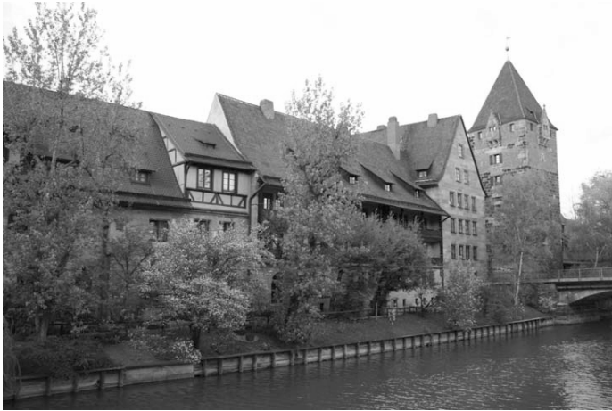
Abb. 1: Heilig-Geist-Spital Nürnberg

Stellung öfter gewechselt, konnten sie sich noch nicht einmal darauf verlassen, überhaupt versorgt zu werden. Schließlich lebten viele Menschen gerade in Städten außerhalb mehrgenerationeller ganzer Häuser und mussten andere Wege der Sicherung des Lebensabends wählen (Ehmer 1990: 37).