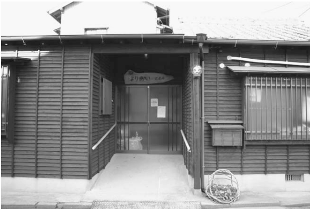
Abb. 6: Der Takurôsho Yoriai in Fukuoka

im Takurôsho verbringen. Weil es sich um ein altes japanisches Haus handelt, ist es relativ unproblematisch Schlafplätze zur Verfügung zu stellen. Die Tagesräume werden gereinigt und auf die Reisstrohmatten werden wie in den Privathäusern Futonmatrizen ausgerollt. Für schwerstpflegebedürftige Fälle gibt es zwei eigene Zimmer, alle anderen schlafen gemeinsam in den größeren Räumen. Tagsüber werden um die 15 bis 20 Demenzzranke betreut, so dass insgesamt im Verlauf eines Monats ungefähr 30 bis 40 Alte regelmäßig in den Takurôsho kommen.