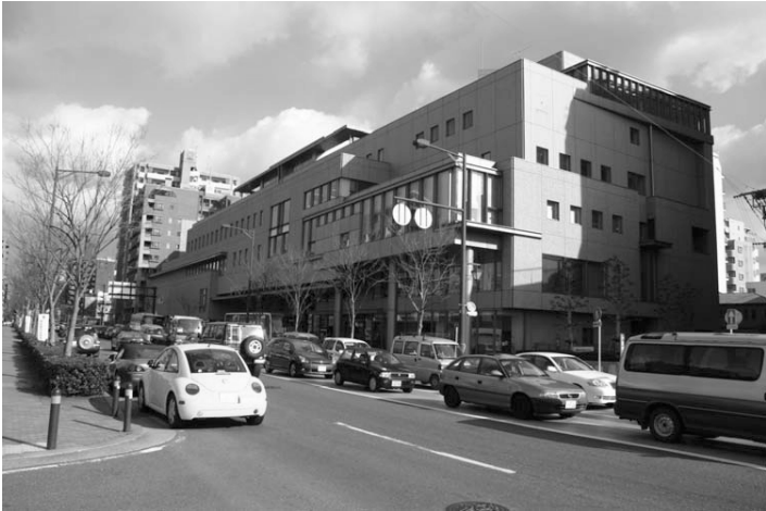
Abb. 5: Der neue Fukufukupuraza der shakyô wurde 1998 errichtet und befindet sich am Rande der Innenstadt.

Jahrtausendwende sind solche Großprojekte aber unfinanzierbar geworden.