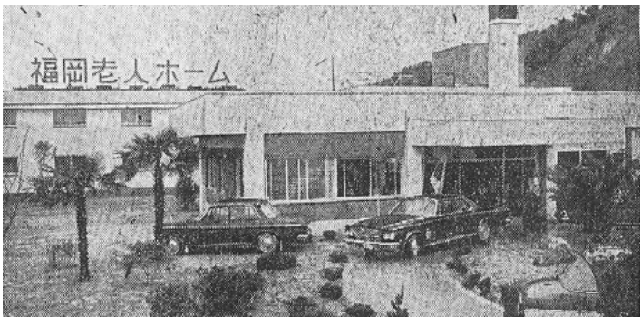
Abb. 2: Das 1963 eröffnete „Altenheim Fukuoka“

Die wohlfahrtsstaatlichen Entwicklungen in Deutschland und Japan sollen zusammengefasst noch einmal in Verbindung mit der Frage der Nation zusammen gedacht werden, um die Grundlinien deutlich aufzeigen zu können. Spätestens seit der Französischen Revolution, als das Glück der Bürger eine Angelegenheit des Staates wurde, gibt es eine enge Verbindung zwischen Nation und Wohlfahrt. So ist es kein Zufall, dass sowohl in Deutschland als auch in Japan nachdem die erste Formationsphase nach der Reichsgründung bzw. der Meiji-Restauration überstanden war, grundlegende wohlfahrtsstaatliche Maßnahmen ergriffen wurden.