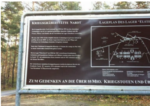
Abbildung 2: 2004 aufgestellte Orientierungstafel der Kriegsgräberstätte Nardt-Weinberg

Nach 1989 verschwand das bis dato existierende, politisch motivierte, öffentliche Schweigegebot, das jedoch „kein Tabu im Sinne eines totalen Verschweigens“ 31 gewesen war. Sichtbarer Ausgangspunkt dafür waren die Planungen einer Initiative Nardter Bürger für eine würdige Kriegsgräberstätte in unmittelbarer Nähe des ehemaligen Lagers. Sie konnte in enger Zusammenarbeit mit dem Stadtverband Hoyerswerda des Volksbundes Deutsche Kriegsgräberfürsorge schließlich am 1. März 1993 eingeweiht werden. 32