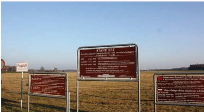
Abbildung 6: Gedenktafeln am Standort des ehemaligen Hauptlagers – heute ein Flugplatz