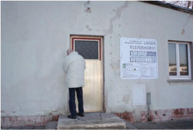
Abbildung 7: Die ehemalige Lazarettbaracke C, heute Ausstellungs- und Dokumentationszentrum Lager Elsterhorst

Da in einer frühen Phase der Planung nur wenige originale dreidimensionale Objekte zur Verfügung standen, war die Wahl des Ortes selbst von entscheidender Bedeutung für die von jedem Museum so sehr gewünschte Authentizität einer Exposition. Durch die Instandsetzung der letzten erhaltenen Lazarettbaracke des Lagers Elsterhorst konnte dieses Ziel erreicht werden, selbst wenn keine originalgetreue Rekonstruktion der Räumlichkeiten erreicht werden konnte – auch, weil das Gebäude durch die Nachnutzung und Umgestaltung (diese ursprünglichen Baracken waren aus Holz, das Überbleibsel inzwischen aus Stein) das nicht mehr zuließ.