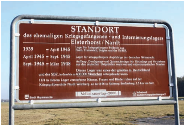
Abbildung 5: Gedenktafeln am Standort des ehemaligen Hauptlagers – heute ein Flugplatz