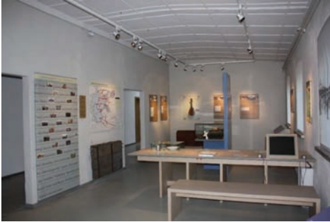
Abbildung 8: Ausstellungsansicht „Das ‚Umsiedlerlager‘ – ein Lager für Vertriebene“