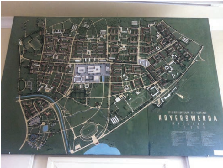
Abbildung 1: Stadtbebauungsplan der Neustadt Hoyerswerda.