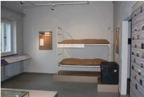
Abbildung 9: Ausstellungsansicht „Das ‚Umsiedlerlager‘ – ein Lager für Vertriebene“