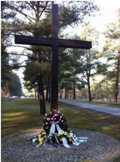
Abbildung 4: Kriegsgräberstätte Nardt-Weinberg, Blick auf den zentralen Gedenkplatz mit Holzkreuz