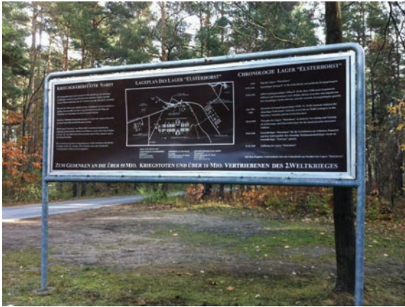
Abbildung 3: 2004 aufgestellte Orientierungstafel der Kriegsgräberstätte Nardt-Weinberg