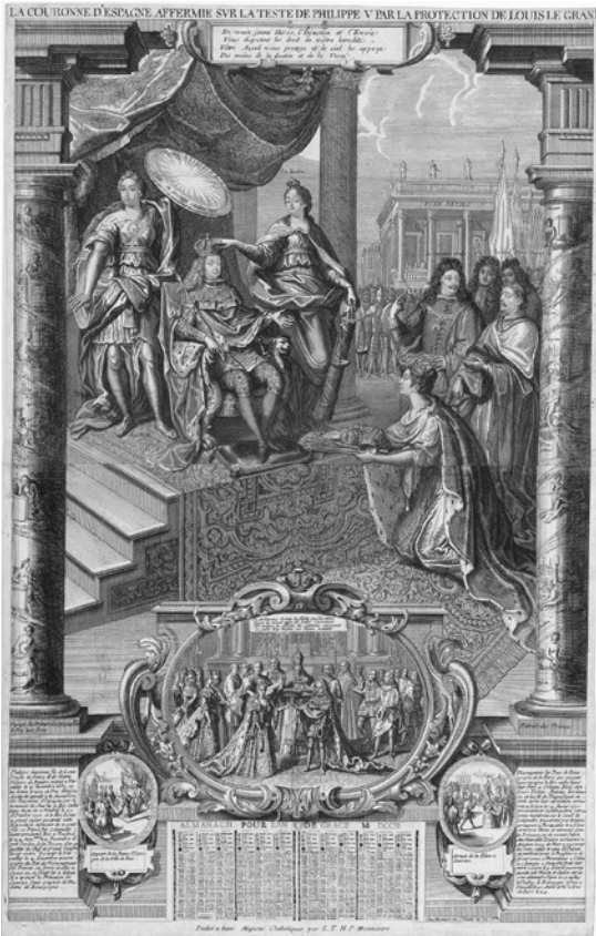
Abb. 2: LA COURONNE D'ESPAGNE AFFERMIE SVR LA TESTE DE PHILIPPE V PAR LA PROTECTION DE LOUIS LE GRAND 1702. Henri Bonnard (Paris) 1702 (BNF: IFN-6947209).