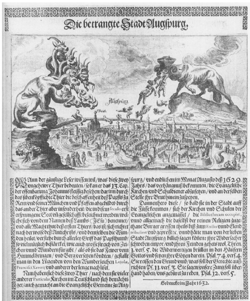
Abb. 1: »Die betrangte Stadt Augspurg«. Der Text erläutert die Szene: Wenn der Leser wissen will, »was diese zwey vngewehre Thier bedeuten, so kann er das 13. Cap. der offenbarung Johannis fleissig besehen: darin durch das sibenköpffige Thier die beschaffenheit des Papstes zu Rom vnd seiner Mönchen vnd Pfaffen abgebildet, durch das ander Thier aber insonderheit, die in diesem seculo erst ersprungene Sect vnd gesellschaft bezeichnet worden, welche sich von dem Namen deß Lambds (Jesu) benennet, vnd alle Macht thut dess ersten Thiers, das ist, sich richtet nach der weise deß Antichrists.«