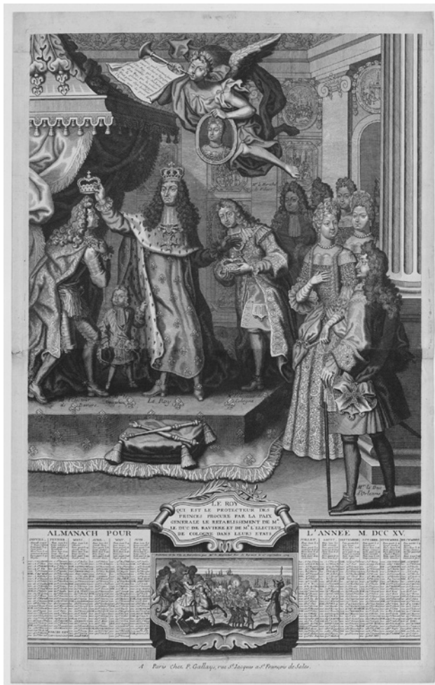
Abb. 1: [Anonymus], Le Roy, qui est le protecteur des Princes procure par la paix générale le rétablissement de M. le Duc de Bavière et de M. l'électeur de Cologne dans leurs Etats, Paris 1715 (Bibliothèque Nationale de France, Paris).

finanziell abhängigen und hoch verschuldeten Klienten und Kostgängern geworden 74 .