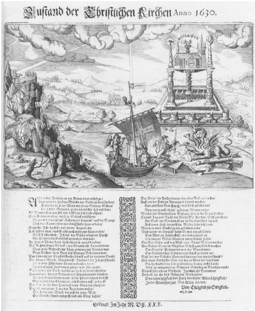
Abb. 2: »Zustand der Christlichen Kirchen Anno 1630«. Wieder wird der Papst als das siebenköpfige Tier der Apokalypse dargestellt, denn dieses trägt die päpstliche Tiara. Am Ende des Textes wird die Ankunft Gustav Adolfs als Rettung gefeiert: »Ein hochgekrönter Lew großmüthig sprang auff's Land Vnd Frewdig mit sein Schwerd Eyfrich zum Drachen rand. Darauff hört ich ein Geschrey: Jauchzet ihr Exulanten Auch all die ihr seyd Religions-Verwandten. Barmherzigkeit hatt Gott durch sein Allmächtigkeit In der Allwissenheit Vnß Allen zubereit.«

Quelle: W. Harms, Flugblätter (Abb. 1), 381.