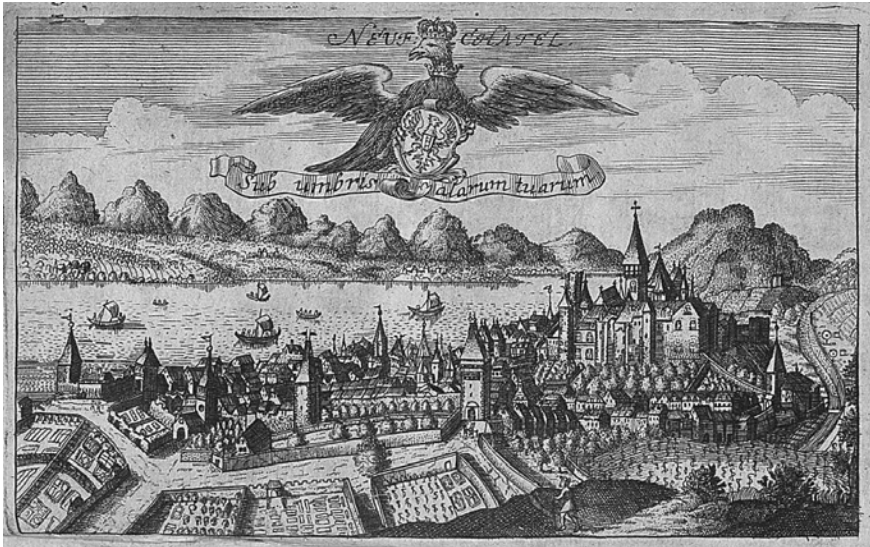
Abb. 2: Sub umbris alarum tuarum – Protektion als Herrschaftsdevise (1708).

Das Titelbild des wenige Monate nach der preussischen Sukzession gedruckten Werks des Hallenser Juristen und späteren königlichen Geheimrats Ludewig verbindet die an Psalm 17,8 ( sub umbra alarum tuarum proteges me – »Beschütze mich unter dem Schatten deiner Flügel«) orientierte, auch im Reichskontext verbreitete Herrschaftsdevise des Hauses Brandenburg mit dem Neuenburger Wappen.