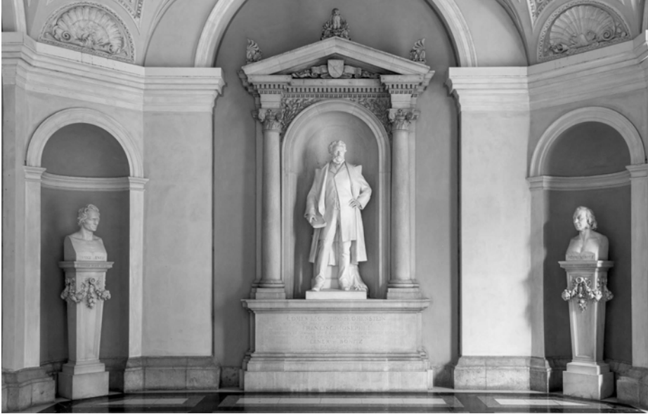
Abbildung 1: Carl Kundmann, Denkmal für Leo Graf Thun und Hohenstein, Franz Exner und Hermann Bonitz, Arkadenhof der Universität Wien, Nr. 58, enthüllt 1893.

Das Denkmal zeigt Leo Thun in einer Ädikula, mit ernster Miene, flankiert von den Büsten seiner beiden Berater. Die Statue Thuns ist umrahmt von zwei Säulen, auf dem Giebel thront eine Eule – Sinnbild für die Weisheit –, in den Palmetten sehen wir Lorbeerzweige als Siegeszeichen und im Giebelfries das Wappen der Familie Thun mit dem Schriftzug „In recto decus“. 177 Die Denkmalgruppe wurde von Carl Kundmann 178 geschaffen. Die Statue und die Büsten sind aus Marmor aus dem Steinbruch des Südtiroler Ortes Laas gefertigt. Ob diese Wahl bewusst getroffen wurde, konnte zwar nicht ermittelt werden, jedenfalls kann dies als Hinweis auf die Herkunft der Familie Thun aus dem Tiroler Raum gedeutet werden. Auf dem Sockel des Denkmals findet sich folgende Inschrift: