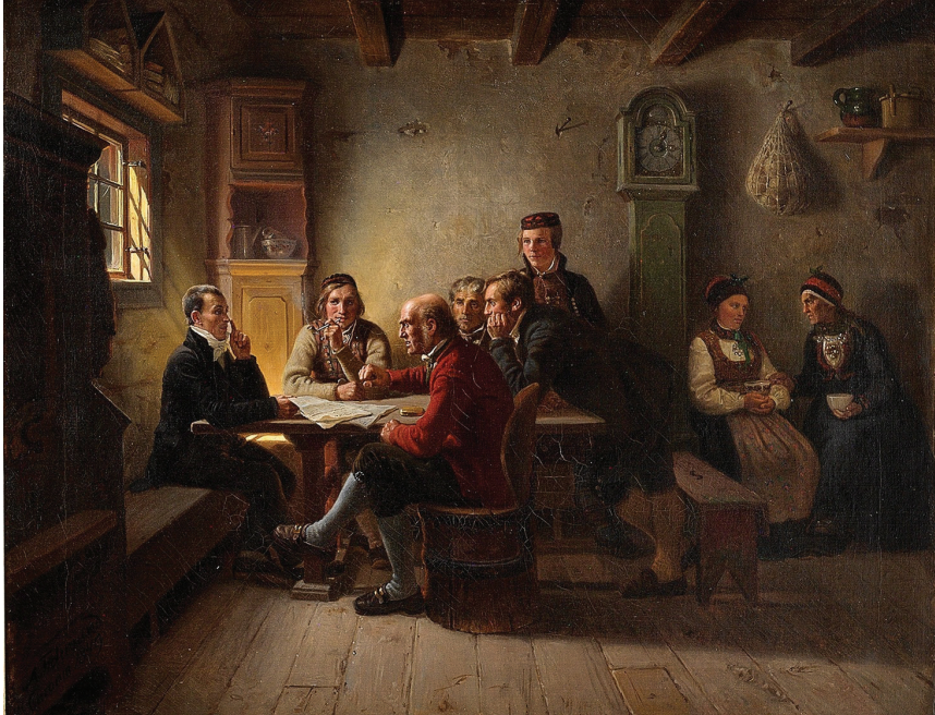
Politiserende bønder, Adolph Tidemand 1848.

Hauges kritikk av presteskapet kring år 1800 og det som seinare skulle vekse til ein meir omfattande opposisjon mot embetsmannsstaten. 4 Vidare må vi sjå Thranerørsla som eit viktig steg på vegen mot politisk myndiggjering av meinigmann, før Jaabæk med si organisering av «bondevenner» var med på å forme grunnlaget for ein moderne veljarorganisasjon. 5