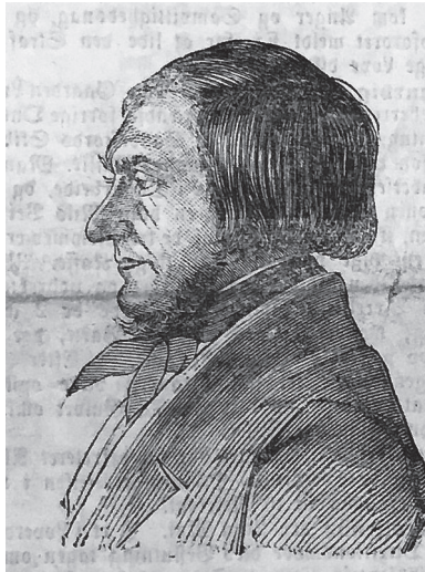
Ole Gabriel Ueland, avbilda i Almuevennen nr.19-1855.

over på staten. Utgifter til veg og regionale fellesinstitusjonar såg dei helst at byane betalte for. Når det galdt statens finansar, ville bondeopposisjonen – med Ueland i spissen – erstatte direkte skattlegging med toll og avgifter. Her vann dei også massivt fram da Stortinget i 1836–37 vedtok å avskaffe direkteskatten. 47