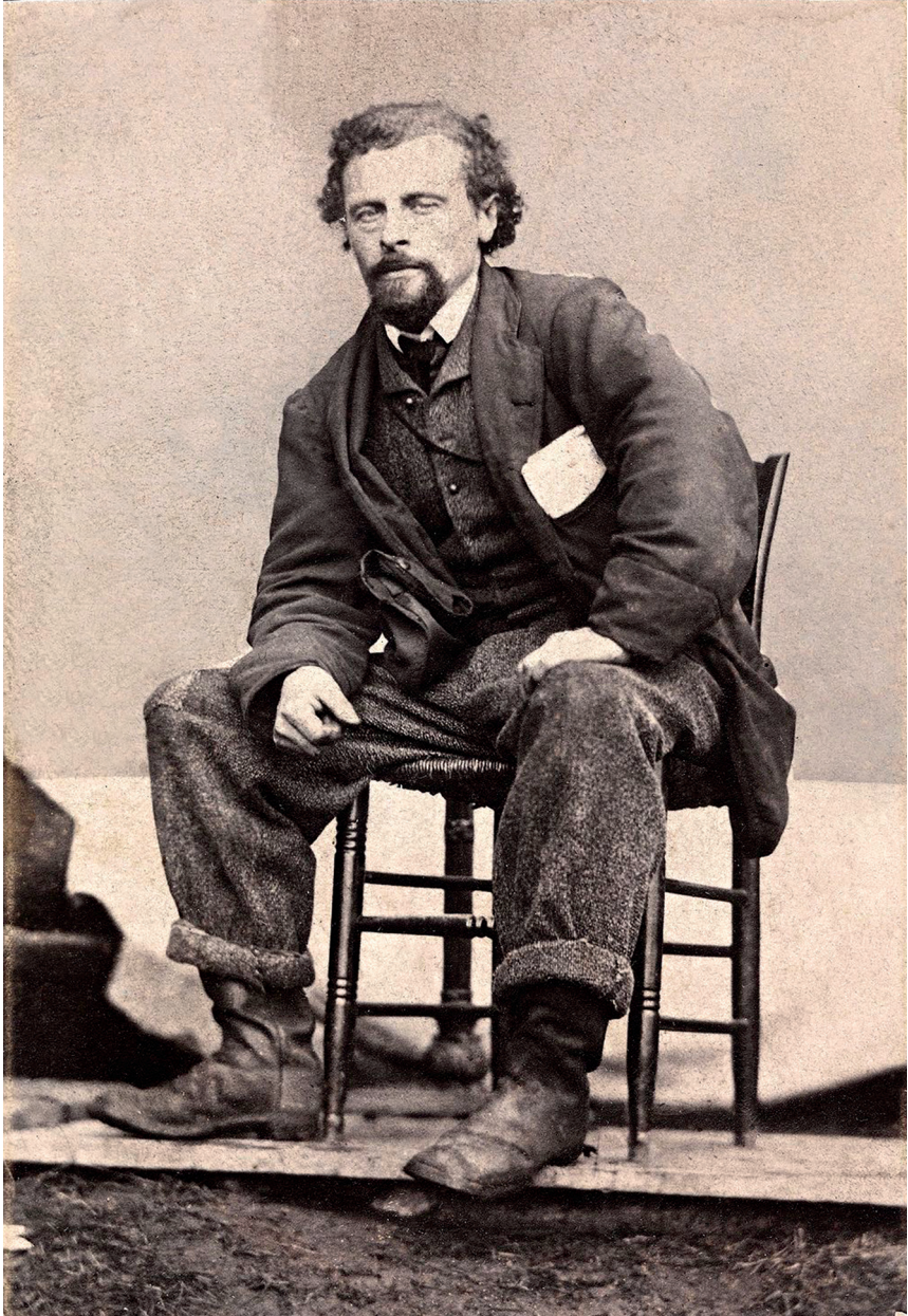
Portrett av Marcus Thrane.