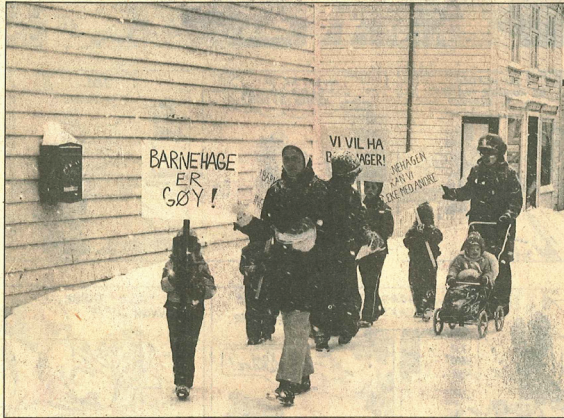
Xantippene i Lillesand vil ha barnehage.

Kvinnefronten i Lillesand, nå xantippene, er en politisk uavhengig kvinnegruppe som kjemper for kvinnesak. Gruppen arbeider med det som mål at alle medlemmene er aktive og medansvarlige for arbeidet i sin gruppe.