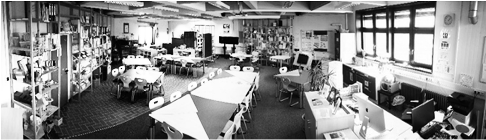
Abb. 1: Blick in die OASE vom Eingangsbereich

Darüber hinaus wird die OASE als Seminarraum für Lehrveranstaltungen der Arbeitsgruppe Grundschulpädagogik genutzt. Eine Besonderheit ist der Grundriss des Raums, der die Unterteilung in Nischen und Nutzungsbereiche erlaubt und dennoch durch die Ausstattung mit flexiblen Möbeln und Materialien disponible Lernarrangements (vgl. Hagstedt 2014, 132) ermöglicht.