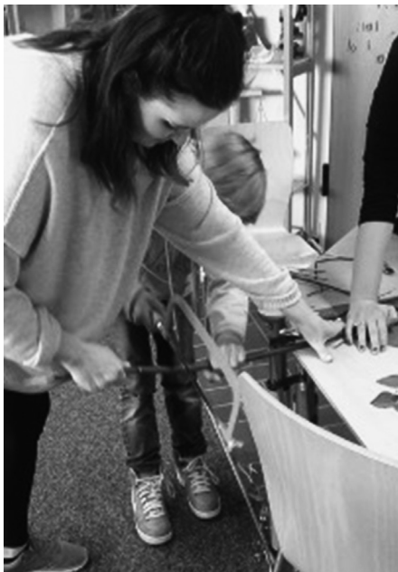
Abb. 7: (Nicht-)Eingreifen bei der Lernbegleitung