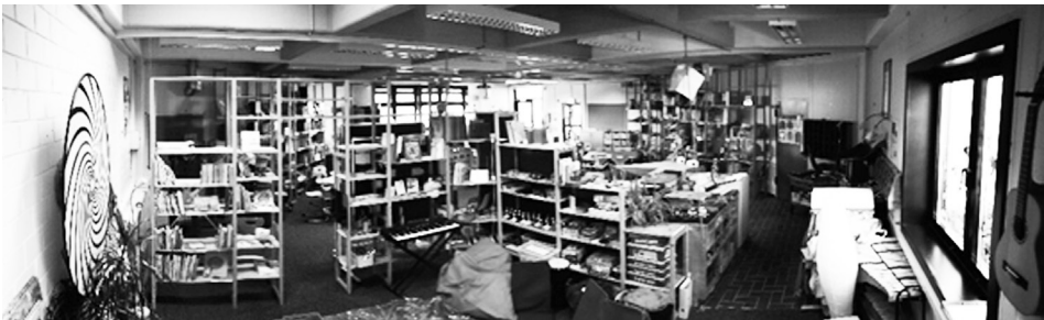
Abb. 2: Blick in die Lesecke; mittig im Hintergrund befindet sich die Eingangstür

Ein Kernanliegen der OASE Lernwerkstatt und auch der zentrale Gegenstand meiner Forschung ist das Projekt Werkstatt für Kinder. Dieses führt eine Gruppe von ca. 20 Kindern aus umliegenden Grundschulen 3 , ca. fünf Studierende als Praktikant*innen sowie zwei bis drei studentische Mitarbeiter*innen aus dem OASE-Team als Leitungspersonen des Projekts über einen Zeitraum von etwas mehr als einem Semester zusammen. Die Studierenden können sich ihre Teilnahme am Projekt als sogenanntes Berufsfeldpraktikum, das in Nordrhein-Westfalen verpflichtend im Bachelor des Lehramtsstudiums absolviert werden muss und in der Regel außerschulisch abgeleistet wird, anrechnen lassen. Obschon die OASE insbesondere in den universitären Strukturen des Grundschullehramts verankert ist, stammen die Praktikant*innen aus allen Lehramtsstudiengängen, so dass ihr pädagogisches Grundlagenwissen und ihre praktischen Vorerfahrungen mit der Zielgruppe sehr heterogen sind.