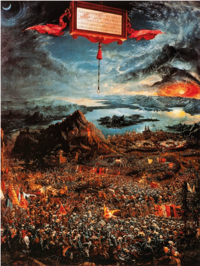
Abbildung 1: Albrecht Altdorfer, Alexanderschlacht, Öltempera auf Lindentafel, 158 x 120, 1528–29, Alte Pinakothek, München.

dessen, was die Modernen seit Johann Gustav Droysen die hellenistische Epoche nennen.