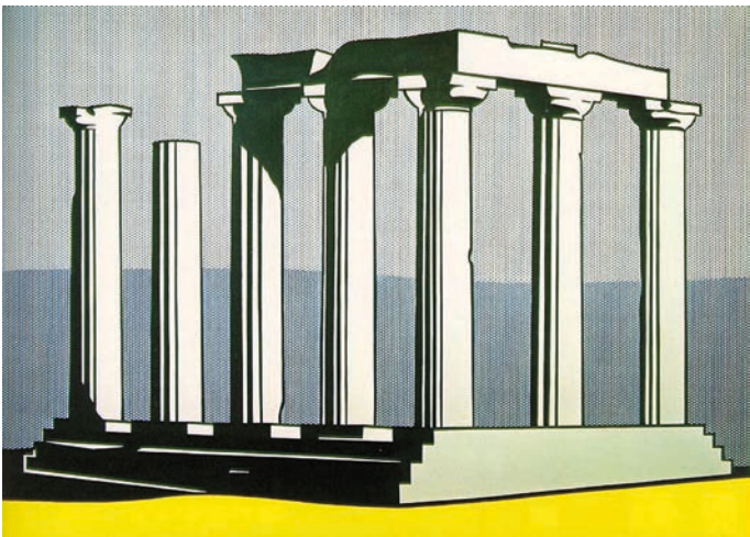
Abbildung 2: Roy Lichtenstein, Apollotempel, Öl und Acryl auf Leinwand, ca. 239 x 325 cm, 1964, Privatsammlung.

und Weise nutzen kann. Das Objekt Griechenland wird gleichzeitig vertrauter und rückt in die Ferne. Zwar kann man die berühmten Ruinen sehen, fotografieren, durchstreifen, die tausendjährigen Steine berühren: man begibt sich also in ihre unmittelbare Nähe; aber wie soll man noch glauben, dass alles, was sich dort in diesen kleinen Orten unter der brütenden Sonnenhitze ereignet hat, uns noch angehen kann, während wir uns beeilen, wieder in die Kühle der klimatisierten Reisebusse zurückzukehren, die mit laufendem Motor auf dem Parkplatz warten? Es handelt sich doch nur um eine Anhäufung toter Steine, die man ständig neu befestigen und wiederverwerten muss. Seit den frühen 1980er Jahren geht es zunehmend um die Tourismusindustrie, aber auch um jene des Kulturerbes.