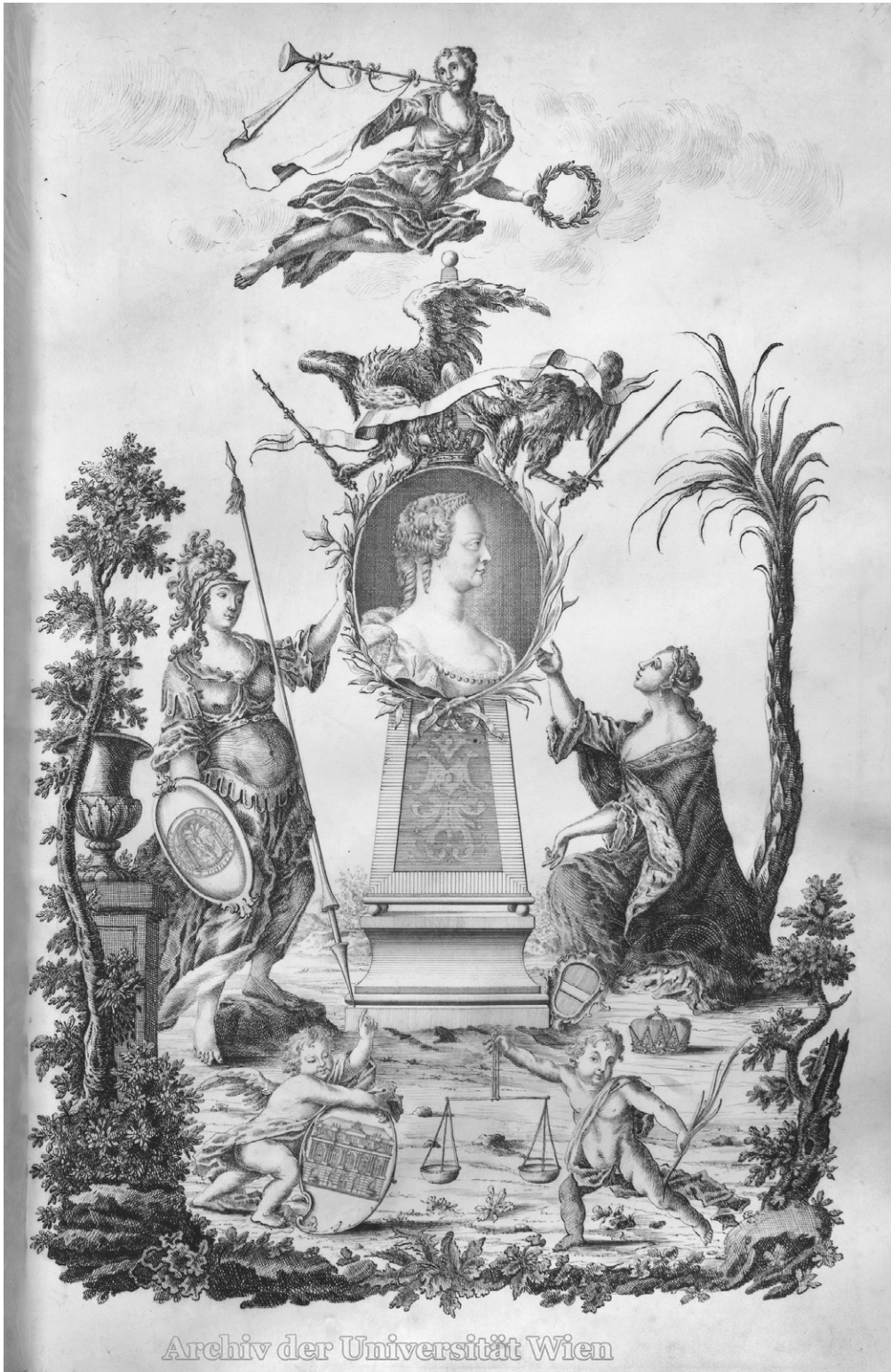
Kaiserin Maria Theresia als Stifterin des Neuen Aulagebäudes, das am 5. April 1756 der Universität übergeben wurde.