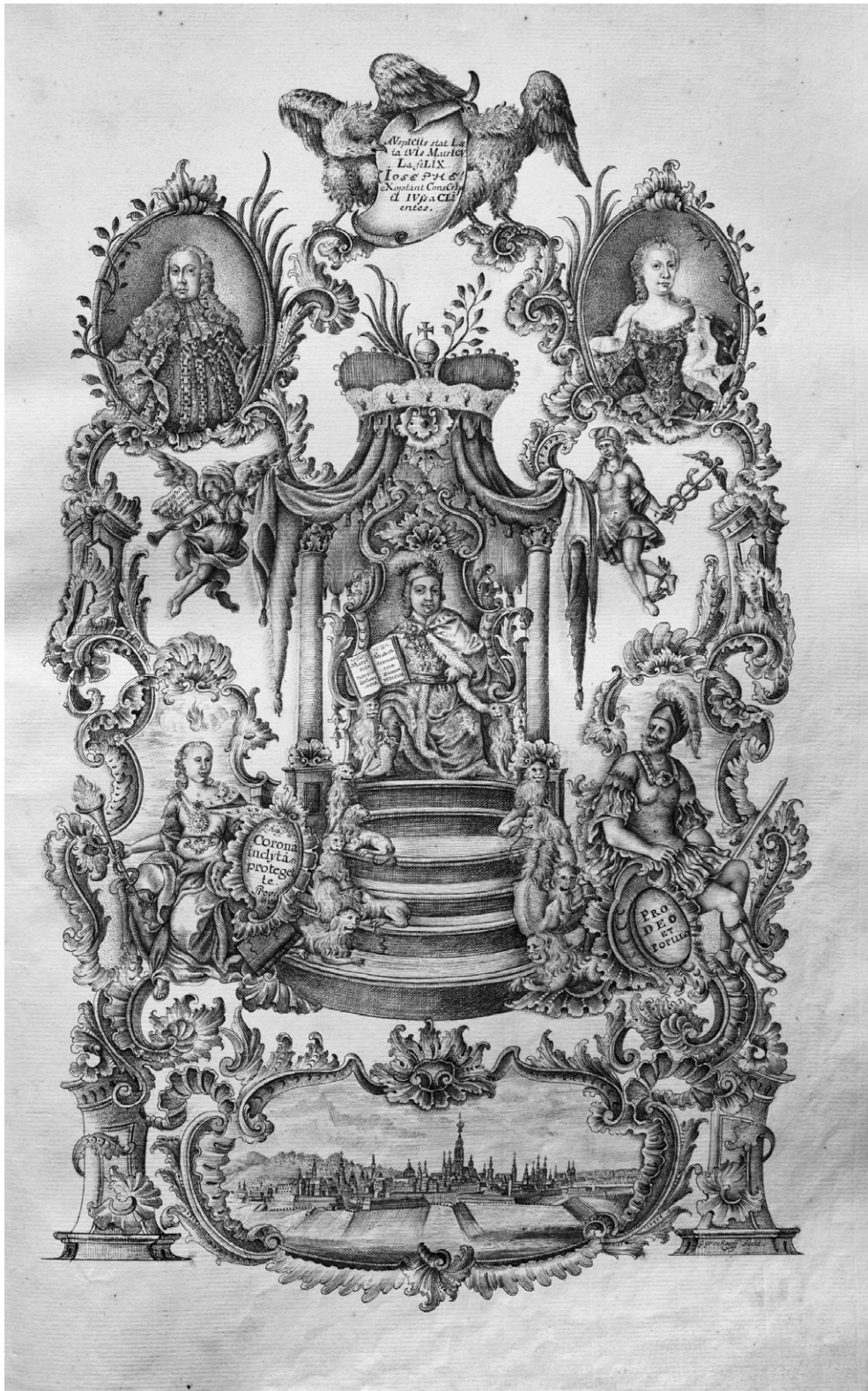
Ehrenmatrikulation Erzherzog Josefs, des späteren Kaisers Josef II., 1757 (UAW, Cod. M 10, pag. 39)