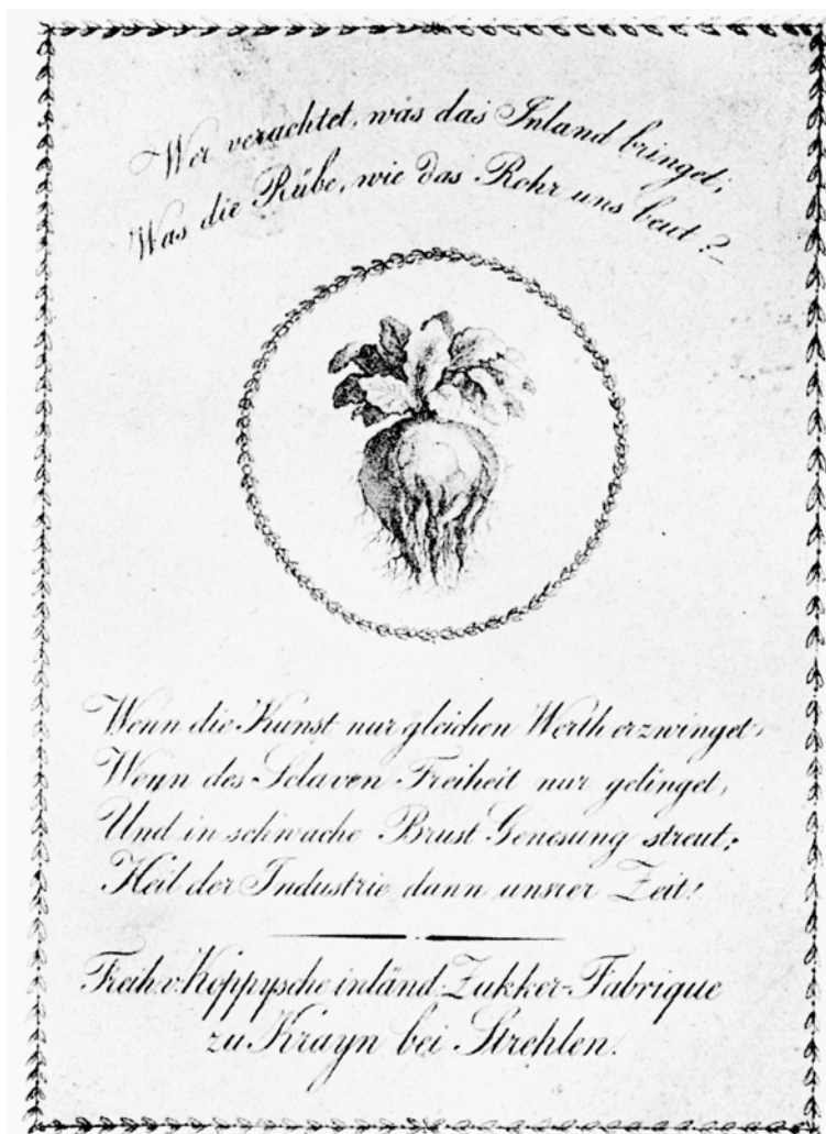
Abbildung 1: Moritz von KOPPY, Werbeblatt für die Freiherr von Koppysche inländische Zucker-Fabrikue zu Krayn bei Strehlen (um 1810):

»Wenn die Kunst nur gleichen Werth erzwinget, Wenn des Slaven Freiheit zur gelingt, Und in schwache Brust Genesung streut; Heil der Industrie dann unsrer Zeit!«