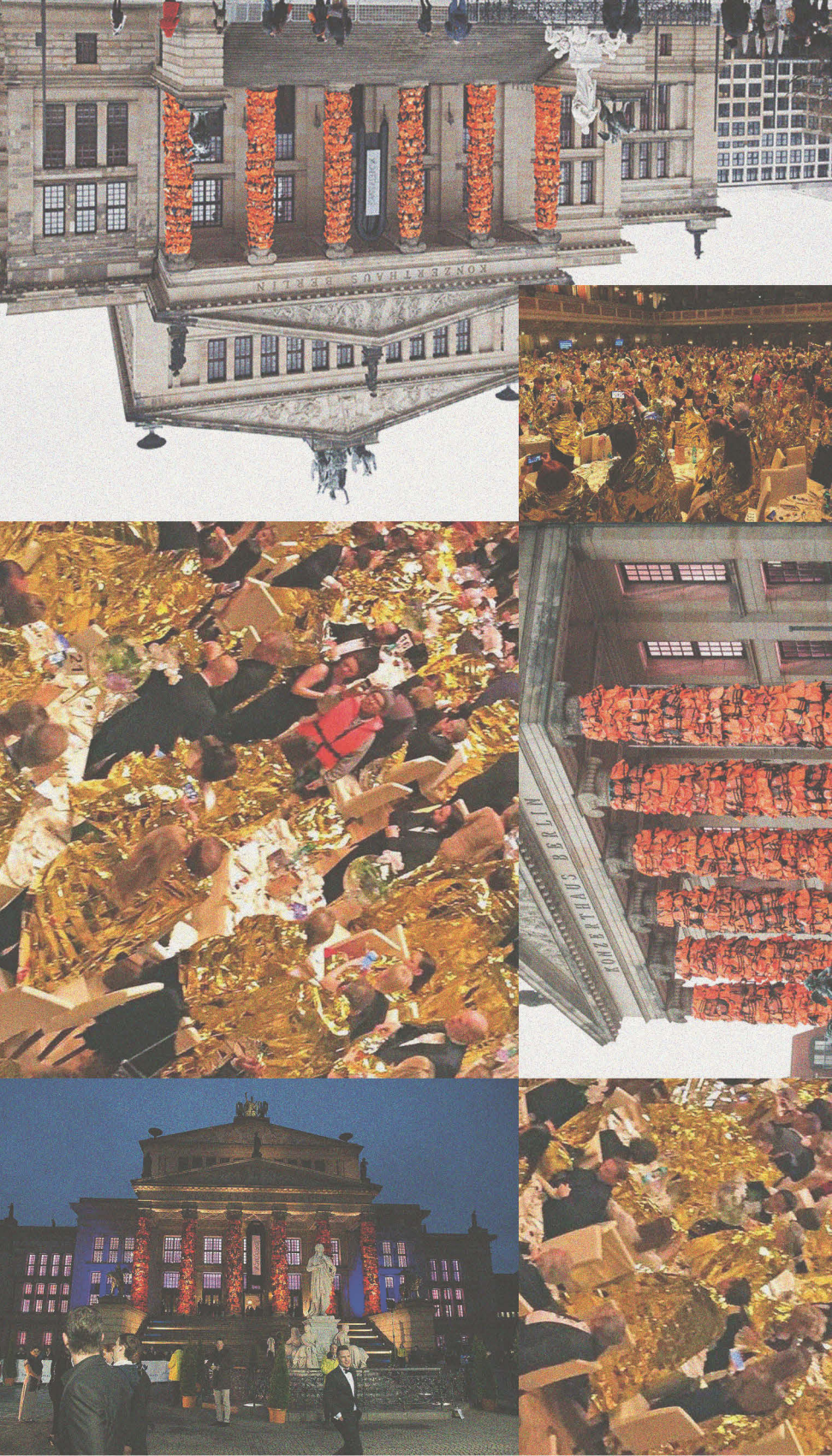
Abb. 4 Installation von Ai Weiwei bei der Cinema for Peace Gala, Konzerthaus Berlin 2016