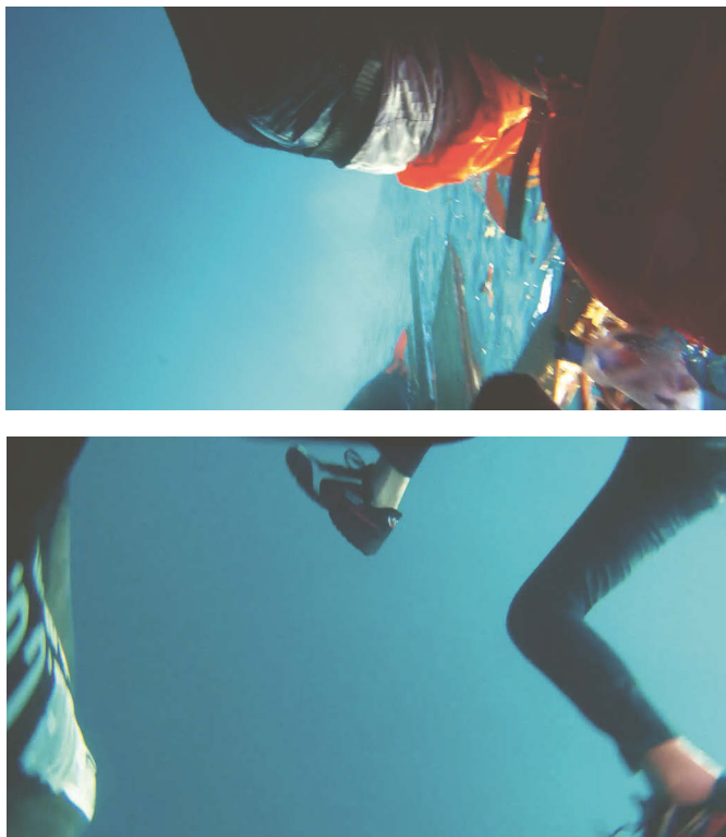
Abb. 12 PURPLE SEA

SEA sind keine Einladung, Alzakouts Perspektive einzunehmen, oder die Situation durch ihre Augen zu betrachten: „I see everything“. Und obwohl sie dezentrieren, nehmen sie doch auch eine radikale Zentrierung vor – auf Alzakout, auf die Perspektive der Migration, auf diese eine konkrete Geschichte, die keine einzelne ist, aber auch kein WIR behauptet, auch keines, das der steten Zählung der ‚(zu) Vielen‘ entgegnet: