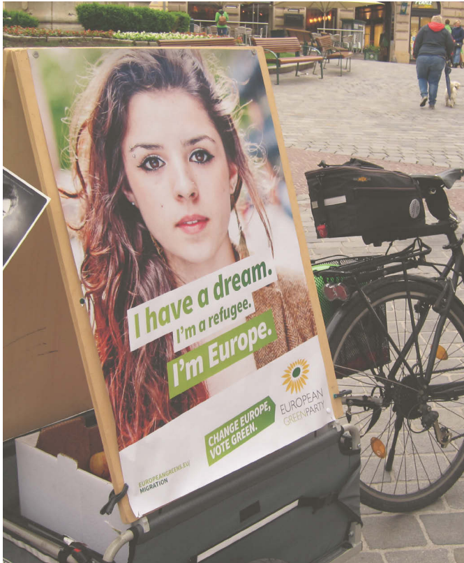
Abb. 1 Europawahlkampagne der Grünen 2014.

auf das Modell von Repräsentation, Rechten und Sichtbarkeit rekurriert, 32 das einen wesentlichen Anteil an der Vorstellung von Kunst als politisch und gesellschaftlich wirksam hat: Kunst und Kultur machen Migration sichtbar und erzeugen damit Anerkennung. Die Abwendung von der zuvor ebenfalls nicht unproblematischen Akteur*innenposition, die nur zu oft eine paternalistische Situation bedienen sollte, 33 muss aber auch noch wei-