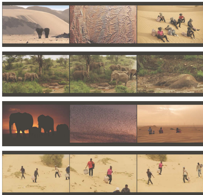
Abb. 7 FOUR NOCTURNES

VERTIGO SEA werfen die Bilder von toten nackten Schwarzen Menschen, die am Strand angespült wurden, Fragen nach der eingesetzten Bilderpolitik auf – aber diese Fragen können und sollen auch gestellt werden, denn Zeigen/Nichtzeigen ist nicht nur eine Frage der Entscheidung, sondern vielmehr als eine der Aushandlung zu verstehen. Zumal diese Bilder als älterer Filmausschnitt erkennbar sind, und in Zusammenhang mit einer anderen Szene zu stehen scheinen, die zeigt, wie Schwarze Menschen von einem Schiff über Bord gestoßen werden. Diese Szene erinnert an das Massaker auf der Zong von 1781, erscheint also als Zitat einer Bilderwelt, die diese Gewalt weiterhin zirkulieren lässt, während der gesellschaftliche Kontext diese Gewalt weiterhin und weitgehend dethematisiert. Das Kinematografische dieser Bilder, die sie als für die Kamera inszenierte sichtbar machen und die zugleich nicht unmittelbar konkret mit einem Ort und einer Zeit des Sterbens verbunden erscheinen (trotz der genannten Zong-Assoziation), also nicht im Sinne des Reenactments von A(y)lan Kurdi durch Ai Weiwei funktionieren, können daher sowohl für die millionenfachen Morde an versklavten und verschleppten Schwarzen Menschen stehen, wie für die ungezählten Toten des europäischen Grenzregimes.