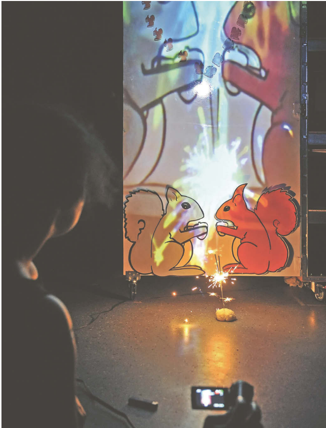
Abb. 9 KRIEG DER HÖRNCHEN

– zeigen neuere Studien, dass die Zusammenhänge stets komplexer sind. Das Verschwinden des roten Eichhörnchen hat auch mit der Wahl von Koniferen zur Aufforstung und der Ausrottung des Baummarters zu tun. 450 Was die Invasionsbiologie ebenfalls vergisst zu fragen, ist, ob die Neuankommlinge und eine veränderte Artendemografie nicht auch positiv zu bewerten sind. 451 Ayivis Theaterstück bringt ein Archiv der Hörnchen