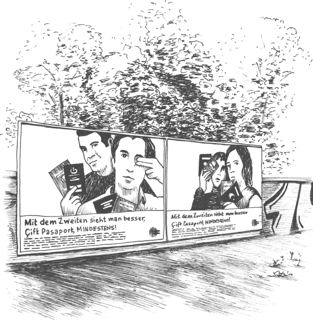
Abb. 2 MIT DEM ZWEITEN SIEHT MAN BESSER. ÇIFT PASSAPORT, MINDESTENS! Kanak-Attak-Kampagne 2005

Die Setzungen des Rechts sind, wie Arendt so eindrücklich in ihrer Kritik der Menschenrechte beziehungsweise ihrer Analyse der Aporien ausgeführt hat, keine universellen Gegebenheiten, vielmehr ist im Kontext des Nationalstaatsystems der Zugang zum Recht an die Zugehörigkeit zu einer Nation gebunden: „Staatsbürgerschaft und nationale Zugehörigkeit [sind] nicht zu trennen“ und „nur die nationale Abstammung“ kann „den Gesetzesschutz“ wirklich garantieren. 47 Auch suprastaatliche Konstrukte wie die EU haben weder das Ordnungsprinzip des Nationalstaats ersetzt – auch deshalb ist die Krise, die die Flucht- und Migrationsbewegungen seit 2015 ausgelöst haben, eine der EU –, noch haben sie zu keiner zunehmenden Inrechtsetzung von Migrant*innen geführt. Wie Bettine Menke ausführt, erweist sich Arendts Diagnose als