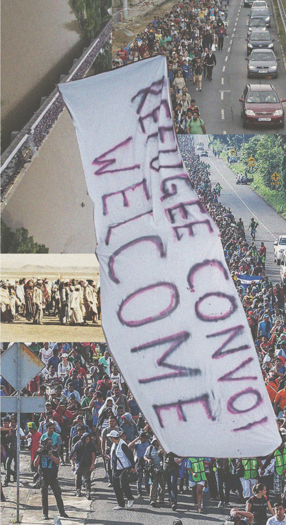
Abb. 8 Migration ist eine soziale und politische Bewegung