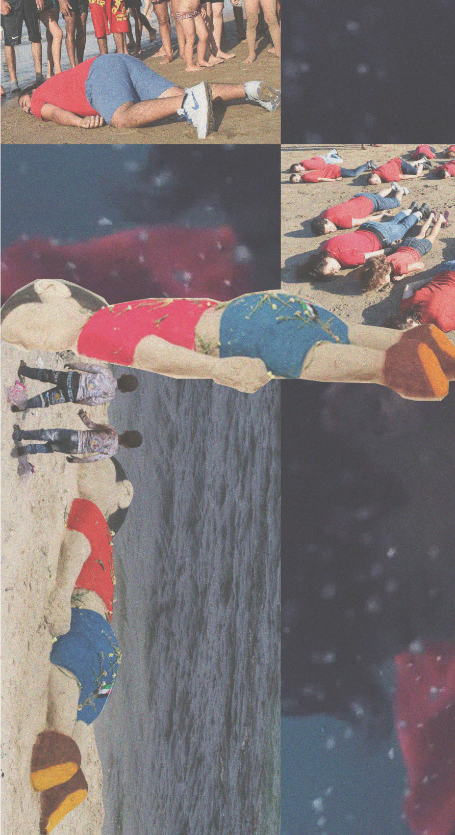
Abb. 5 A(y)lan Kurdi als Bildikone