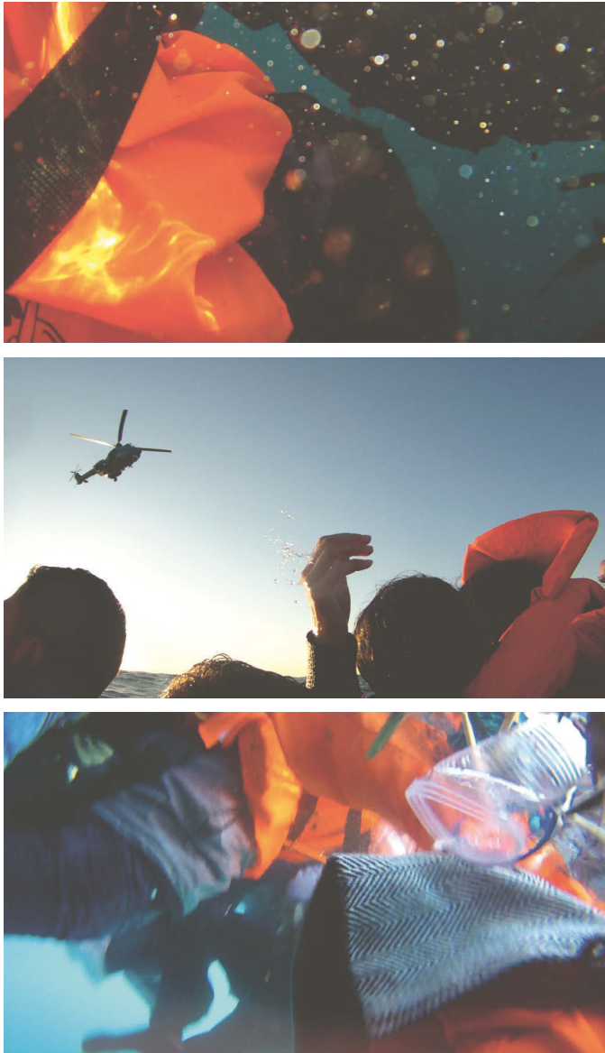
Abb. 11 PURPLE SEA

Das Meer ist also purpurrot. PURPLE SEA ist 67 Minuten lang und eine Montage aus dem Material, das die Kamera an Amel Alzakouts Handgelenk aufgezeichnet hat. Die Kamera wurde nicht durch ihre Hände oder ihr Auge geführt, weil sie damit beschäftigt war, zu überleben. Bilder in Bewegung, Bilder in Aufruhr, verwackelte Bilder, tanzende Bilder, abstrakte Bilder und solche, die sehr konkret sind: Arme, Beine, Füße. Über Wasser