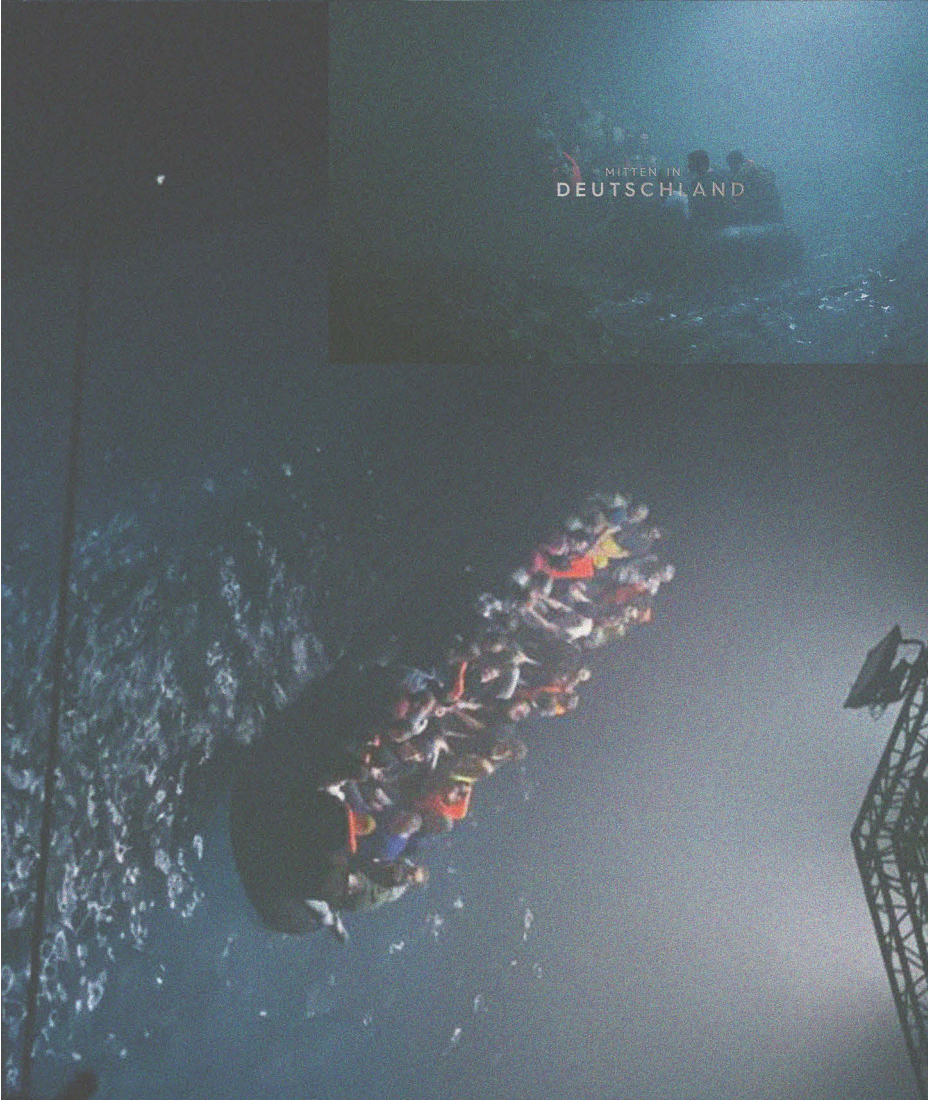
Abb. 10 Simulationen der Mittelmeerpassage