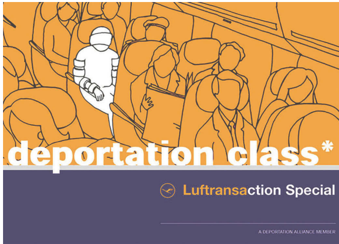
Abb. 6 Kampagne DEPORTATION CLASS, 2000

Ebenso wie Ai Weiwei Aufmerksamkeit garantiert, wie Voss festhält und auch die Studie bestätigt (wenn auch mit einer klar begrenzten Zeitlichkeit), argumentiert auch das Zentrum für Politische Schönheit (ZPS), dass ihre kontroversen Aktionen an einer Umverteilung oder eher gezielten Ausrichtung von Aufmerksamkeit arbeiten. Aktionen wie die KINDER-TRANSPORTHILFE DES BUNDES (2014), ERSTER EUROPÄISCHER MAUERFALL (2014), DIE TOTEN KOMMEN (2015), DIE JEAN MONNET BRÜCKE (2015), FLÜCHTLINGE FRESSEN. NOT UND SPIELE (2016) 171 richten sich gezielt an das Europäische Grenz- und Migrationsregime und deutsches Regierungshandeln. „Aufrüttelnde und provozierende Aktionen im Namen der Menschenrechte sind ihr Markenkern“, so die Info auf der Facebookseite des Zentrums. Gegründet wurde das ZPS 2011 von Philip Ruch und vertritt, wie in verschiedenen Texten ausgeführt, die aktionskünstlerische Umsetzung eines „aggressiven Humanismus“: „Der Begriff aggressiver Humanismus drückt die Einsicht aus, dass der Kampf um Menschenrechte viel zu höflich geführt wird, jedoch ein offensives Auftreten legitimiert.“ 172 Die strafrechtlichen Verfolgungen, mit denen viele der Aktionen konfrontiert werden, sind daher Teil der Programmatik, die das ZPS als aktiven Gebrauch von Kunstfreiheit versteht.