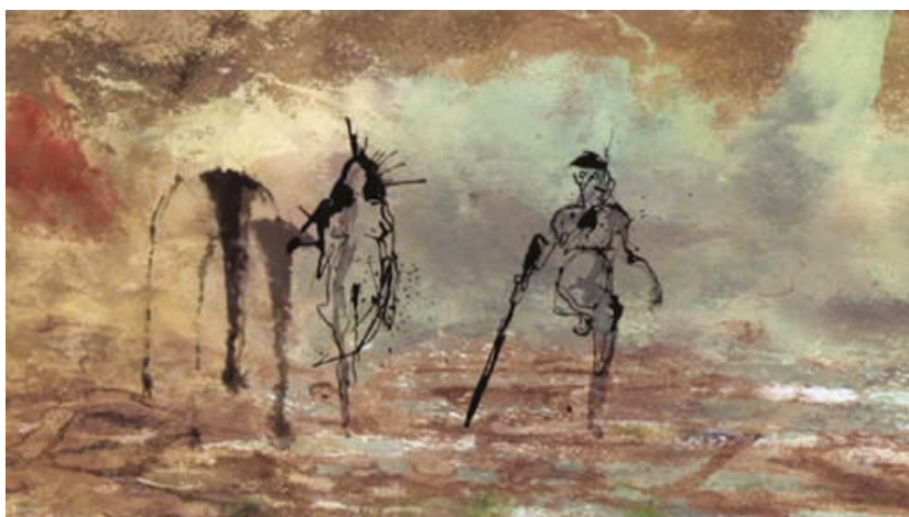
Fig. 4: Las secuencias animadas (00:16:03)