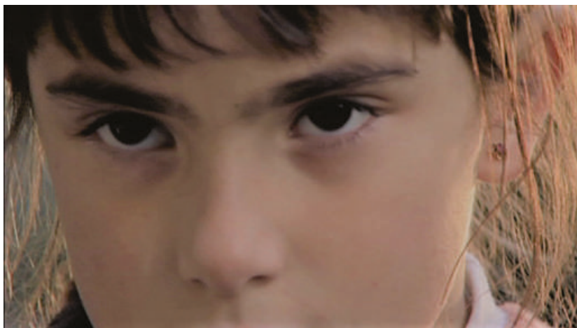
Fig. 2: La mirada de Nati (00:33:30)

En cambio, el acceso al mundo interior de Nati se realiza a través de cinco secuencias de dibujos animados de casi seis minutos en total que se intercalan en el desarrollo de la acción cada vez que Nati se siente particularmente angustiada por algo. 18 Este recurso, en el que radica en buena parte la originalidad de la película de Carri, no es tan singular como se podría pensar. Ya Carri había utilizado muñecos Playmobil para reconstruir algunas escenas de su infancia en el campo y del secuestro de sus padres en algunas secuencias de Los rubios . De igual modo, se integran secuencias de dibujos animados en otra película argentina reciente, Infancia clandestina (2012), de Benjamín Ávila. En todos los casos el recurso a la animación se relaciona con la representación de la violencia y el mundo y la perspectiva infantil.