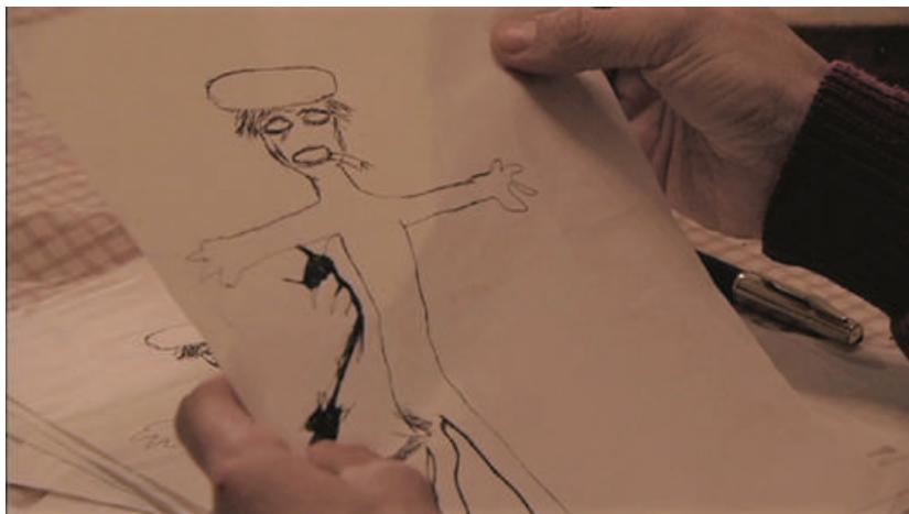
Fig. 3: Los dibujos de Nati (01:11:34)

ha creado para escapar a una realidad que de otro modo sería insoportable para ella. Al mismo tiempo, la actividad de Nati hace pensar en el papel desempeñado por los dibujos en el tratamiento de traumas psíquicos. 19