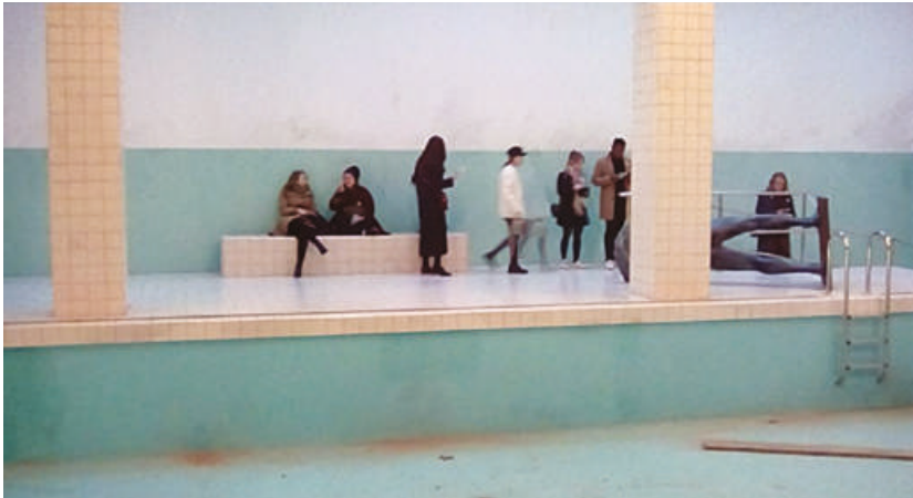
Fig. 2: Abandoned swimming pool installation. This is How We Bite Our Tongue exhibition at The Whitechapel Gallery, London, 2018

The Whitechapel Gallery [...] will be turned into suites for the moneyed hipster elite to huff designer drugs in, and its pool will become an opulent spa. You probably didn't know the Whitechapel had a pool, but it does. Been there since 1901 [...] Hockney painted it back in the day, apparently.