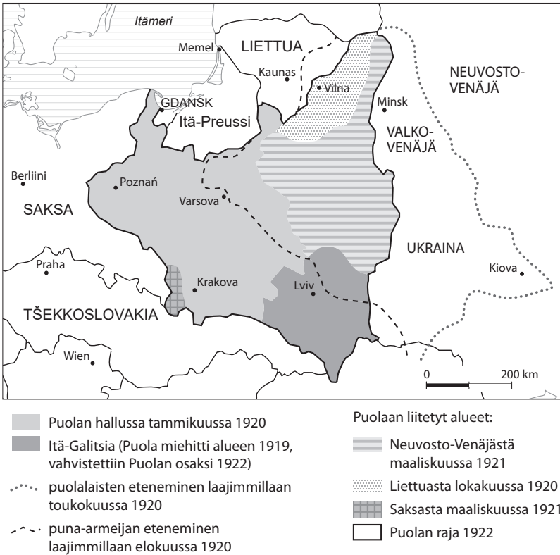
Kartta 3. Puolan ja Neuvostoliiton sota 1920.

ulkopolitiikan ekspansiiviset ulottuvuudet: heimoaatteeseen pohjaava Suur-Suomi ja Puolan Ukrainan, Valko-Venäjän ja Liettuan kattava ”federalio-ohjelma”. 61