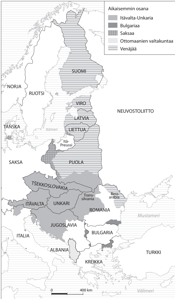
Kartta 5. Reunavaltiot vuonna 1925. © Spatio 2021.