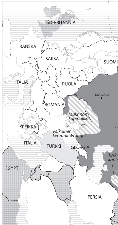
Kartta 4. Neuvosto-Venäjä sisällissodan päättyessä 1920–1921.

kansainvälinen konsortio. Sotateollisesti yhteistyö Saksan kanssa toisen tietotaitoa neuvostoarmeijan saataville, kun Saksa saisi kehittää Versaillesin rauhansopimuksen kieltämiä aseita Neuvosto-Venäjän alueella. Näin neuvostovallan vakiinnuttamiseen ja maan jälleenrakentamiseen tarvittava ”hengähdystauko” (ven. peredyška ) oli saavutettavissa kahdella tavoin. Huolimatta siitä, että vallankumouksellinen potentiaali Euroopassa oli vähentynyt, vuonna 1921 odoteltiin vielä mahdollisuuksia vallankumoukselle. Vuoden 1923 aikana Lenin kuitenkin alkoi kirjoittaa ”kapitalismin osittaisesta vakiintumisesta”, mikä lisäsi hengähdystauon