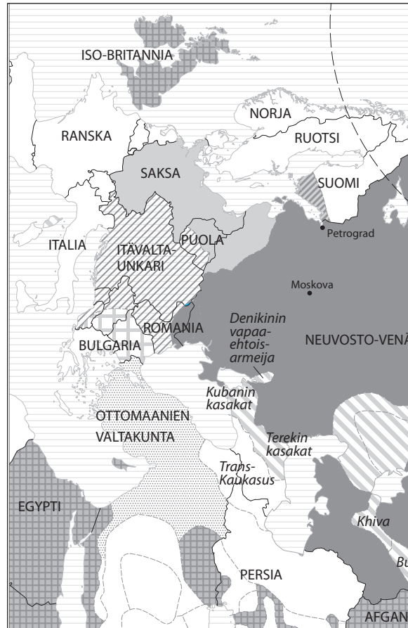
Kartta 1. Venäjän sisällisota ja Suomi sen osana helmikuussa 1918.

Nämä rakenteet maantieteen ohella tekevät ymmärrettäväksi sen, miten sisäpoliittiset kriisit 1920-luvulla saattoivat muodostua myös ulkopoliittisiksi uhkakuviksi reunavaltioiden ja Neuvostoliiton välillä. Tämä koskee niin Neuvostoliiton pakkokollektivisointia, Baltian maiden ja Puolan vallankaappauksia, kuin Lapuan liikettä Suomessa.