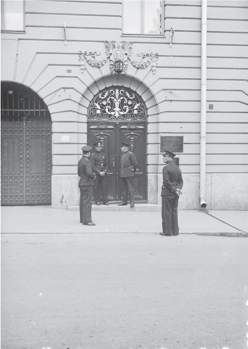
Neuvostoliiton lähetystö Helsingissä Bulevardin ja Albertinkadun kulmassa vuonna 1934. Lähetystön edessä on poliisivartio aiemmin sattuneen ampumavälikoh- tauksen johdosta. Kuva: Aarne Pietinen. Pietisen kokoelma/Historian kuvakokoel- ma, Museovirasto. Lisenssi CC BY 4.0.