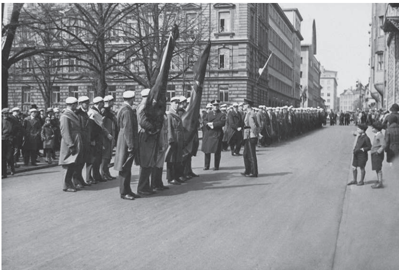
Ylioppilaiden hiljainen mielenosoitus Inkerin kansan puolesta Neuvosto-Venäjän lähetystöalon edustalla Helsingissä 1931. Kuva: Neittamo Oy. JOKA Journalistinen kuva-arkisto, Museovirasto. Lisenssi CC BY 4.0.