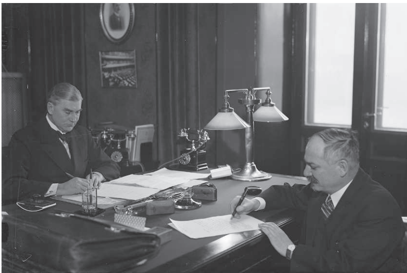
Neuvostoliiton ja Suomen välisen hyökkäämättömyyssopimuksen allekirjoittaminen 21.1.1932. Vasemmalla Suomen ulkoasiainministeri Aarno Yrjö-Koskinen ja oikealla Neuvostoliiton Suomen-lähettiläs Ivan Maiski.

myös Puolan Neuvostoliitto-suhdetta syksyllä 1931. Suomi esitti elokuussa hyökkäämättömyyssopimusneuvotteluja Neuvostoliitolle, ja Japanin hyökättyä Mantšuriaan syyskuussa 1931 Neuvostoliitto korosti sovinnonhaluaan. Näin Kaukoidän tilanne heijastui Suomen ja Neuvostoliiton välisiin suhteisiin ”pitkän 1920-luvun” loppuun asti. Molempipuolisten kompromissien jälkeen sopimus allekirjoitettiin viimein tammikuussa 1932. 422