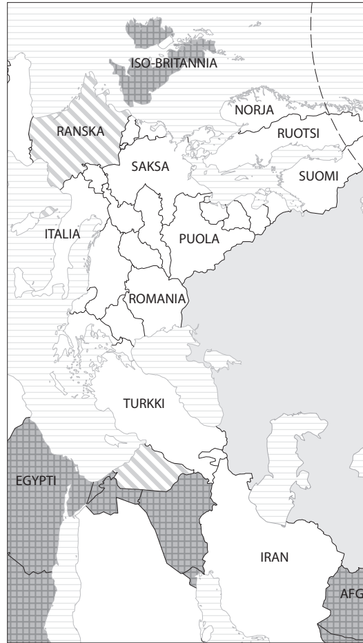
Kartta 6. Neuvostoliitto ja Kiinan sisällissota vuonna 1927. © Spatio 2021.

jännitteet heijastuvat Neuvostoliiton reuna- ja ulkopolitiikkaan sekä takuu- ja hyökkäämättömyyssopimusaloitteisiin sen välineinä myös Itämerellä.