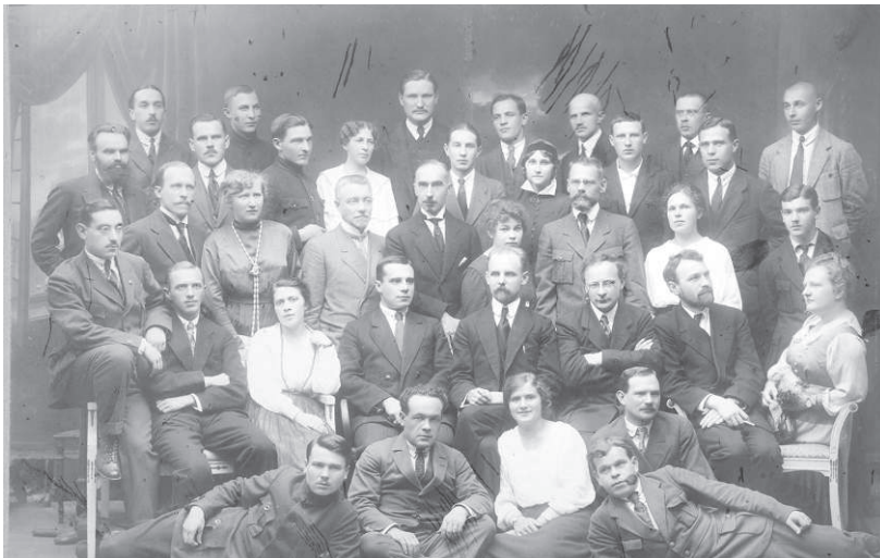
Neuvosto-Venäjän valtuuskunta Tarton rauhanneuvotteluissa lokakuussa 1920. Toisessa rivissä neljäntenä vasemmalta on Jan Antonovitš Berzin, josta tuli myös Neuvosto-Venäjän ensimmäinen edustaja Suomessa.

joukkoa muita, rajallisempia kysymyksiä. Näihin lukeutuivat muiden reunavaltioiden, mukaan lukien Suomen, kanssa kädyt neuvottelut.