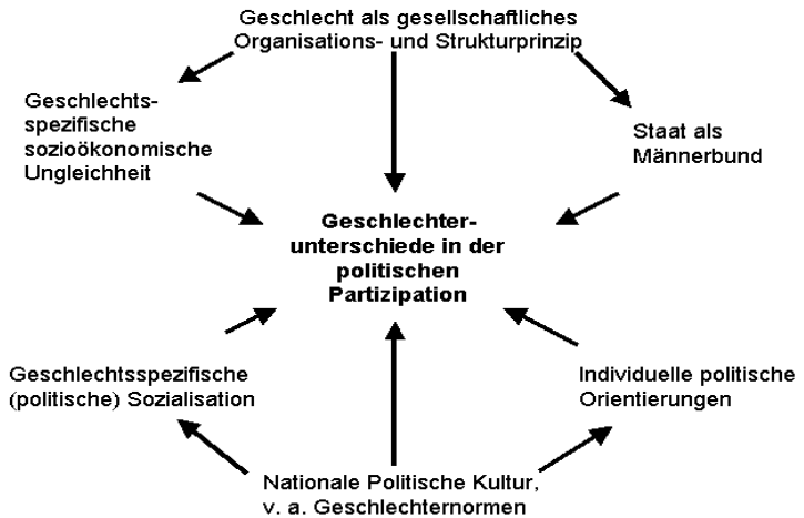
Abb. 1: Erklärungsansätze zu Geschlechterunterschieden in der politischen Partizipation