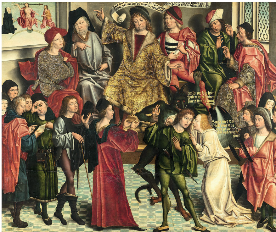
Abb. 1: Derik Baegert: Eidesleistung , 1493/94, Öl auf Holz, Städtisches Museum Wesel.

Die Spannung zwischen den beiden bildlich repräsentierten Rechtsprinzipien zeigt sich besonders frappant in der Art, wie der Rechtsakt des Eidschwurs auf Transzendenz bezogen wird: Der Richter selbst zeigt mit seiner rechten Hand auf eine Darstellung des Christus iudex, die als Bild-im-Bild in das linke obere Eck des Gemäldes eingefügt ist. Dass die Richterfigur nicht nur exakt die Gestik des Christus iudex wiederholt, sondern auch die ikonographisch konventionelle flankierende Begleitung Christi durch Maria und Johannes den Täufer strukturell in der Hauptszene dupliziert wird, könnte (ebenso wie das Bildmotiv des miraculös blühenden Aronstabs über der Christusfigur) als Anzeichen einer unmittelbaren Wirksamkeit der göttlichen Gerechtigkeit im weltlichen Rechtsakt gedeutet werden. Man könnte allerdings im expliziten Verweis auf ein dezentriertes Bildzitat und in der lediglich kompositorisch insinuierten Analogie umgekehrt auch eine unüberschreitbare Mittelbarkeit des Transzendenzbezugs akzentuiert sehen. Entsprechendes gilt für das explizite Verbot des falschen Schwurs, das auf einer kommentierenden Schriftrolle über dem Kopf des Richters formuliert ist,