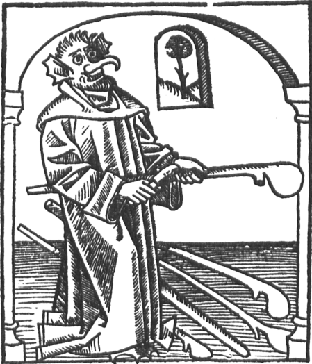
Abb. 1: Titelblatt der Inkunabel des Broder Rusche . Forschungsbibliothek Gotha der Universität Erfurt.

Insgesamt hat der Peritext 27 einen Verweischarakter und eine rahmende Funktion für die nachfolgende Narration: der Teufel wird als Schwankheld dargestellt, seine Listhandlung vorausgedeutet, der Handlungsort sowie der Enttarnungsort des Teufels dem Rezipienten suggeriert. Doch in der bildhaften Darstellung des Teufels korrespondiert der Titelholzschnitt nicht mit dem Inhalt der Verserzählung, es besteht eine, die Erscheinungsform des Teufels Rusche betreffende, deutliche Diskrepanz zwischen der Text- und der Bildebene. Während Rusche den Mönchen in der Erzählwelt stets in menschlicher oder in tierischer