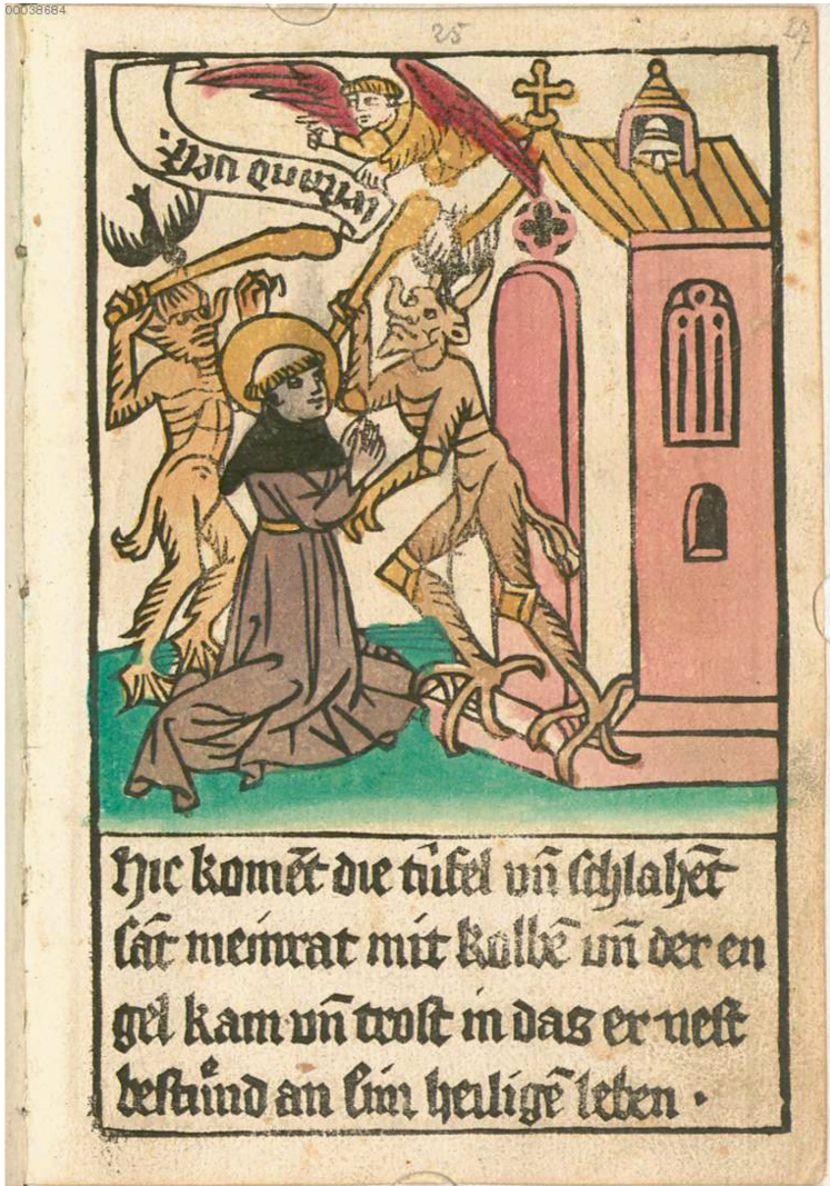
Abb. 1: Meinradlegende, [Blockbuch], S. [25].

Der „Ritter“ ist nach Eph 6,13 – 18 gut gerüstet, denn er trägt den „helm des heils, den schilt des glaubens und das schwert des geists“. Die Inszenierung christlichen, mehr noch: katholischen Sterbens führt einen Heiligen vor, der im Leben wie im Sterben vorbildlich ist. Die der Sterbeszene vorgeordnete Begegnung mit dem himmlischen Boten bezeugt zudem, dass die teuflische Beobachtung zwar