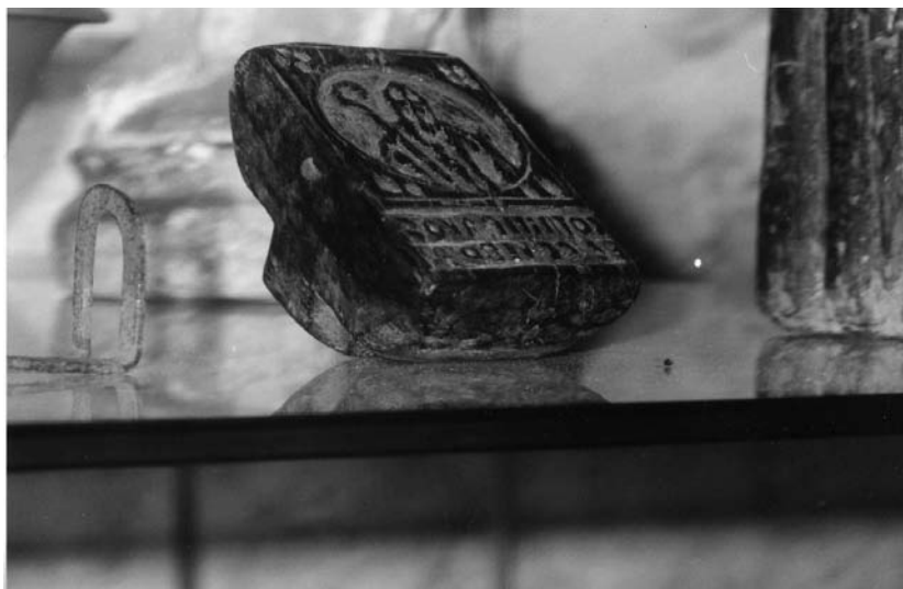
10. Tipario da pane ; Cerqueto (Teramo), Museo Folkloristico