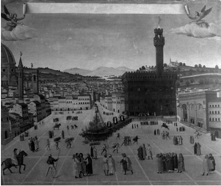
19. Francesco Rosselli (attr.), Supplizio di Girolamo Savonarola , tavola, 1498; Firenze, Museo di San Marco