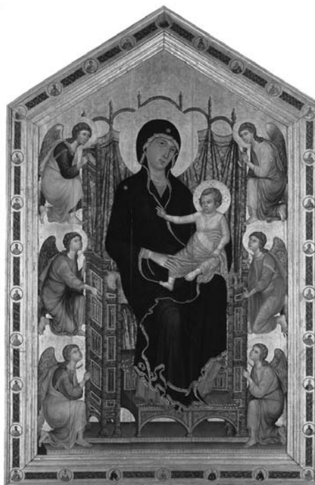
1. Duccio di Buoninsegna, Maestà Rucellai , tempera su tavola, 1285; Firenze, Galleria degli Uffizi