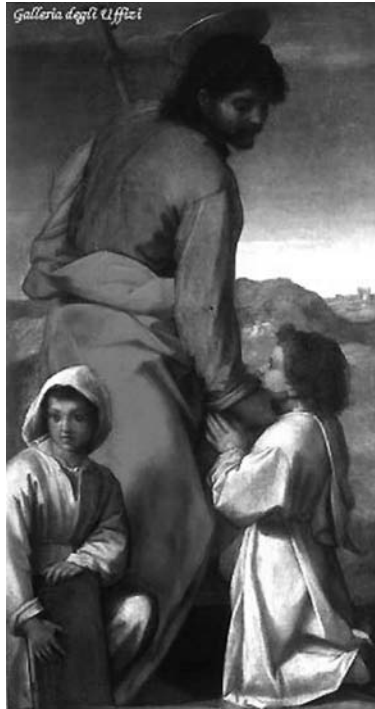
7. Andrea del Sarto, San Jacopo e due fanciulli membri della Compagnia di San Jacopo "del Nicchio" , olio su tela, 1528-1529; Firenze, Galleria degli Uffizi