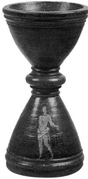
11. Bussolotto per votazioni con la figura di san Sebastiano , legno dipinto, seconda metà del sec. XVI, Buonconvento (Siena), Museo d'Arte Sacra della Val d'Arbia