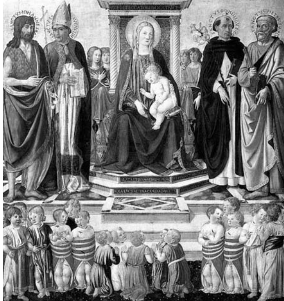
5. Cosimo Rosselli, La Madonna col Bambino, quattro santi e gli Innocenti , tavola, 1475-1480 ca.; Berlino, Staatliche Museen