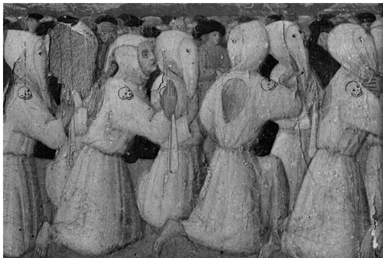
17. Ignoto seguace di Lorenzo di Piero detto "il Vecchietta", particolare della predella raffigurante San Bernardino predica ai disciplinati , tavola, 1444 circa; Siena, Pinacoteca Nazionale