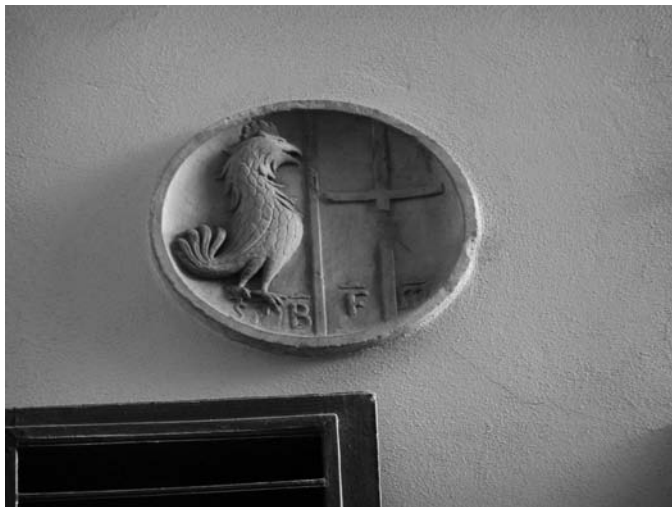
8. Formella con l'emblema della Compagnia della Misericordia e del Bigallo nel periodo della loro unione (1425-1525); Firenze, Borgo la Croce