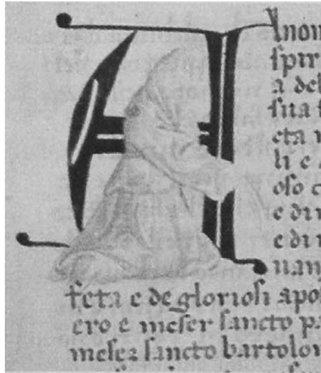
13. Membro della Compagnia di San Niccolò del Carmine impegnato nella flagellazione , 1431, miniatura in ASF, Capitoli di Compagnie religiose sopresse 439, c. 1r.