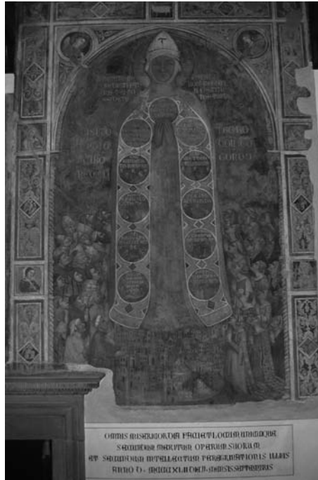
3. Cerchia di Bernardo Daddi (“Maestro di Barberino”), Madonna della Misericordia , affresco, 1342; Firenze, Sala dell’Udienza della Misericordia, poi del Bigallo