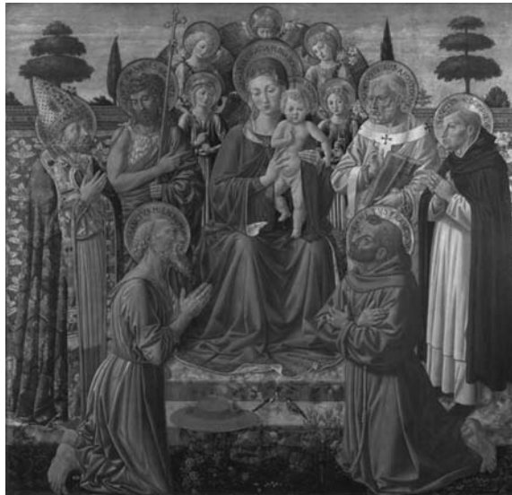
4. Benozzo Gozzoli, Pala della Purificazione , tavola, Londra, National Gallery