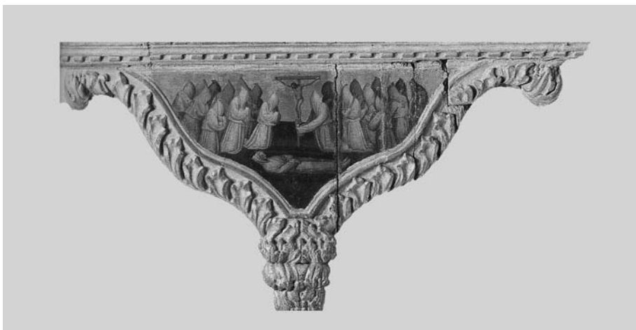
18. Niccolò di Pietro Gerini, Esequie di un confratello del sodalizio di Gesù Pellegrino , tavola, 1404-1408; Firenze, Galleria dell'Accademia