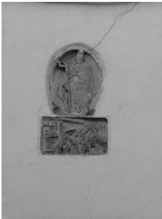
9. Formella con l'emblema della Compagnia di Sant'Eligio dei Maniscalchi ; Firenze, via San Gallo, presso via delle Ruote