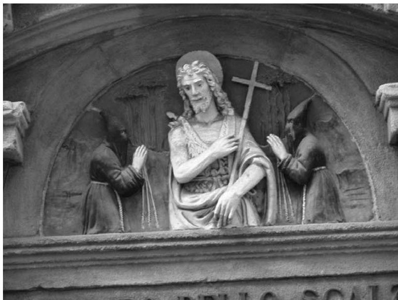
16. Benedetto Buglioni, San Giovanni Battista e due membri della confraternita detta dello Scalzo , terracotta invetriata, 1520 ca.; Firenze, Museo del Chiostro dello Scalzo, via Cavour