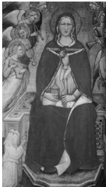
12. Spinello Aretino, Stendardo raffigurante la Maddalena in trono per la compagnia di discepoli di Santa Maria Maddalena di San Sepolcro , 1395-1400; New York, Metropolitan Museum