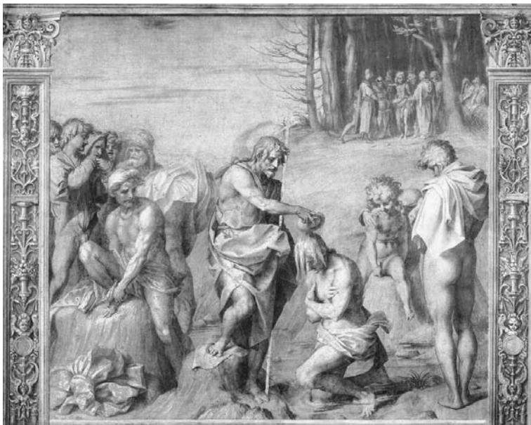
6. Andrea del Sarto, Battesimo di Cristo , affresco in terra verde, 1507-1508 ca.; Firenze, Chiostro dello Scalzo