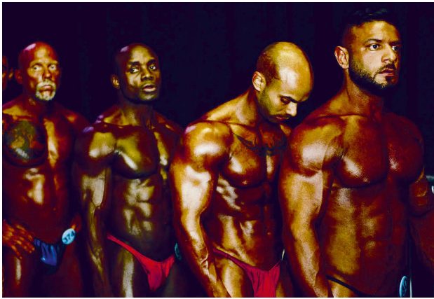
Las Vegas, 2019.

Die Formulierung »teils kulturkritische Kulturkritik« im Untertitel meines Aufsatzes besagt, dass ich selbst vor gewissen Klischees der Kulturkritik nicht gefeit bin. Ich beziehe mich hierbei auf den Begriff der Kulturkritik, wie Georg Bollenbeck ihn entwickelt hat. Kulturkritik zeichnet sich dem Germanisten zufolge durch einen