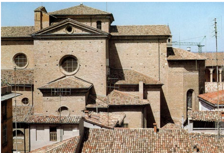
Figura 3. Faenza, Cattedrale, veduta da sud-est.