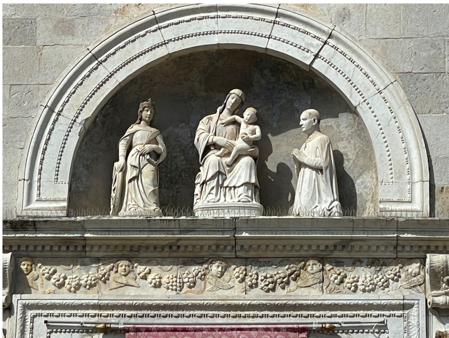
Figura 3. Maestranze lombarde, Madonna in trono con Bambino tra santa Caterina d'Alessandria e Onorato II Caetani , Fondi, chiesa di Santa Maria Assunta, ca. 1490.