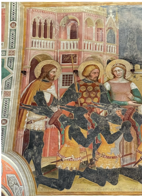
Figura 2. Altichiero da Zevio, Ritratti dei Lupi di Soragna e loro santi protettori , Padova, il Santo, oratorio di San Giacomo, ca. 1380.