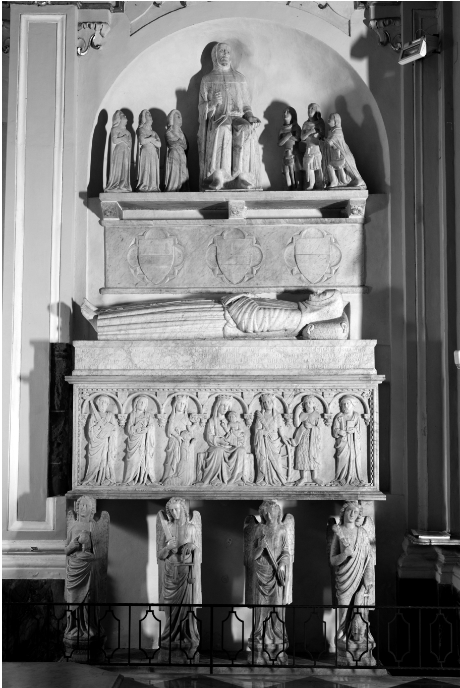
Figura 6. Monumento sepolcrale di Tommaso III Sanseverino, Mercato Sanseverino, chiesa di Sant'Antonio da Padova, ca. 1360.