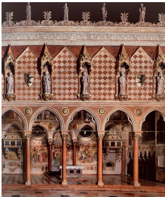
Figura 1. Altichiero da Zevio, Jacopo Avanzi, Andriolo de' Santi e bottega, e altri, Cappella di San Giacomo, Padova, il Santo, ca. 1372-1379.