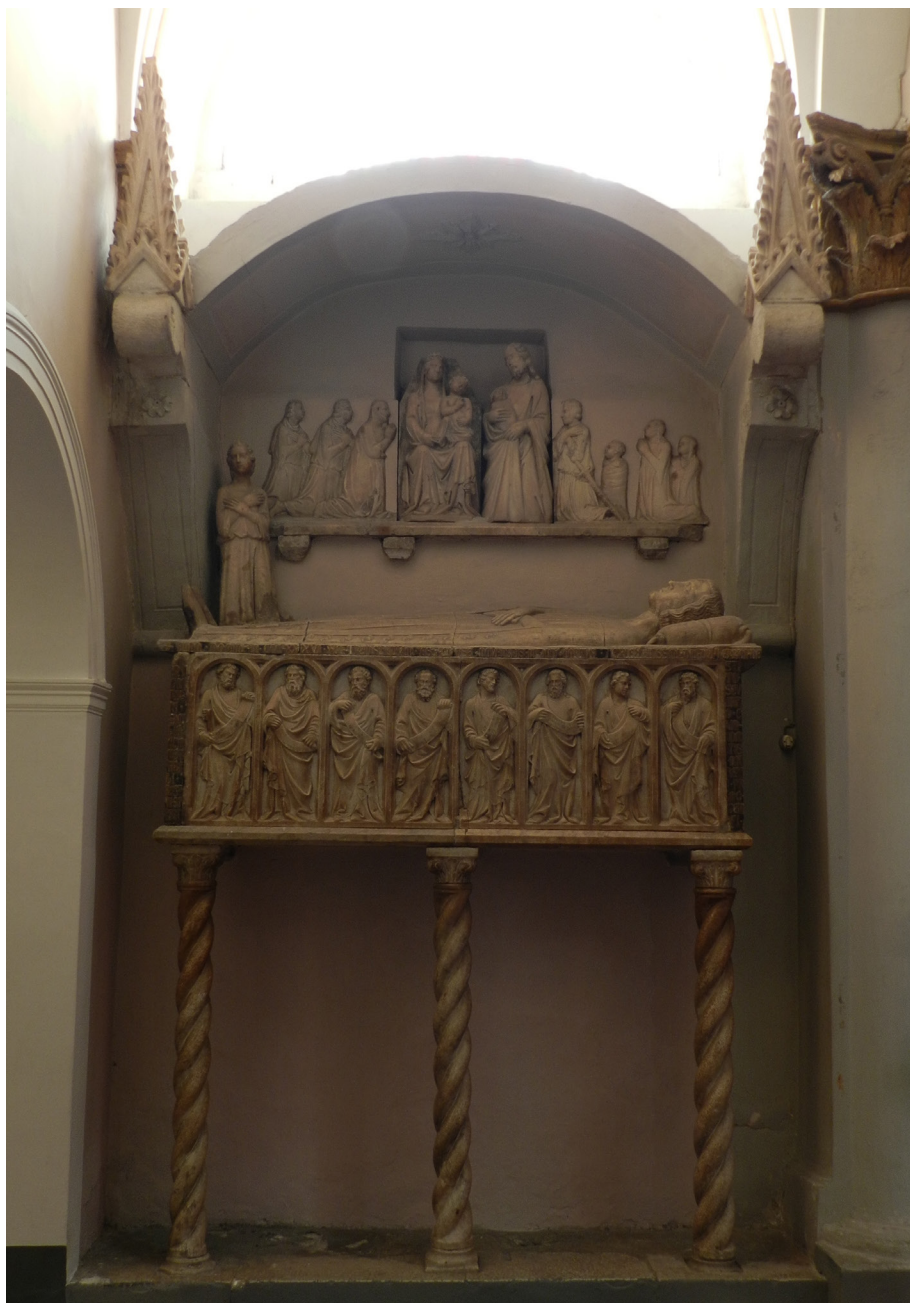
Figura 5. Bottega di Tino da Camaino (?), Monumento sepolcrale di Enrico II Sanseverino , Teggiano (Diano), chiesa di Santa Maria Maggiore, ca. 1330.