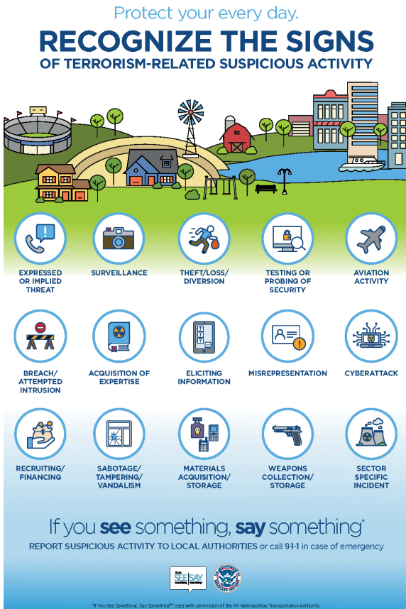
Abb. 1: Recognize the Signs

plexer kognitiver Schemata, um sie zu erkennen und rudimentärer Narrative, um sie mitzuteilen.