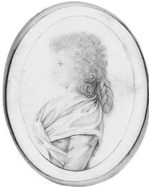
Abb. 19: Frauenportait von Unbekannt, um 1790 6,8 × 5 cm (Deutsches Literaturarchiv Marbach)