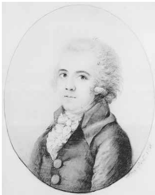
Abb. 12: Ludwig Ferdinand Huber, 1788 9 × 7 cm (Stiftung Weimarer Klassik und Kunstsammlungen)