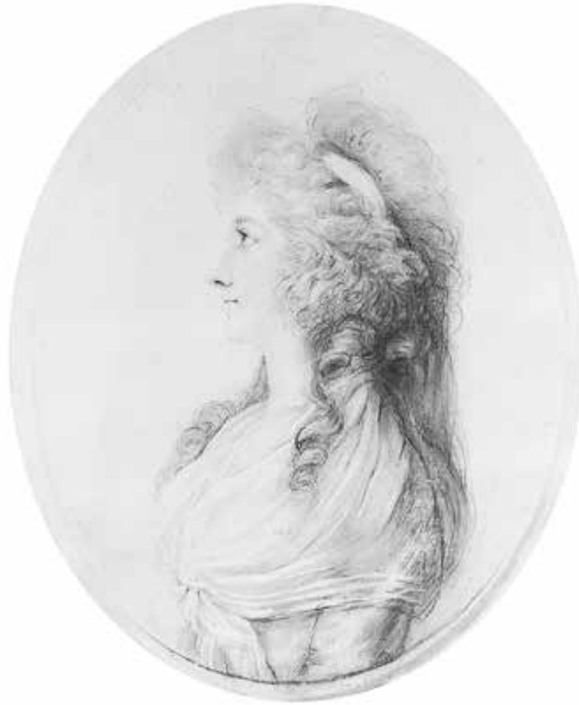
Abb. 14: Selbstporträt Johanna Dorothea Stock, 1789 10,4 × 8,7 cm (Stiftung Weimarer Klassik und Kunstsammlungen)