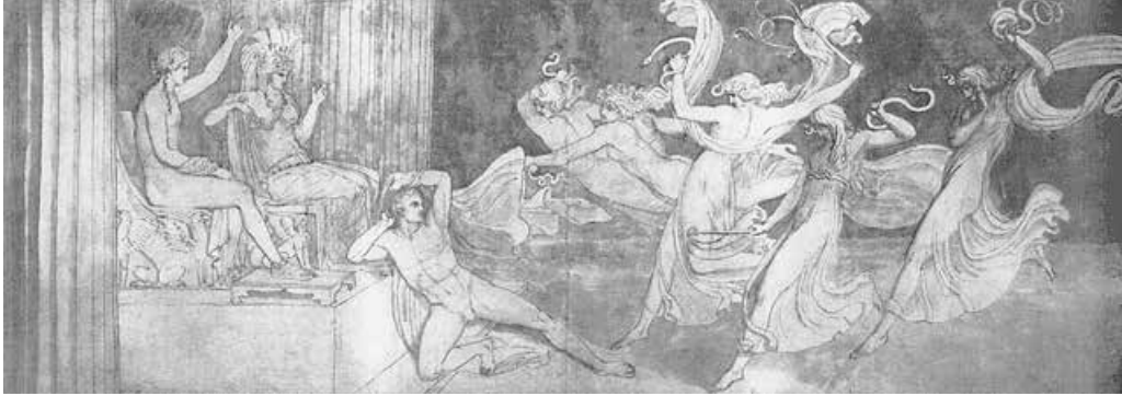
Abb. 3: Orest von den Erinyen verfolgt , 1795/1809 von J. Flaxman

(aus: John Flaxman. Mythologie und Industrie [Kunst um 1800], hrsg. v. W. Hofmann, München u. Hamburg 1979, S. 152, Abb. 167)