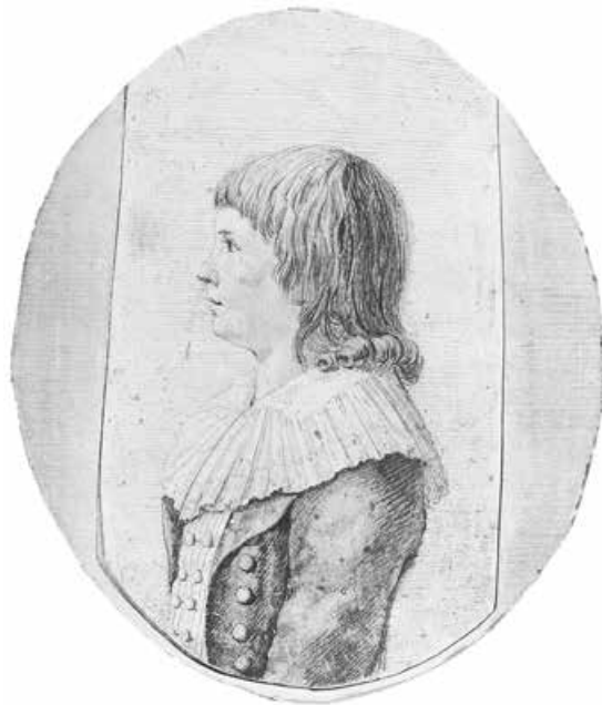
Abb. 23: Theodor Körner (?) von Gustav Georg Endner (?), Ende 18. Jh. 10 × 8,5 cm (Städtische Galerie Dresden, Kunstsammlung)