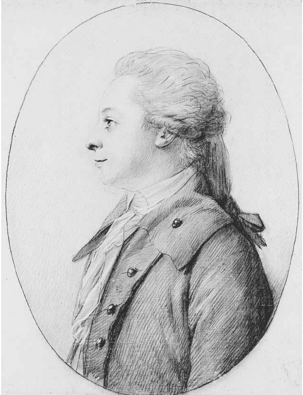
Abb. 8: Emil oder Christian August Prinz von Schleswig-Holstein-Sonderburg-Augustenburg, 1791 10,3 × 8,2 cm (Deutsches Literaturarchiv Marbach)