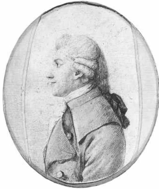
Abb. 22: Christian Gottfried Körner (?) von Gustav Georg Endner (?), Ende 18. Jh. 9 × 5,7 cm (Städtische Galerie Dresden, Kunstsammlung)