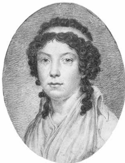
Abb. 25: Frauenporträt von Unbekannt, um 1790 9,8 × 7,7 cm (Kupferstich-Kabinett Dresden)