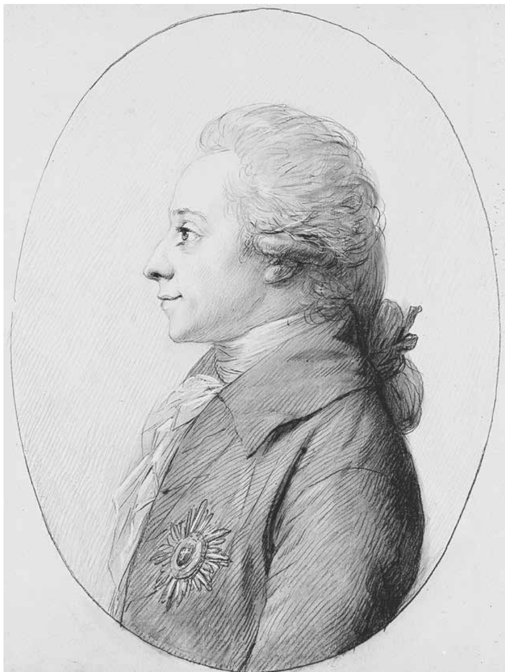
Abb. 7: Friedrich Christian Herzog von Schleswig-Holstein-Sonderburg-Augustenburg, 1791 10,3 × 8,2 cm (Deutsches Literaturarchiv Marbach)