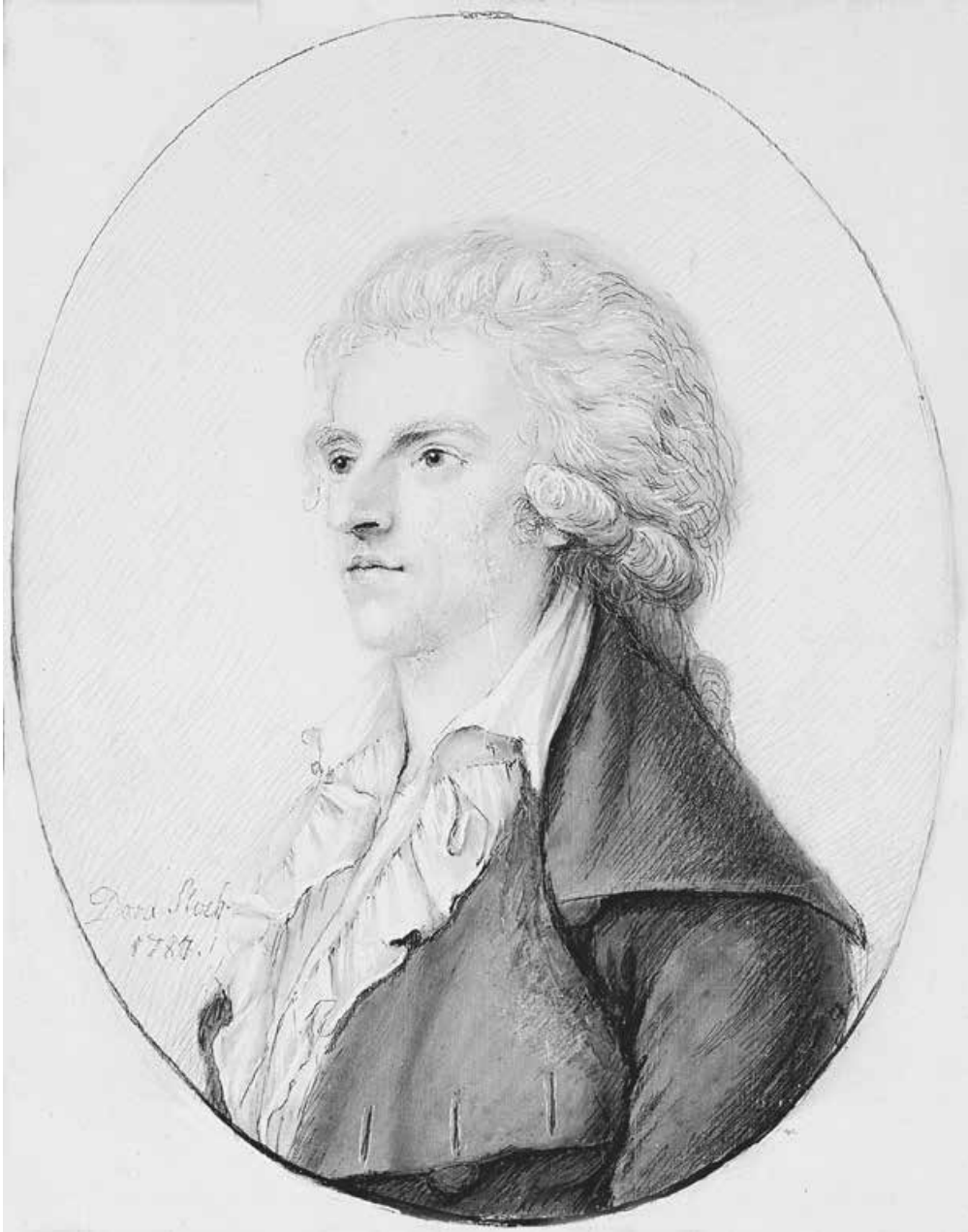
Abb. 5: Friedrich Schiller, 1787 10,8 × 8,8 cm (Stiftung Weimarer Klassik und Kunstsammlungen)