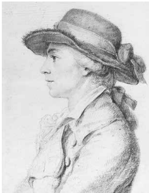
Abb. 15: Ludwig Ferdinand Huber, ca. 1788 9,7 × 7,5 cm (Städtische Galerie Dresden, Kunstsammlung)