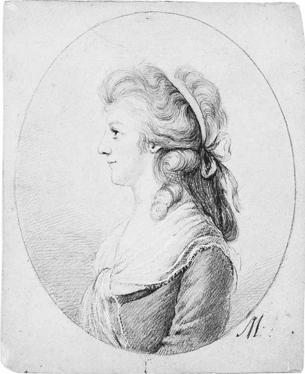
Abb. 3: Anna Maria Stock , 1784 10,4 × 8,4 cm (Deutsches Literaturarchiv Marbach)