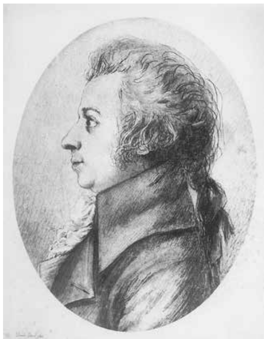
Abb. 16: Wolfgang Amadeus Mozart, 1789 Maße unbekannt