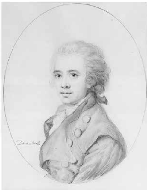
Abb. 13: Christian Gottfried Körner, um 1790 10,8 × 8,8 cm (Stiftung Weimarer Klassik und Kunstsammlungen)