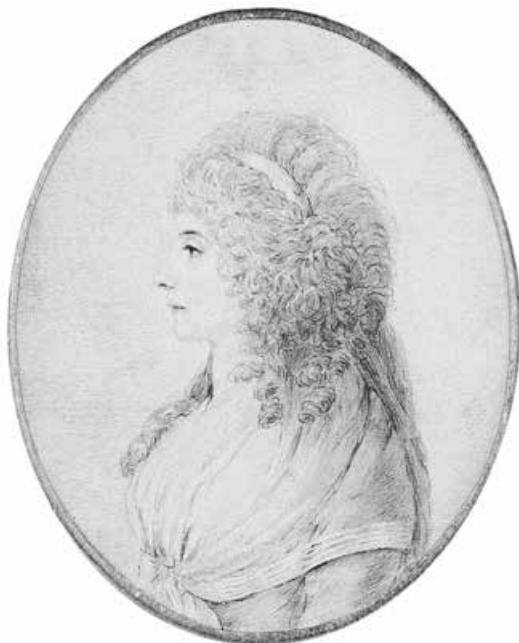
Abb. 20: Charlotte von Stein von Johanna Dorothea Stock (?) 9 × 7,5 cm (Rahmenausschnitt; Deutsches Literaturarchiv Marbach)