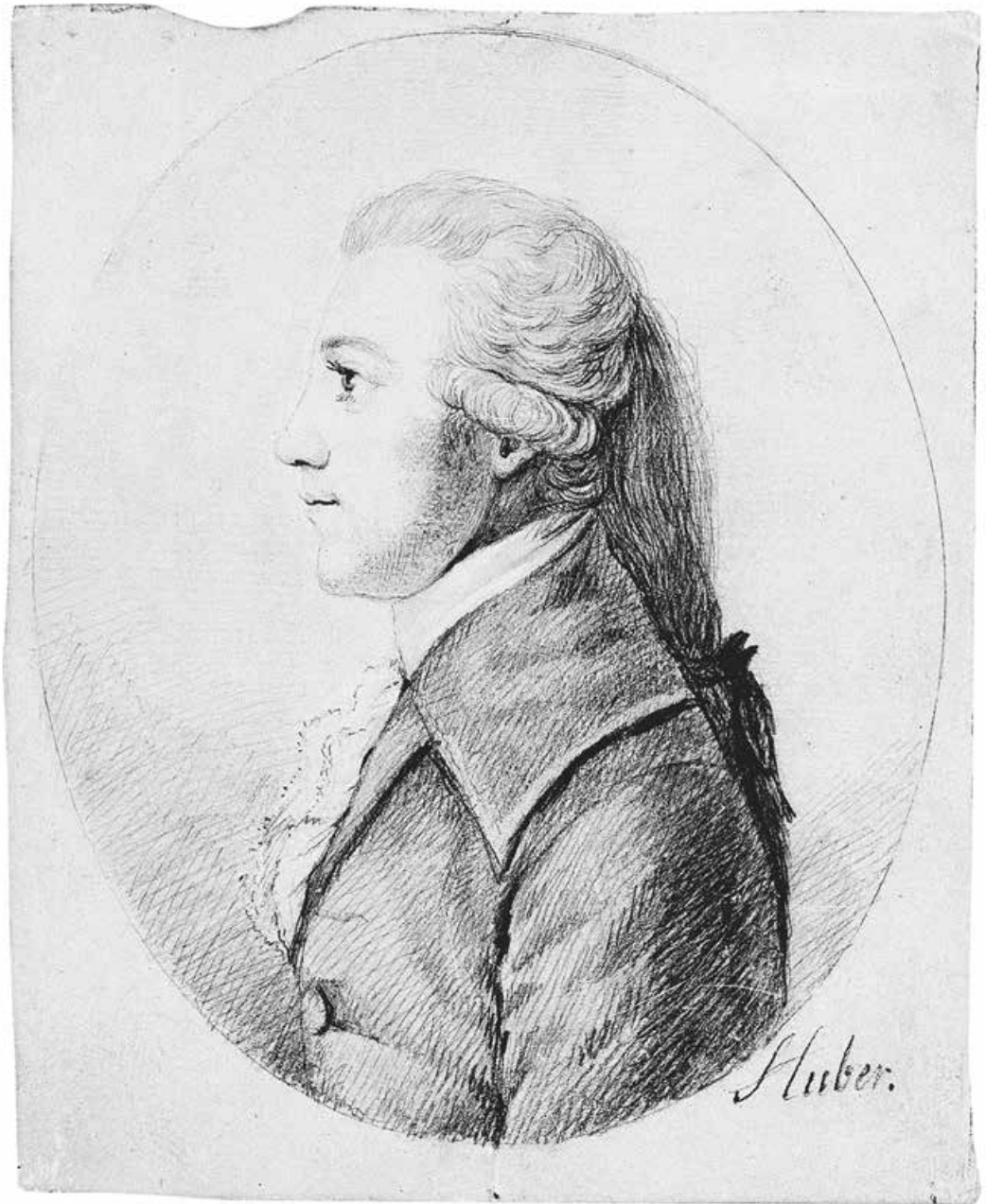
Abb. 2: Ludwig Ferdinand Huber , 1784 10,2 × 8,1 cm (Deutsches Literaturarchiv Marbach)