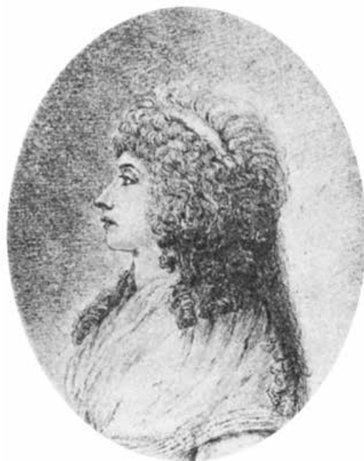
Abb. 21: Selbstporträt (?) Charlotte von Stein, um 1790 10,1 × 8 cm (Abb. aus: Renate Seydel [Hrsg.], Charlotte von Stein und Johann Wolfgang von Goethe , München 1993, S. 164)