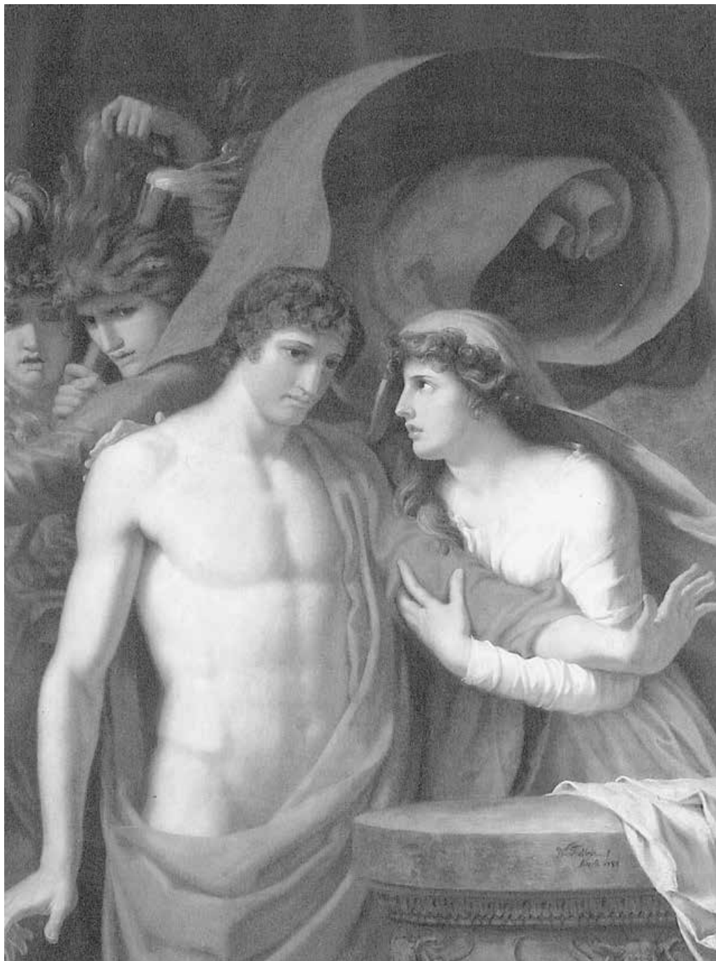
Abb. 1: Orest und Iphigenie / Iphigenie und Orest, 1788