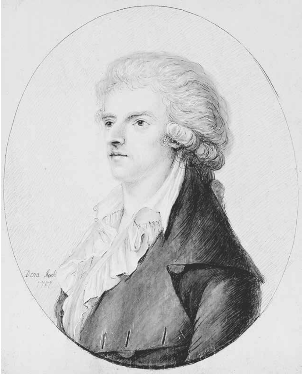
Abb. 6: Friedrich Schiller, 1787 10,9 × 8,6 cm (Deutsches Literaturarchiv Marbach)