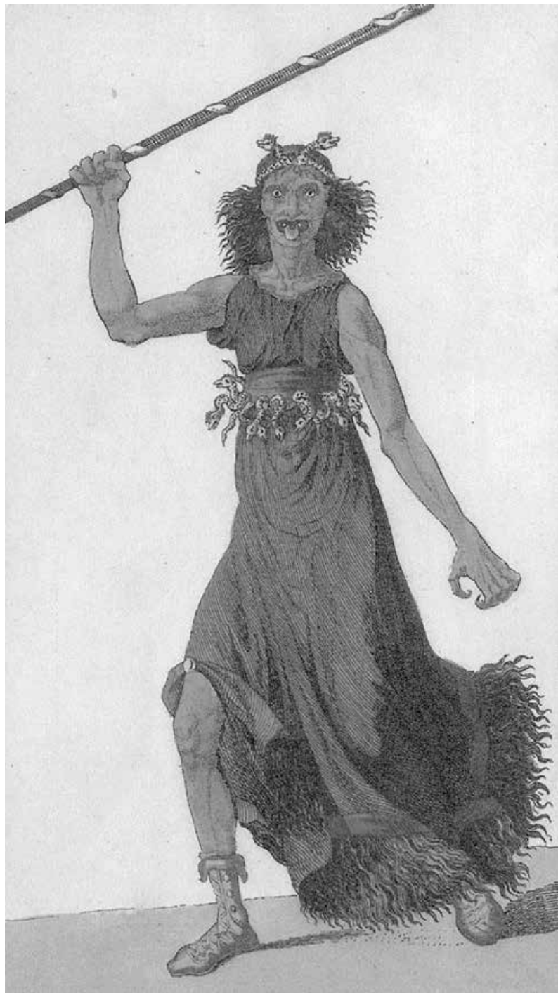
Abb. 6: Furie aus den Eumeniden des Aischylos, um 1801 von J. H. Meyer nach Vorgaben von K.A. Böttiger (aus: K. A. Böttiger, Die Furiemaske im Trauerspiele und auf den Bildwerken der alten Griechen, Weimar 1801, Tafel I )