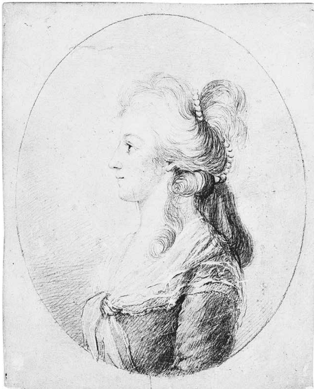
Abb. 1: Selbstporträt, 1784 10,2 × 8,3 cm (Deutsches Literaturarchiv Marbach)