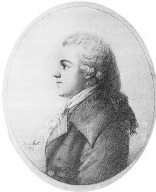
Abb. 11: Christian Gottfried Körner, 1786 Maße unbekannt