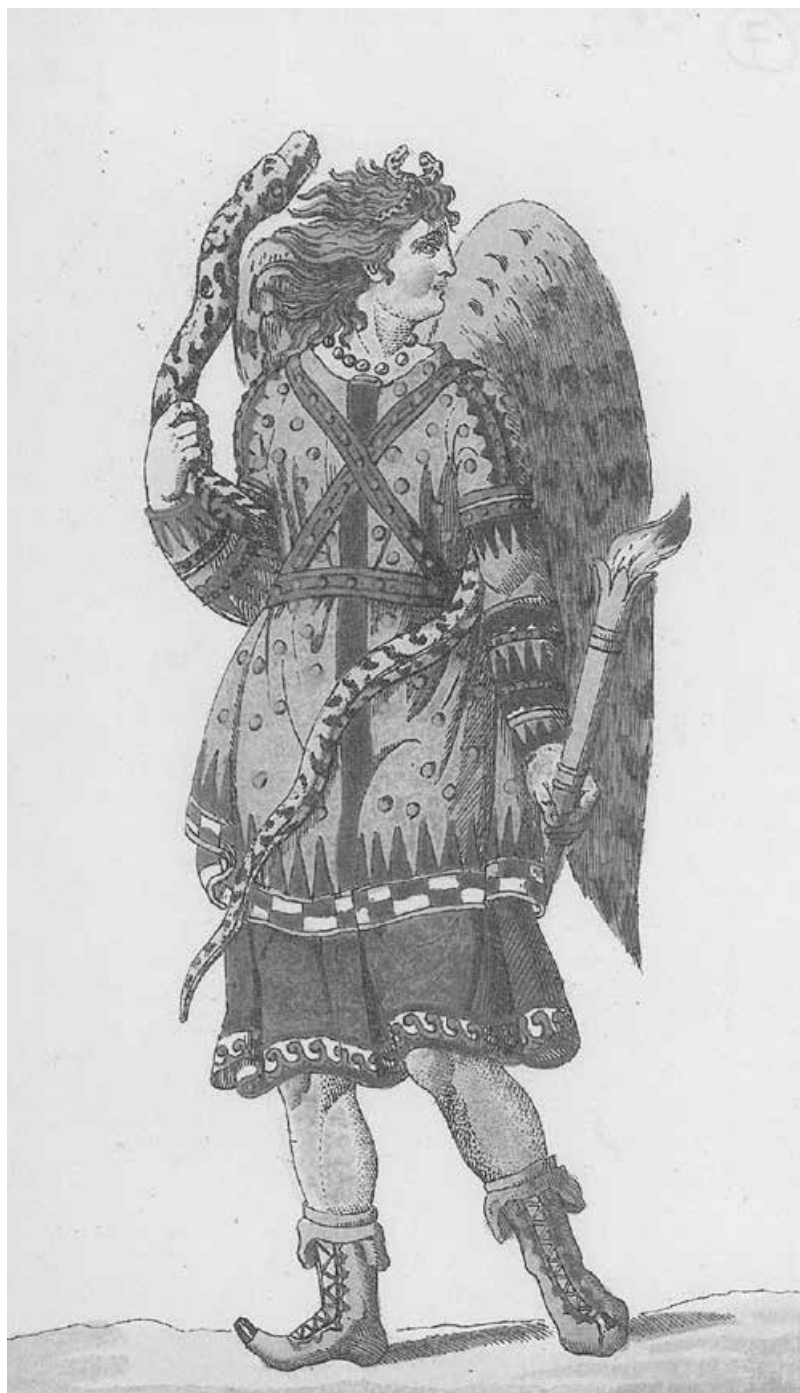
Abb. 7: Furie im späteren attischen Theater, um 1801 Nach einem antiken Vasengemälde der Sammlung Parois von J.H. Meyer (aus: K. A. Böttiger, Die Furiemaske im Trauerspiele und auf den Bildwerken der alten Griechen, Weimar 1801, Tafel II )