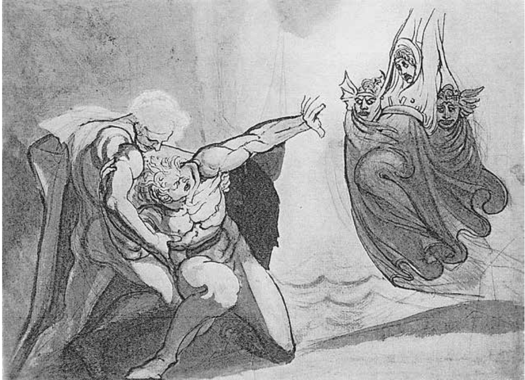
Abb. 4: Die Vision des Orest , um 1800 von J. H. Füssli

(aus: G. Schiff, Zeichnungen von Johann Heinrich Füssli [1741-1825] , Zürich 1959 [Kleine Schriften 2], Nr. 1424)