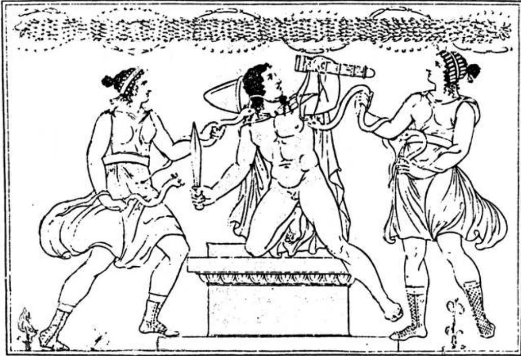
Abb. 8: Orest und die Furien

Nach einem antiken Vasengemälde der Sammlung Hamilton, 1791-95 von J.H.W. Tischbein