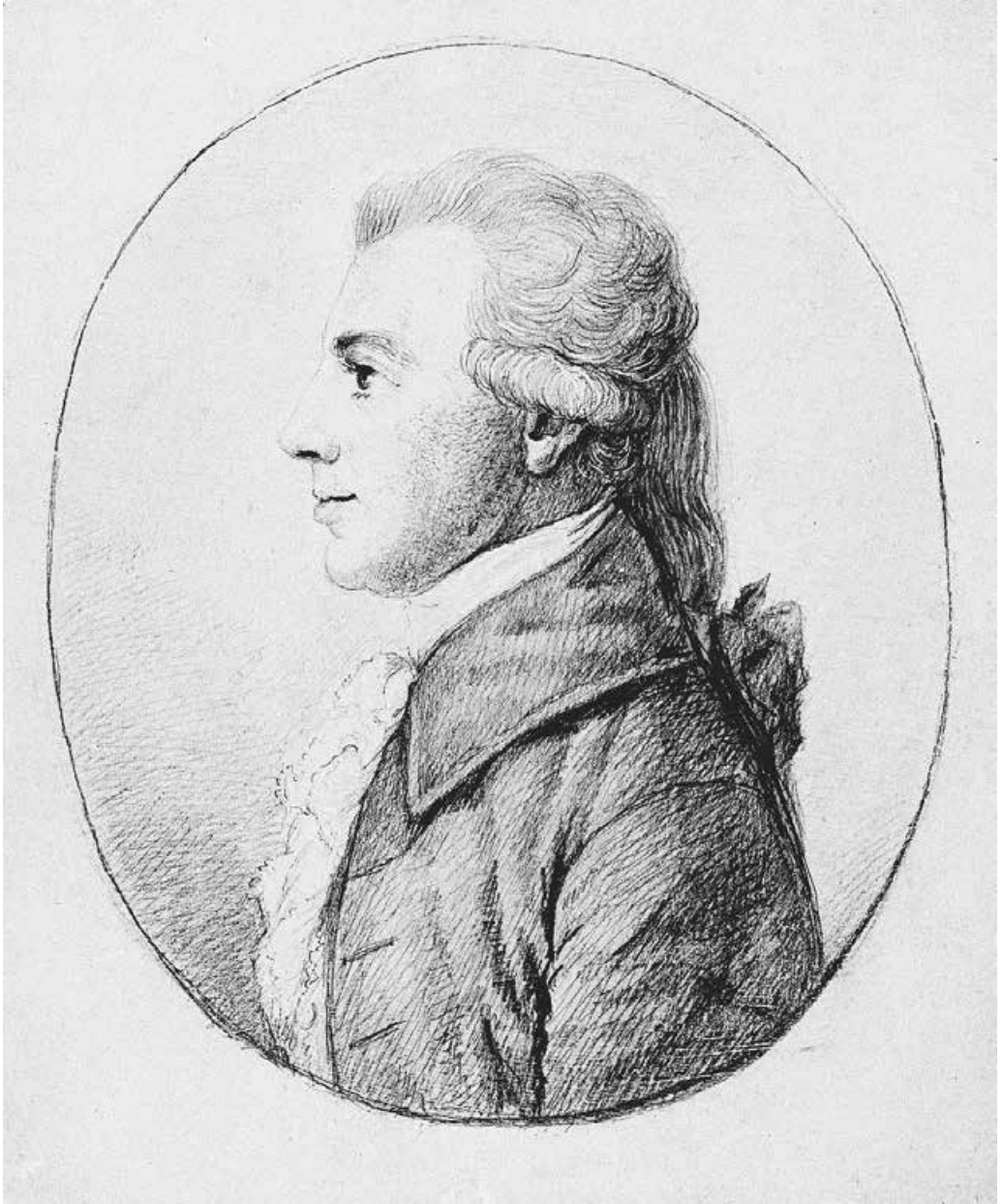
Abb. 4: Christian Gottfried Körner, 1784 10,1 × 8,5 cm