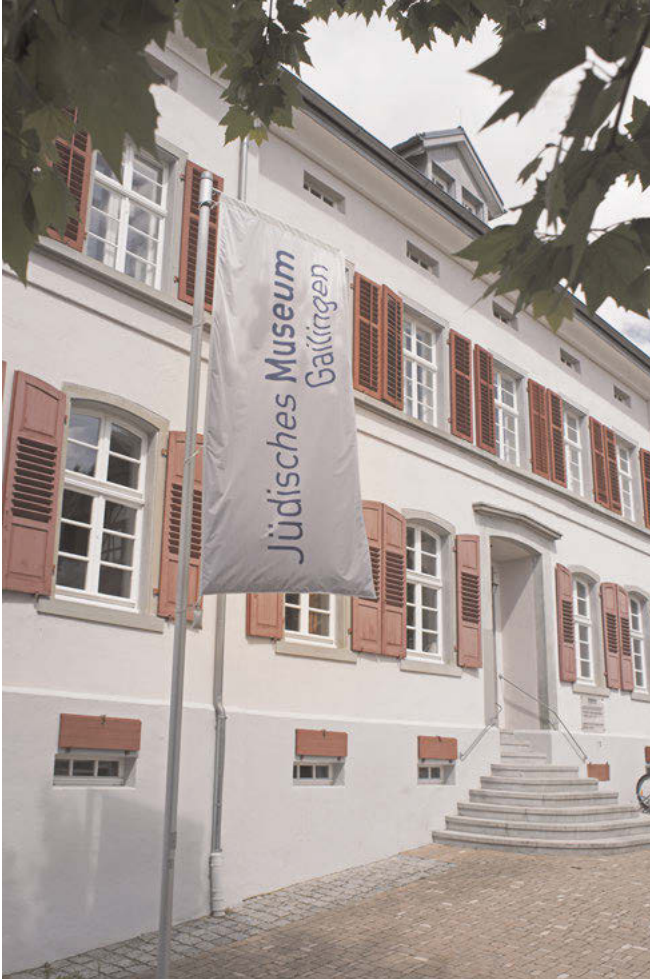
Abb. 10: Das Jüdische Museum Gailingen im ehemaligen jüdischen Schulhaus.

Das Jüdische Museum wurde seit seiner Gründung maßgeblich durch die Baden-Württemberg Stiftung, die Gemeinden im Hegau, den Landkreis Konstanz, die Gemeinde Gailingen sowie Unternehmen der Region und private Geldgeber gefördert. Unterstützung bekam das Museum jedoch auch grenzübergreifend aus der Schweiz vom Kanton Thurgau, von der Gemeinde Diessenhofen und vom Verein für die Erhaltung des Jüdischen Friedhofs Gailingen mit Sitz in Zürich. Auch Nachkommen der ehemaligen jüdischen Einwohner unterstützten den