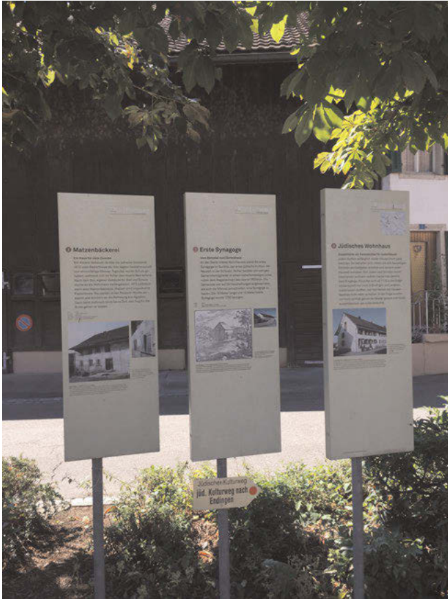
Abb. 21: Anhand von Schrifftafeln werden entlang des „Jüdischen Kulturwegs“ die Geschichte und Bedeutung einzelner Bauten vermittelt.

Vail 90 und Philip Rylands 91 . Der Kanton Aargau wollte hiermit ein Zeichen setzen zur Aufarbeitung der jüdenfeindlichen Geschichte, mit der sich der Kanton zuvor eher schwergetan hatte. Der Besuch eröffnete für die Region neue internationale Beziehungen, so beispielsweise Austauschprogramme für Kunststudenten in der Collezione Peggy Guggenheim in Venedig. Das Surbtal erfreute sich nun auch internationalen medialen Interesses aus Venedig, den USA und Eng-