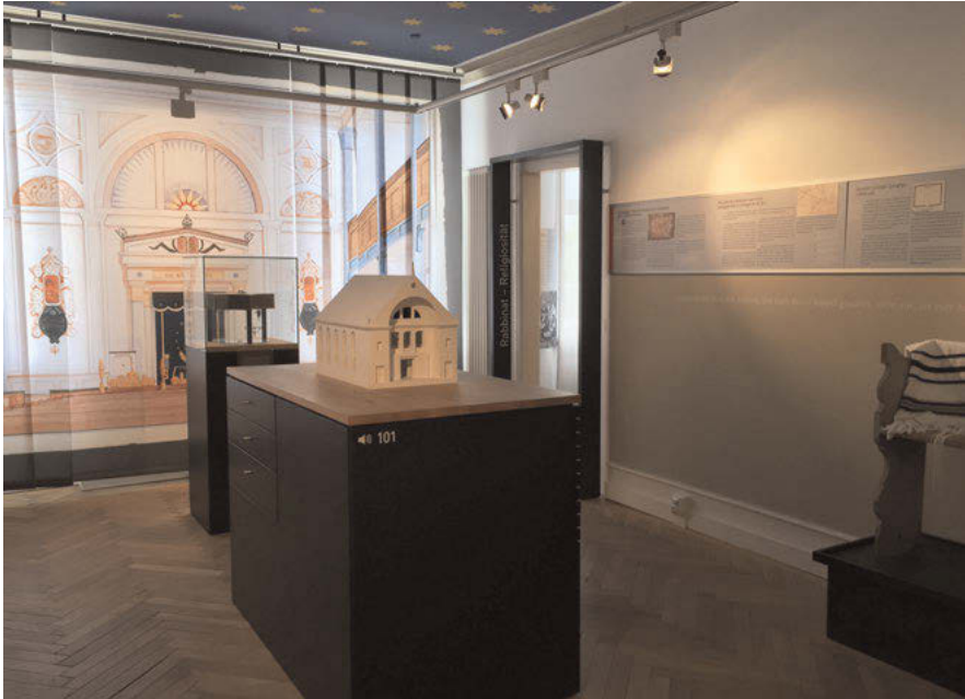
Abb. 11: Der erste Ausstellungsraum des Jüdischen Museums Gailingen vermittelt einen atmosphärischen Eindruck des ehemaligen Gotteshauses, zugleich werden Vorgänge in einer Synagoge anhand von Textpassagen und erhalten gebliebenen Objekten der Gailinger Synagoge erklärt.

men. Der erste Raum ist, wie der Titel bereits verrät, der ehemaligen Gailinger Synagoge gewidmet. Neben der Geschichte der Synagoge werden hier anhand von erhalten gebliebenen und geretteten Kultgegenständen und informativen Texten die religiösen Vorgänge und Funktionen der Objekte präsentiert und erklärt. Ein Modell der ehemaligen Synagoge sowie eine großformatige Abbildung des Gebetsraums geben einen Eindruck vom einstigen Gotteshaus.