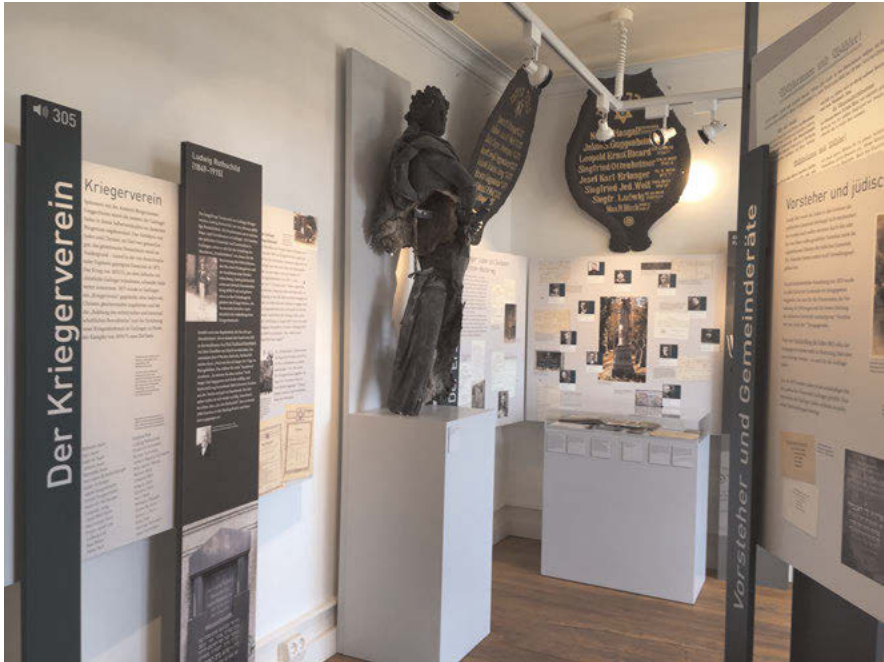
Abb. 13: Eine zentrale Rolle nehmen die Überreste des Kriegerdenkmals und die Gedenktafeln für jüdische gefallene Soldaten im Ausstellungsraum „Assimilation“ ein. Anhand dieser Präsentation soll die Gleichstellung jüdischer und christlicher Bürger Gailingens im ersten Drittel des 20. Jahrhunderts verdeutlicht werden.

Rechten und Pflichten 83 beschrieben. Zugleich werden in diesem Kapitel die Gleichstellung und Gleichheit der jüdischen Einwohner und ihrer christlichen Mitbürger mehrmals betont. Dies geschieht ebenfalls im Kapitel Der Kriegerverein , in dem unter anderem auf das zur Erinnerung der gefallenen Soldaten errichtete Kriegerdenkmal eingegangen wird.