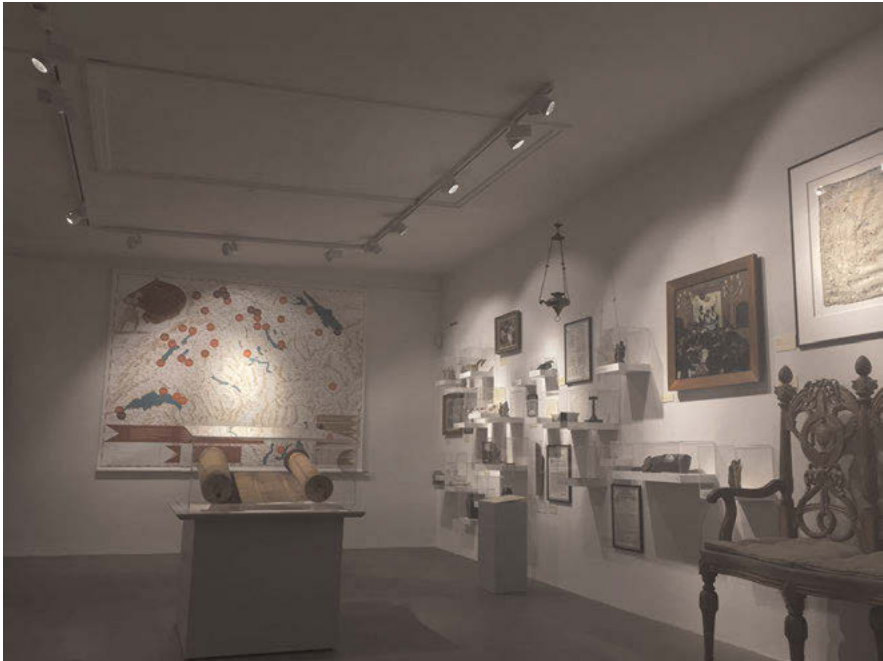
Abb. 3: Der Ausstellungsraum „Kultur“ des Jüdischen Museums der Schweiz Basel erzählt die Geschichte der Juden auf dem Gebiet der heutigen Schweiz in chronologischer Abfolge. Darstellungen der Gründungen jüdischer Gemeinden auf einer großformatigen Karte verweisen auf den Wendepunkt zur „Rückkehr“ der Juden.

zum Tod , den Schabbat und die jüdischen Feiertage. An den Ausstellungsraum Kult angrenzend befindet sich der größte Ausstellungsraum des Museums, der sich der Kultur zuwendet.