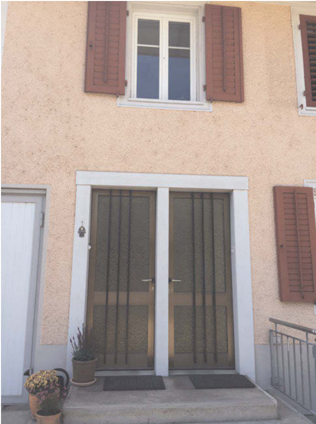
Abb. 19: Die Türen des Doppeltürhauses sind lediglich durch einen Türsturz getrennt, sodass die separaten Eingänge nicht sofort als solche erkennbar sind.

Sichtweise nach würden die Doppeltürhäuser als Symbol für Segregation gedeutet werden.