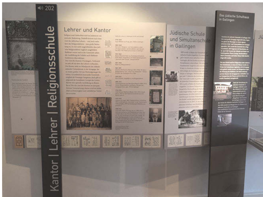
Abb. 12: Der Ausstellungsraum „Rabbinat und Religiosität“ des Jüdischen Museums Gailingen weist zwar die gleiche Textdichte wie der erste Ausstellungsraum „Die Gailingener Synagoge“ auf, jedoch dominieren hier die Textanteile durch ihre Positionierung, was wiederum die Ausstellungsobjekte in den Hintergrund rückt.

Ein weiterer Aspekt kann ebenfalls zu einer inneren Abwehr führen: die Wahl der Sprache in den Texten. Zu beachten ist, inwieweit die gewählten Formulierungen sachlich erklären bzw. aufklären und inwieweit sie belehren, womöglich den Besuchern eine Interpretation der Inhalte aufdrängen. In der Dauerausstellung des Jüdischen Museums wird neben der jüdischen Geschichte auch stets auf das Zusammenleben der christlichen und jüdischen Einwohner hingewiesen. Dabei wird das immer wieder aufkommende Spannungsverhältnis zwischen Mehrheit und Minderheit dargestellt. An mehreren Stellen der Ausstellung weisen die Formulierungen Wertungen und Fremdzuschreibungen auf, die von den Besuchern im Vorgang des Decodierens auf mehreren Deutungsebenen widersprüchlich aufgefasst werden könnten. Die Präsentation der Inhalte in der Dauerausstellung weist eine Ambivalenz auf zwischen einer Symbiose und Gleichheit von Juden und Christen vor 1933 einerseits und einer Betonung der Unterschiede andererseits. So werden jüdische Soldaten im Ersten Weltkrieg als „[...] ohne Einschränkung ‚vollwertige‘ deutsche Bürger und Soldaten mit allen