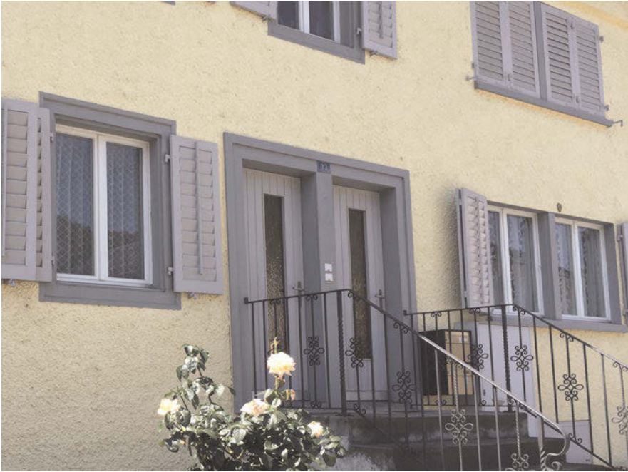
Abb. 20: Doppeltürhäuser stehen heute symbolisch für einen gemeinsamen christlich-jüdischen Wohnraum und sind zugleich durch ihre Besonderheit ein Merkmal für die „Judendörfer“ Endingen und Lengnau.

Metzgerei, das Pflege- und Altenheim sowie der gemeinsame jüdische Friedhof der beiden sogenannten Judendörfer . Obwohl die Gebäude und Stätten für jedermann stets sichtbar waren, sind sich noch heute zahlreiche Bewohner der Ortschaften des kulturellen Erbes und der Bedeutung der sie umgebenden Zeugen jüdischen Lebens nicht bewusst. Ein Grund mag auch darin liegen, dass die jüdischen Einrichtungen für Besucher lange Zeit geschlossen waren. Viele der historischen Gebäude waren in einem schlechten Zustand und drohten zu verfallen. Um das Jahr 1995 gab es eine Initiative, die ehemalige Matzebäckerei an der Vogelsangstrasse 7 in Lengnau zu erwerben und diese so vor dem Verfall zu schützen. Die Matzebäckerei wurde von 1875 bis 1910 von Samuel Daniel Guggenheim betrieben. Sie diente ebenfalls als Versammlungsort und Schule der jüdischen Gemeinde. Im Keller des Gebäudes befand sich eine Mikwe, ein rituelles Tauchbad. Nachdem der Ofen der Bäckerei stillgelegt wurde, wurden hier Mietwohnungen eingerichtet. Seit 1973 stand das Gebäude jedoch leer und verfiel. 1985 entstand die Idee, in der ehemaligen Matzebäckerei ein „modernes Besu-