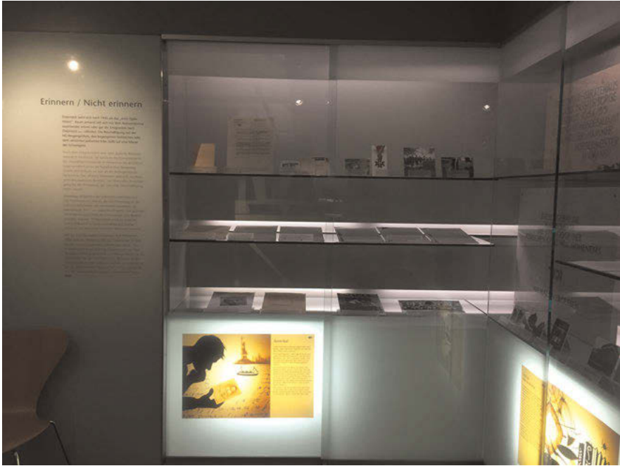
Abb. 9: Anhand von Fotografien, Dokumenten und dreidimensionalen Exponaten wird der Umgang der Marktgemeinde Hohenems mit dem jüdischen Erbe nach 1945 dargestellt, wobei die Ausstellungsstücke als Belege der Entwicklungen fungieren.

Auch wenn die Geschichte der jüdischen Gemeinde in Hohenems im Jahr 1940 durch ihre Zwangsauflösung endet, wird der Erzählstrang der Ausstellung weitergeführt. Hierin unterscheidet sich die Präsentation des Jüdischen Museums Hohenems von derjenigen zahlreicher Jüdischer Museen im alemannischen Sprachraum. Im letzten Kapitel des Rundgangs Erinnern/Nicht-Erinnern zeigt die Ausstellung den Umgang der Marktgemeinde Hohenems mit dem erhalten gebliebenen jüdischen Erbe nach dem Zweiten Weltkrieg. Konkret wird dies am Beispiel des Umbaus der ehemaligen Synagoge zum Feuerwehrhaus 1954/55 aufgezeigt. In den meisten Jüdischen Museen im untersuchten geografischen Rahmen endet der Ausstellungsrundgang mit der Zerstörung der jüdischen Gemeinden und des jüdischen Lebens vor Ort. Im Gegensatz zum Museum in Hohenems wird der Aufarbeitung der Geschichte sowie der Entstehungsgeschichte des jeweiligen Jüdischen Museums kein eigenes Ausstellungskapitel eingeräumt. Das Jüdische Museum Hohenems tut jedoch genau dies. Es spannt den Bogen von den Anfängen der jüdischen Gemeinde im Ort bis zur gegenwärtigen