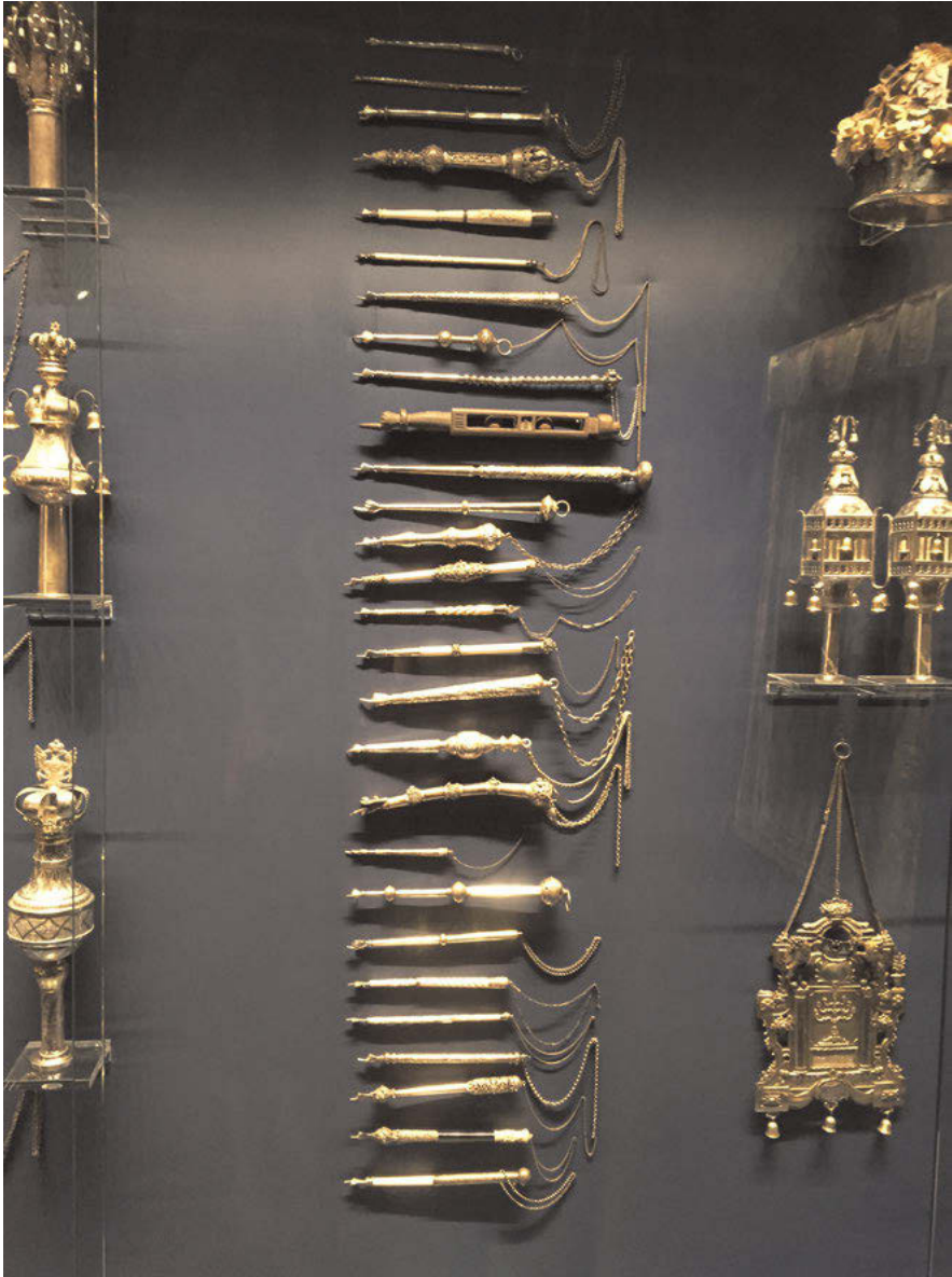
Abb. 4: In der Vitrine „Toraschmuck“ im Ausstellungsraum „Feiertag“ des Jüdischen Museums der Schweiz werden Toraschilder, Torazeiger und Rimonom in Form der Klassifikation präsentiert, wobei Gegenstände gleicher Funktion nebeneinander ausgestellt werden.