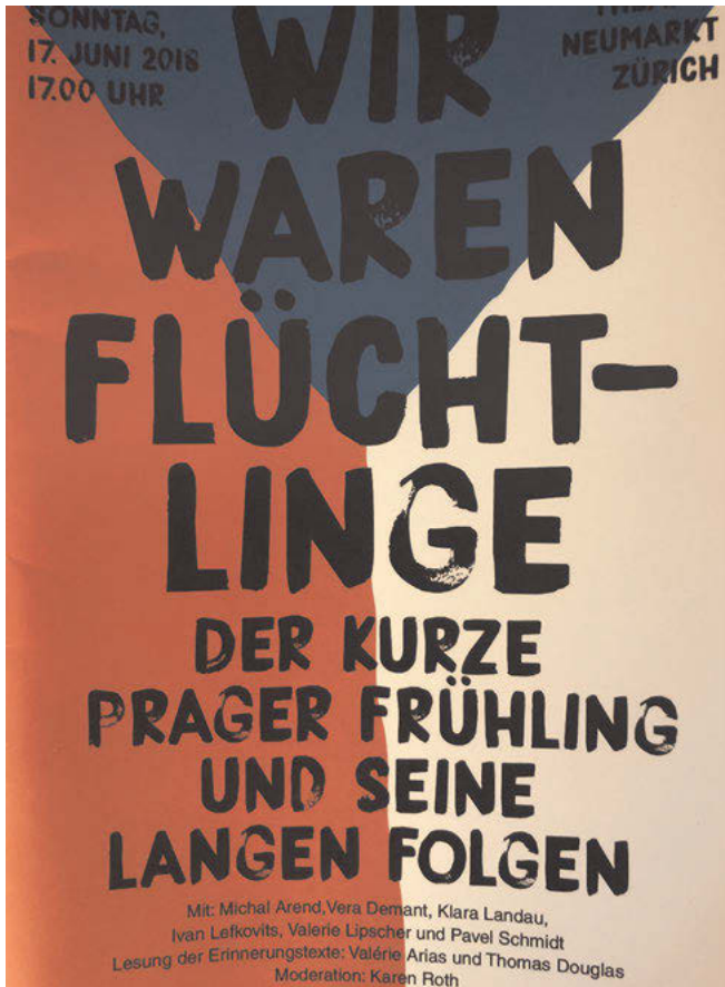
Abb. 18: Plakat zur Lesung „Wir waren Flüchtlinge – Der kurze Prager Frühling und seine langen Folgen“ im Theater Neumarkt, Zürich 2018.

führte insbesondere bei Studenten und Kunstschaffenden zu zahlreichen Missverständnissen. Denn Omanut hat generell keine Fördergelder zu vergeben, im Gegenteil ist der Verein selbst dazu gezwungen finanzielle Mittel aufzubringen, um Veranstaltungen durchführen zu können. 2. In der Anfangszeit des Vereins waren Dependancen in anderen Schweizer Städten geplant. Jedoch wurden die Aktivitäten in Genf, Basel und Luzern nach kurzer Zeit wieder eingestellt, sodass Omanut nur noch in Zürich aktiv ist. Die Einzigartigkeit von Omanut sollte sich nun auch im Namen zeigen. Die Abgrenzung zu anderen Vereinen sollte durch