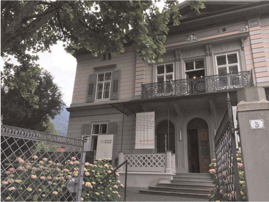
Abb. 6: Außenansicht Jüdisches Museum Hohenems in der Villa Heimann-Rosenthal.

In Bezug auf Forschung und auf wissenschaftlicher Ebene besteht eine Verbindung zum Verein Alemannia Judaica und insbesondere eine Vernetzung durch die Europäische Sommeruniversität für Jüdische Studien in Hohenems. Die Sommeruniversität begann 2005 ursprünglich als SommerUniversitätMünchen (SUM) des Lehrstuhls für Jüdische Geschichte und Kultur am Historischen Seminar der Ludwig-Maximilians-Universität in München. 58 Daraus entstand in den folgenden Jahren eine gemeinsame internationale Sommeruniversität für jüdische Studien der Universitäten München, Salzburg und Basel, die seit 2009 weiterhin jährlich in Hohenems stattfindet. Seit ihrem Bestehen hat sich der Kreis der beteiligten Universitäten erweitert: 2011 kam die Universität Wien, 2012 die