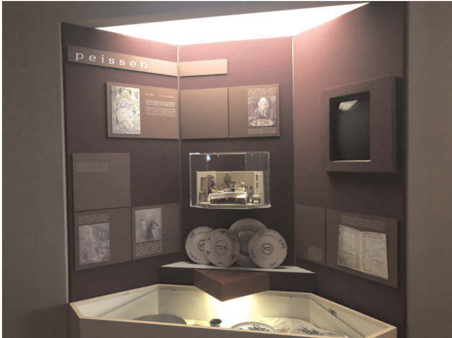
Abb. 17: Szenisch wird anhand von Miniaturfiguren in einer kleinen Vitrine der Sederabend im Musée Judéo-Alsacien de Bouxwiller dargestellt. So soll ein Einblick in die jüdisch-elsässischen Traditionen vermittelt werden.

ist lediglich ein Teil des letzten Ausstellungsraums gewidmet, genauer gesagt das Kapitel Widerstand und Wiederaufbau und die Rotunde am Ende des Ausstellungsrundgangs. Dabei steht mehr das Kulturerbe und die Beziehung zu Israel im Mittelpunkt der Präsentation und weniger das Judentum in der heutigen Zeit an sich.