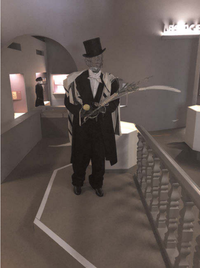
Abb. 15: An mehreren Stationen der Dauerausstellung finden sich lebensgroße Drahtskulpturen, welche die thematisierten Schwerpunkte der Ausstellung aufgreifen und sinnlich erfahrbar machen. Hier wird das jüdische fest Sukkoth präsentiert.

der Geschichte der Juden im Elsass vom Mittelalter bis zur Französischen Revolution gewidmet. Im Übergang zum angrenzenden Ausstellungsraum befindet sich eine Glasplatte auf dem Boden, durch welche die Besucher den ursprünglichen Bodenbelag der Synagoge sehen können. Dies ist das einzige noch erhaltene Stück im Inneren der Synagoge, welches nach den Umbauten des Hauses noch so bewahrt worden ist, wie es nach dem Krieg vorgefunden wurde. Der folgende Ausstellungsabschnitt ist der Existenz und Koexistenz gewidmet. Hier stehen Religion, Sprache, Zahlen, Essen, Bekleidung sowie die Berufe der Landjuden im Fokus der Präsentation. Besonders augenscheinlich sind der zentral im