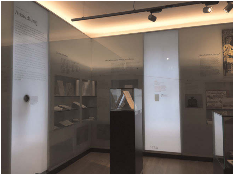
Abb. 8: Die Aufteilung der Textpassagen und ihre Positionierung um die Vitrinen herum, stellt die Exponate in den Mittelpunkt. Wie hier im Ausstellungsraum „Ansiedlung“ des Jüdischen Museums Hohenems wird der Blick der Besucher auf die ausgestellten Objekte gelenkt.