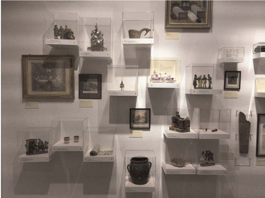
Abb. 5: Die Kabinethängung im Ausstellungsraum „Kultur“ bietet anhand der Exponate Einblicke in die damalige jüdische Kultur sowohl aus der Perspektive der Selbstdarstellung als auch der Fremdzuschreibungen.