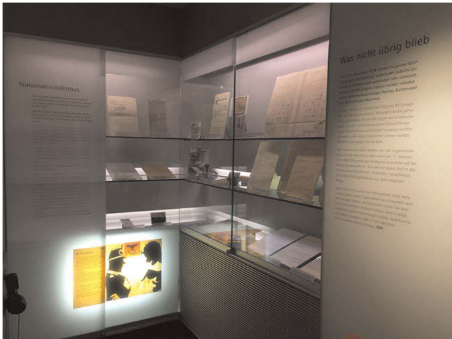
Abb. 7: Im unteren Bereich der Vitrinen, auf Augenhöhe der jüngsten Besucher, befinden sich Scherenschnittbilder mit Textpassagen, die die Themen der „großen“ Ausstellung aufgreifen und altersgerecht vermitteln. Hier im Dachgeschoss des Jüdischen Museums Hohenems im Kapitel „Nationalsozialismus“ zu sehen.

Auf der Augenhöhe von Kindern, eingebettet in die Dauerausstellung, verläuft die speziell für Kinder und Jugendliche entwickelte Ausstellung. Themen und Inhalte der Dauerausstellung werden an verschiedenen Stellen aufgegriffen und anhand von Scherenschnittbildern und kurzen Textpassagen an die jüngsten Besucher des Museums vermittelt. Der Ausstellungsrundgang beginnt zunächst mit einem kleinen Raum, der ausschließlich dem Leben und Werk von Salomon Sulzer 61 gewidmet ist. Im angrenzenden Ausstellungsraum beginnt der chronologisch verlaufende Rundgang durch die Dauerausstellung. Im ersten Ausstellungskapitel, Ansiedlung , steht zugleich die Frage „Warum sind wir hier?“ im Fokus der Präsentation. Anhand der Unterthemen Markt beleben , Vertreibung