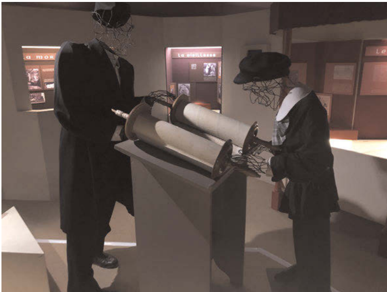
Abb. 16: Lebensgroße Drahtskulpturen ermöglichen eine sinnliche Erfahrung einer Lernsituation, wie sie zur Bar-Mizwa ablaufen könnte.

mal jedoch aus einem anderen Jahrhundert. In dem dunkel gehaltenen Gang erstrecken sich zu beiden Seiten nachgebildete Läden mit Schaufenstern, in denen anstelle von Waren historische Inhalte präsentiert werden. Am Eingang in die Judengasse werden in einem Schaukasten Fotografien der ehemaligen Rue de Juifs präsentiert, sodass Besucher die inszenierte Gasse als eine Judengasse decodieren können. Durch die Einbettung von Artikeln, Büchern, Fotografien und einzelnen dreidimensionalen Objekten in die Inszenierung der Schaufenster der Einkaufsläden werden den Exponaten neue Konnotationen zugeschrieben. Aus ihrem ursprünglichen Kontext und den Funktionen herausgenommen, dienen die Ausstellungsobjekte in der Präsentation nun als Zeugen und zur Vermittlung ihrer Zeit. Die szenische Konstruktion wird auch hier abgerundet durch einen mit Steinen gepflasterten Boden und Straßenlaternen, welche die ästhetische Erfahrung eines real existierenden Ortes unterstützen. Solche räumlichen Gestaltungen beziehen sich in der Regel zwar auf historische oder auch aktuelle Orte und Kontexte, jedoch können sie auf Grund ihrer Ausschnitthaftigkeit und der Vermittlungsabsicht keineswegs eine getreue Rekonstruktion eines Vorbilds sein. 110