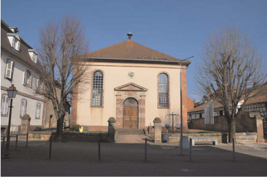
Abb. 14: Das Musée Judéo-Alsacien de Bouxwiller in der ehemaligen Synagoge der Stadt.

Auch wenn das Projekt mit der Leitung der französischen Museen abgestimmt ist, erhält das Jüdisch-Elsässische Museum in Bouxwiller kaum regelmäßige Subventionen. Pro Jahr wird das Museum von der Stadt Bouxwiller lediglich mit 4.000 Euro unterstützt. Seit 2018 erhält das Museum zusätzlich von der Region eine finanzielle Unterstützung in Höhe von 10.000 Euro für die Dauer von drei Jahren. Trotz dieser Zuschüsse muss sich das Museum hauptsächlich eigenständig finanzieren. Insbesondere in den ersten Jahren war dies allerdings nur mit der großzügigen Unterstützung des A.M.J.A.B. möglich. So wurden die technische Ausstattung, der Entwurf und Druck von Flyern und Postern in den ersten zwei Jahren gänzlich vom Verein finanziert. Weitere 70.000 Francs hat der A.M.J.A.B. 2001 in das Museum investiert, wobei 40.000 Francs allein für zusätzliches Ausstellungsmaterial wie Vitrinen etc. vorgesehen waren. Eine große Baustelle des Museums ist nach wie vor die Kontrolle des Raumklimas. Zwar wurde nachträglich eine teilweise Isolierung des historischen Gebäudes vorgenommen, jedoch überstiegen die Heizkosten im Winter regelmäßig das Budget 102 , sodass das Museum seit einigen Jahren seine Türen in der kalten Jahreszeit gänzlich