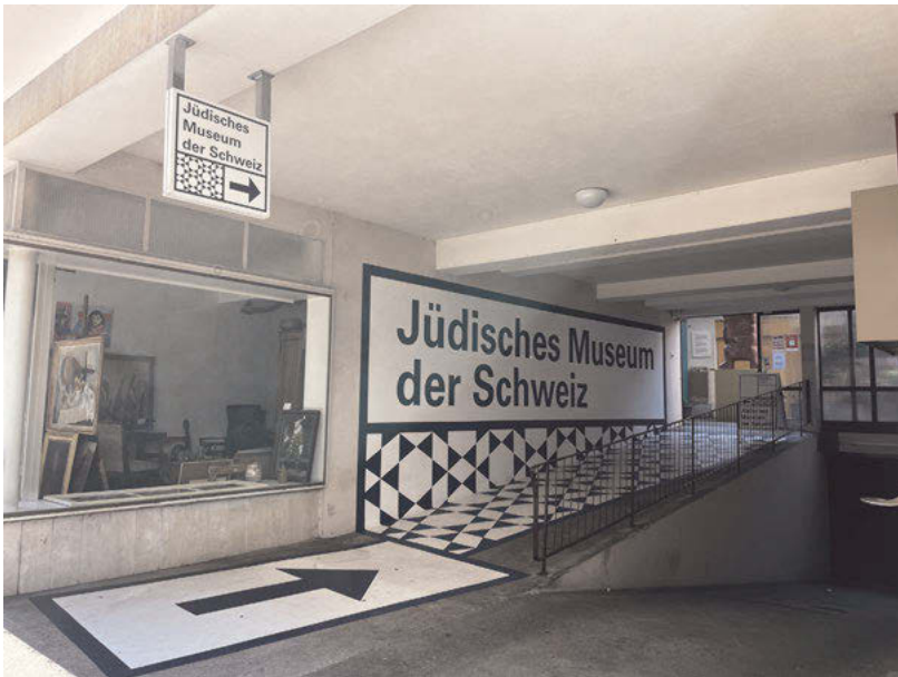
Abb. 2: Eingangsbereich des Jüdischen Museums der Schweiz Basel.