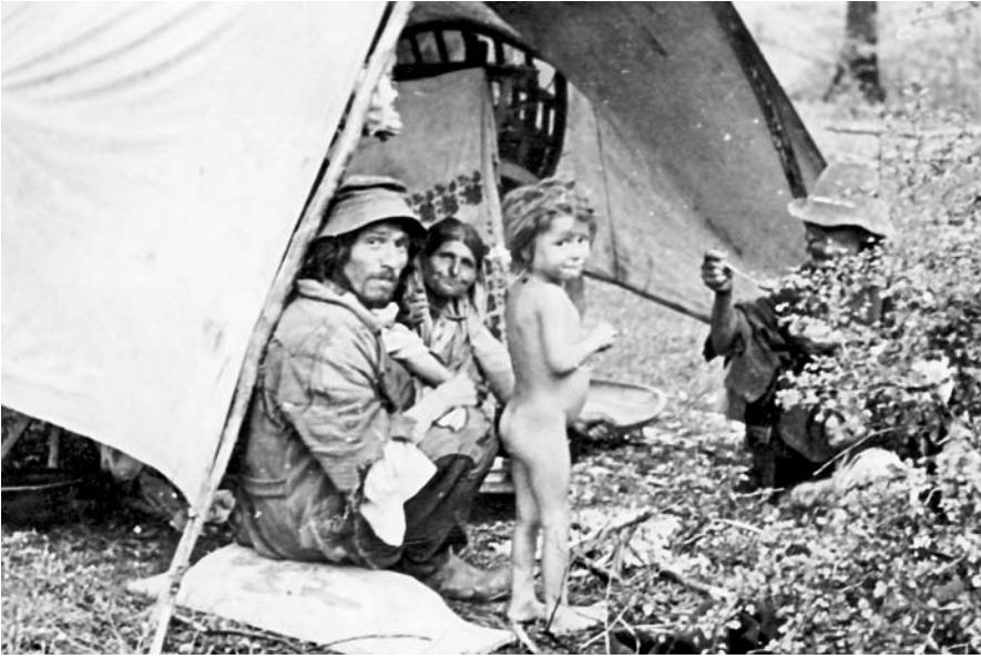
32. Accampamento di zingari vicino a Generalski Stol, maggio 1941