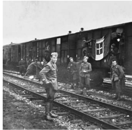
58-59. Militari italiani in attesa della tradotta che li riporterà a casa, febbraio 1943