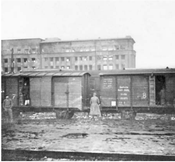
57. La stazione di Kiev danneggiata dai bombardamenti, febbraio 1943