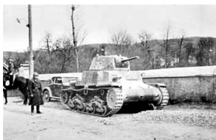
20-21. Croazia, aprile 1941, un trattore pesante tedesco e un carro armato italiano.