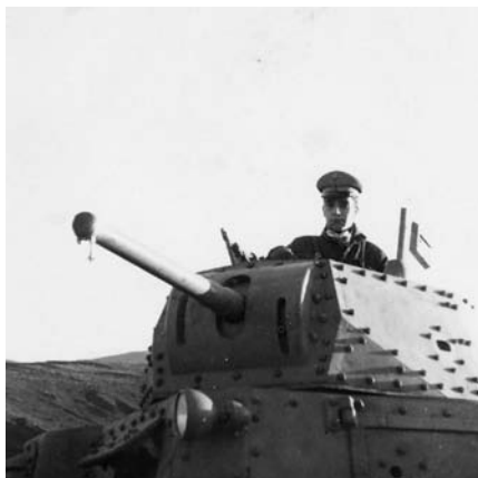
41-42. Civitavecchia, febbraio 1942, esercitazioni con i carri medi da 14 tonnellate (M 14/41)