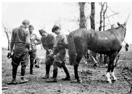
28-29. Jugoslavia, aprile 1941, problemi ai quadrupedi.