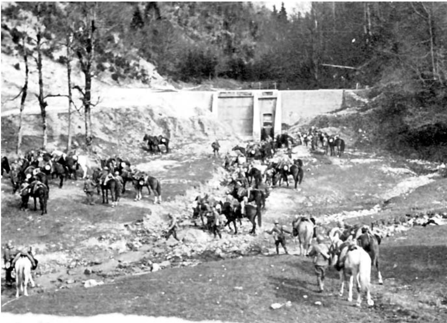
24-25. Abbeverata e momenti di sosta per cavalli e cavalieri, Jugoslavia, aprile 1941