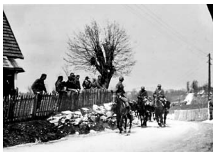
22-23. I cavalleggeri di Saluzzo durante i trasferimenti in Jugoslavia, aprile 1941.