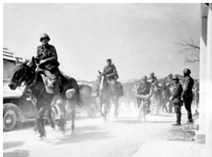
18-19. 13 aprile 1941, il reggimento Cavalleggeri di Saluzzo attraversa il confine jugoslavo al passo di Clana