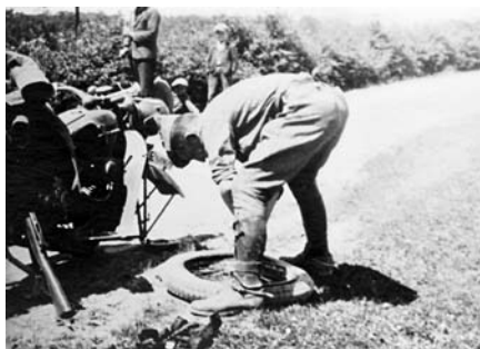
26-27. Jugoslavia, aprile 1941, problemi ai mezzi di trasporto.