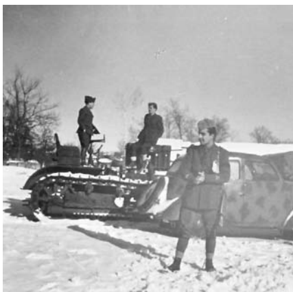
55-56. Mezzi del Regio Esercito alla periferia di Charkow, gennaio 1943