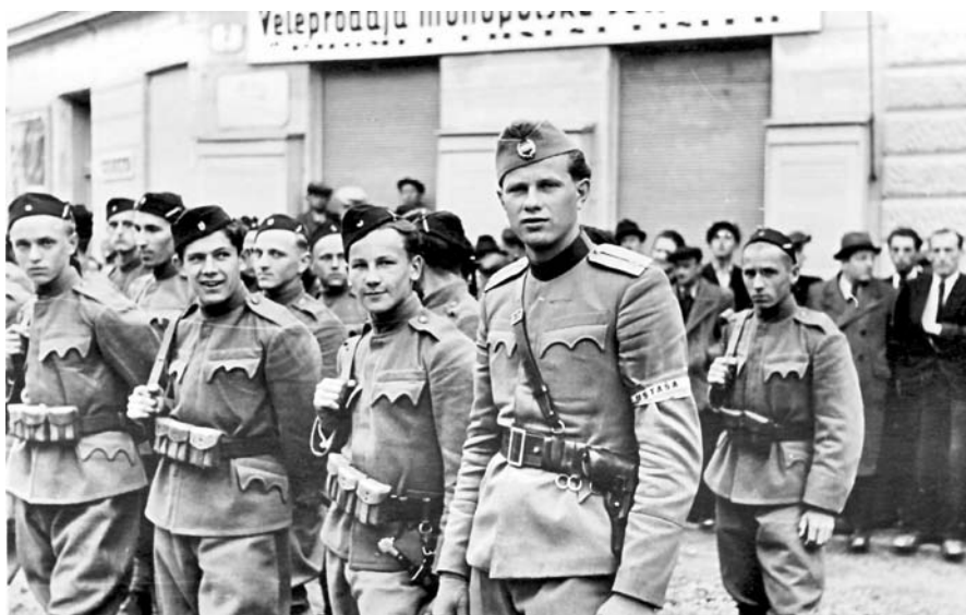
36. Ustasha a Karlovac, maggio 1941