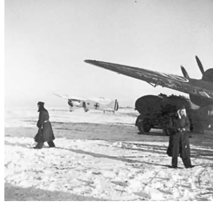
50-51. In viaggio verso la Russia, sosta di rifornimento carburante in un campo di aviazione a Zaporoje, a circa un'ora di volo da Stalino, 28 dicembre 1942