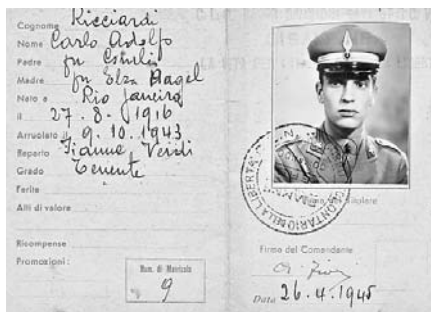
61-62. La tessera di riconoscimento delle Fiamme Verdi rilasciata al tenente Ricciardi il 26 aprile 1945 con la firma del Comandante Fiori (generale luigi Masini).