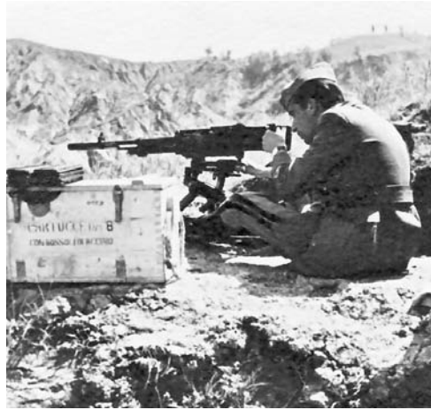
45-46. Esercitazione di tiro, Bologna, maggio 1942.