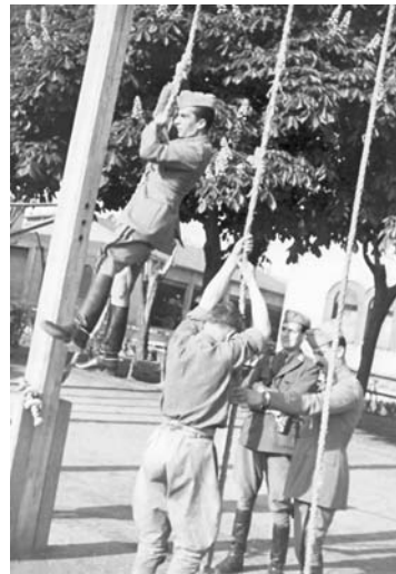
47-48. Concorso ippico e istruzione delle reclute, Bologna, maggio 1942.