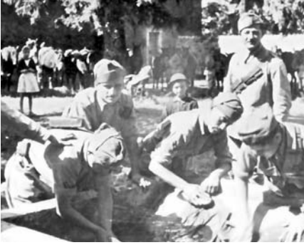
8. Castel d'Aviano, agosto 1940, i soldati del II squadrone lavano la tenuta di tela.