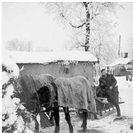
53-54. Quando le strade erano ghiacciate spesso venivano utilizzati i mezzi di trasporto tradizionali russi, Starobelsk, gennaio 1943