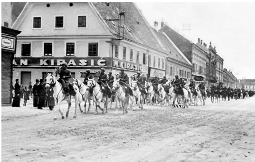
35. Il reggimento Cavalleri di Saluzzo attraversa Karlovac sulla via per Jastrebarsko, maggio 1941