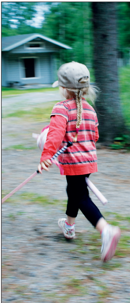
Matka Supermammojen ryhmässä voi alkaa lapsuudessa ja jatkaa aikuisena

Juuri se, että ryhmän jäsenyys kulkee sekä äidiltä äidille että sukupolvelta toiselle on yksi syy Supermammojen toiminnan pitkäikäisyyteen. Ryhmä lakkaa aikojen kuluessa ole-masta tarpeellinen jäsenilleen, mutta aina on ihmisiä, jotka sitä voisivat tarvita. Ryhmästä irtaantuneiden äitien välittämä tieto antaa heille mahdollisuuden pohtia, voisivatko he hyötyä sen toiminnasta. Ryhmän elinkaari pitenee, kun tieto sen