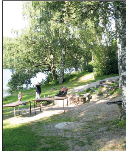
Leiriympäristö antaa mahdollisuuden oman elämän reflektointiin