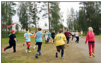
Ulkoliikunta on tärkeä osa leiriohjelmaa