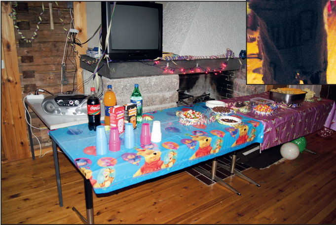
Äidit voivat hengähtää samalla, kun lapset osallistuvat heille mieluisaan ohjelmaan