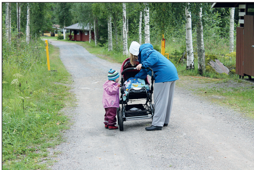
Lastenohjaajat kohtaavat työssään eri ikäisiä lapsia

Lastenohjaajana työskentelemiselle ei ole koulutusvaatimuksia. Osa heistä on suorittanut sosiaali- ja terveysalan opintoja, kun taas osan koulutustaustana on jonkin muun alan ammatillinen perustutkinto, ylioppilastutkinto tai peruskoulu. Kuitenkin lastenohjaajien työ on haastavaa. Se edellyttää ohjaustaitojen lisäksi äitien ja ennen kaikkea lasten tarpeille, toiveille ja odotuksille herkistymistä. Lasten ohjaaminen muuttuvissa olosuhteissa ja erilaisten tarpeiden, toiveiden ja odotusten ristipaineessa on vaativa tehtävä. Työ ei vaadi koulutusta, mutta sitä ei voi toteuttaa onnistuneesti ilman taitoja, voimavaroja ja sitoutumista.