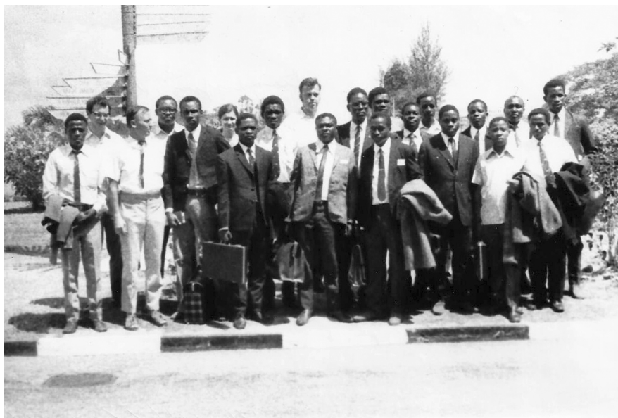
Abbildung 4.1: Tansanier auf dem Weg zur Berufsausbildung in der DDR werden auf dem Flughafen Dar es Salaam von DDR-Botschaftspersonal verabschiedet, Fotografie, 11. 1. 1974.

großen Bedeutung des Staates und dem hohen Prestige des Beamtentums wenig erstaunlich – der Dienst für die eigene Regierung das höchste Ziel. 90 Der Wunsch, die Karriereleiter zu erklimmen, wurde auch verknüpft mit Entwicklungszielen und Visionen einer wissenschaftlich verbesserten Moderne, wie am Beispiel eines selbst verfassten Lebenslaufs aus dem Jahr 1968 deutlich wird: