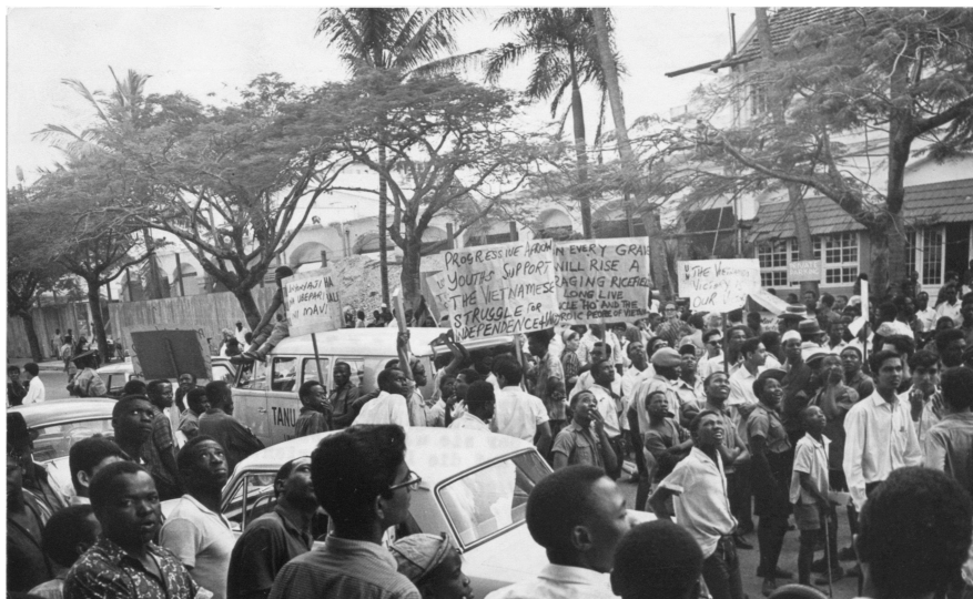
Abbildung 2.1: Proteste im Sinne des antiimperialistischen Entwicklungsstaates: Studierende und Jugendliche protestieren vor der US-Botschaft gegen den Vietnam-Krieg und Kapitalismus. Fotografie, Dar es Salaam, 31.7.1968

fenbarte sich in Demonstrationen gegen die USA und den Vietnamkrieg (Abbildung 2.1) ebenso wie in Protesten gegen den Einmarsch der Sowjetunion in die ČSSR. Die Partei versuchte, den Aktivismus der Jugend zu kanalisieren. Viele Proteste wurden von der TANU oder der Jugendorganisation initiiert oder unterstützt (siehe das Fahrzeug mit der Aufschrift „TANU“ in der Abbildung) und von entsprechenden Stellungnahmen in den Medien flankiert. 50 Regierung und Massenorganisationen zielten darauf ab, das politische Potenzial der Jugend zu monopolisieren. Die jugendliche Avantgarde sollte ihre Energie in Übereinstimmung mit nationalstaatlichen Interessen einsetzen. Erscheinungen der „Dekadenz“, des eigennützigen Materialismus und Karrierismus galten der Führungsschicht als moralische und nationsgefährdende Übel; ebenso die radikalen linken Strömungen an der Universität, die wiederholt die Legitimität der Elite infrage stellten. 51