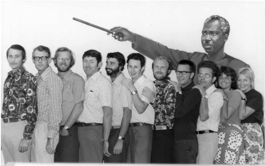
Abbildung 5.1: In Diensten zweier Sozialismen: DDR-LehrerInnen vor einem Wandgemälde des tansanischen Präsidenten Julius Nyerere. Das Bild wurde anlässlich eines Lehrerseminars mit tansanischen KollegInnen im August 1975 in Dar es Salaam aufgenommen.

rückzuweisen. Die Botschaft, die die jeweils geltende Doxa aus Ostberlin weiterleitete, kam mit der Unterweisung der Auslandskader nicht mehr nach. 395