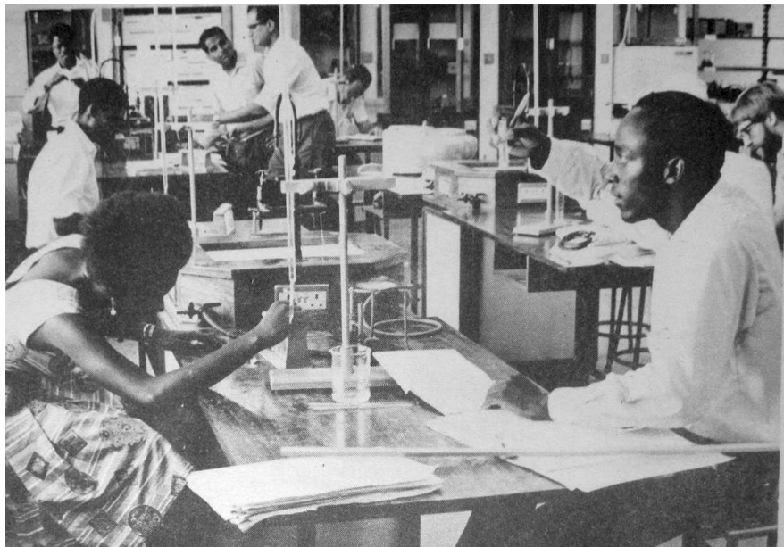
Abbildung 7.1: Chemiepraktikum für SekundarschullehrerInnen

offensichtlich nahelegt, dass hier expatriates den tansanischen Prinzipien und Strategien Folge leisten. Auch Bildunterschriften anderer Fotografien in den Universitätsberichten gehen nicht darauf ein, dass Lehrkräfte mit nicht-tansanischer oder zumindest nicht-afrikanischer Herkunft abgebildet sind. Derartige Bilder spiegeln in erster Linie die Perspektive der nationalen Elite: Expatriates hatten Erfüllungsgehilfinnen für das self-reliance -Vorhaben zu sein, die Studierenden sollten diszipliniert lernen und sich ebenso wie das Lehrpersonal in den Dienst des Staates und der nationalen Entwicklungsaspirationen stellen.