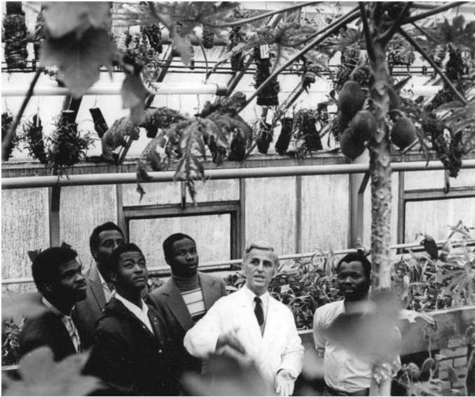
Abbildung 4.3: Darstellung des einseitigen Wissenstransfers im Botanischen Garten in Leipzig, 22.9.1973. Unter den fünf afrikanischen Studenten befindet sich ein Tansanier.

freiwilligen Teilnahme angehalten – wenn auch mit wenig Erfolg. 123 In der Fachrichtung Tropische Landwirtschaft – eine der wenigen Studienrichtungen in der DDR mit überwiegend ausländischen StudentInnen – waren Prüfungen nicht nur in Genetik , Mathematischer Statistik und Bodenerhaltung abzulegen, sondern auch in den Fächern Agrarökonomie der DDR , Philosophische Grundfragen unserer Zeit , und Grundfragen der revolutionären Hauptströme unserer Zeit . 124 Die Letzteren waren stark durch marxistisch-leninistische Theorien geprägt. In Interviews wurde der verpflichtende Charakter derartiger Lehrveranstaltungen betont: „Man musste es machen“, „sonst hätte man exmatrikuliert werden können“, waren einige der verwendeten Formulierungen. 125 Zwei Interviewpartner erzählten, dass