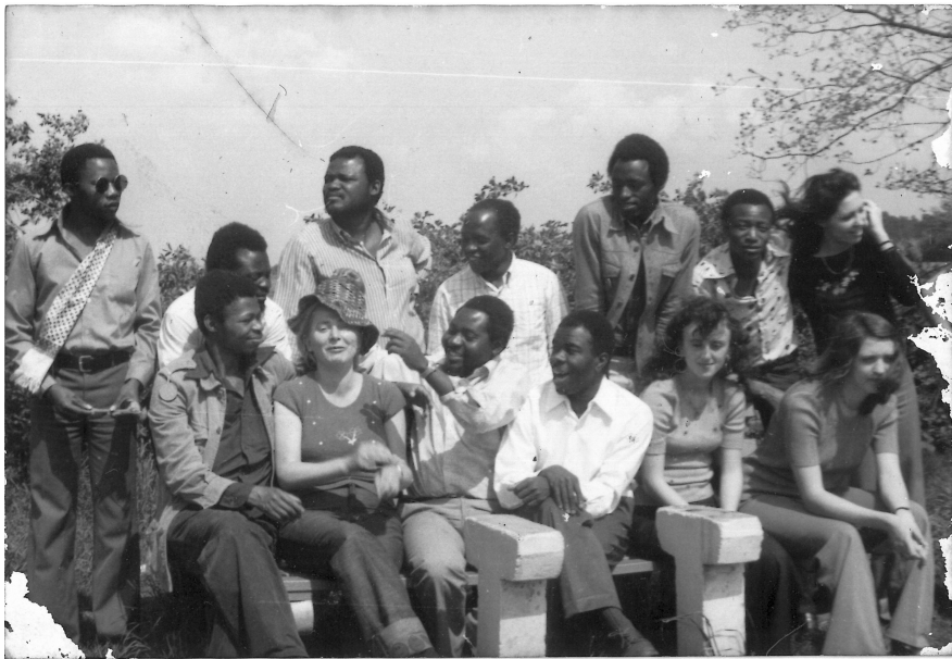
Abbildung 4.2: Fotografie von Mitgliedern der Musikgruppe „Ensemble Solidarität“ der Karl-Marx-Universität aus Tansania, Südafrika, der DDR und Griechenland

(wenngleich nicht der Überzeugungen). Ähnliches in Bezug auf die zeitweilige Stilllegung religiöser Praktiken berichteten muslimische InterviewpartnerInnen. 100 Im Fall von zwei ehemaligen Doktoranden in der BRD wurden Doktorvater bzw. Doktormutter als enorme Stützen gelobt, die die gerade frisch eingetroffenen Studierenden oft zu sich nach Hause einluden oder sogar anfangs bei sich wohnen ließen, Flüge zur Familie nach Tansania bezahlten und insgesamt eine Zuneigung ( upendo ) zeigten, als wären sie Verwandte. Hier handelte es sich um Lehrende, die zuvor bereits in Tansania gelebt und an der Universität Dar es Salaam unterrichtet hatten und ihre Betreuungsfunktion offensichtlich bis tief die private Sphäre ausweiteten, was als großer Unterschied zum distanzierten Betreuungsverhältnis in Tansania erfahren wurde. 101