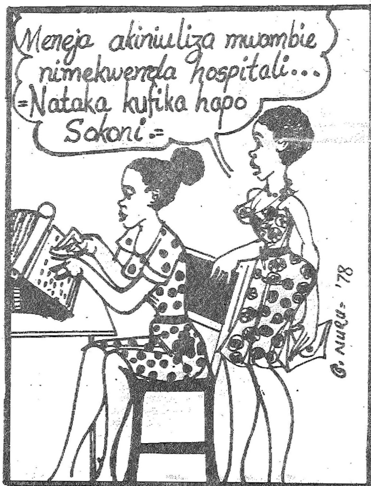
Abbildung 2.2: Karikatur zum Thema Arbeitsdisziplin aus dem Organ der Einheitsgewerkschaft JUWATA. Der Sprechblasentext: „Wenn der Chef (/die Chefin) nach mir fragt, sag ihm (/ihr) ich bin ins Krankenhaus gegangen... Ich will zum Markt.“ (Quelle: Mfanyakazi 686, 5. 8. 1978, S. 8)

wurde in Karikaturen unmoralisches Verhalten unterstellt (Abbildung 2.2). 66 Auch die Frauenorganisation der Partei, die UWT, trat mit Disziplinierungsrhetorik in