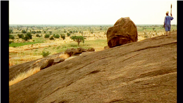
Abbildung 19: Da ist immer schon jemand anderes, der ebenfalls auf die Landschaft schaut.

(Quelle: Chocolat , Regie: Claire Denis, Frankreich 1988. DVD Artificial Eye)