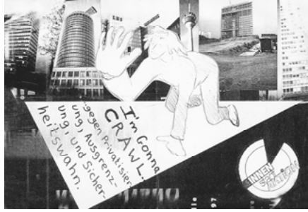
Abb. 13: Flyer zu John Dunns „Krabbelaaktion“ (InnenStadtAktionen 1997 in Düsseldorf)

Wenngleich die Aktion kein pädagogisches Konzept verfolgt, sondern eher auf die Eigendynamik des Zusammenarbeitens setzt, kann beispielsweise das gemeinsame Zeichnen als eine Form des Empowerments gelesen werden, wie Nina Felshin skizziert: