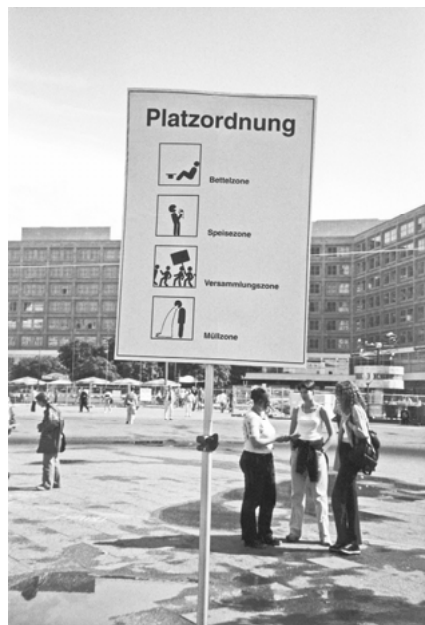
Abb. 11: „Entern öffentlicher Plätze“ (InnenStadtAktionen 1998 in Berlin)

Ähnlich wie in Köln werden auch in Berlin vielfach Orte durch temporäre Besetzungen für andere als die üblicherweise vorgesehenen Nutzungen geöffnet: Beispielsweise durch Picknicks im Bahnhof Zoo (5.6.1998) 232 oder auf dem privatisierten Los Angeles Platz (4.6.1997) 233 , bei denen offensiv gegen die jeweiligen Hausordnungen verstoßen wird, durch eine spontane Lesung im Kulturkaufhaus Dussmann, bei der Texte des Innenministers Manfred Kanther und des Berliner Senatsabgeordneten Klaus Rüdiger Landowsky vorgetragen werden 234 , oder durch das „Entern öffentlicher Plätze“ (3.6.1998), bei dem PassantInnen auf dem Alexanderplatz dazu aufgefordert werden sich mit Hilfe eines Stücks Kreide eine beliebig großes Areal anzueignen und dort eine eigene Platzordnung zu erlassen 235 . AktivistInnen verkleiden sich bei dieser Aktion als PiratInnen, die auf ihrem Gebiet den Genuss von Alkohol, das Abspielen von Musik, das Rauchen von Haschisch oder Skateboardfahren, also Verhaltens-