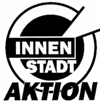
Abb. 3: gemeinsames Logo der überregionalen InnenStadtAktionen

Nachdem auf diesem Koordinierungstreffen im Januar 1997 gemeinsam einige Grundsatzfragen erörtert wurden, wird die Planung der InnenStadtAktionen dezentralisiert, d.h. die weitere Vorbereitung der InnenStadtAktionen wird von den beteiligten lokalen Vorbereitungsgruppen übernommen und die jeweiligen Diskussionsergebnisse über einen E-Mail-Verteiler anderen Gruppen zugänglich gemacht. Als gemeinsame Klammer wird im Protokoll des Koordinierungstreffens festgehalten, mit einem einheitlichen Logo zu arbeiten, um Wiedererkennbarkeit zu erzielen, in Publikationen möglichst alle beteiligten Städte zu nennen und eine gemeinsame Zeitungsbeilage für überregionale Zeitschriften und Zeitungen herauszugeben, in der zum einen theoretische Beiträge aus dem Vorbereitungstref-