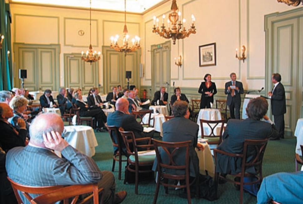
Debatbijeenkoms Hollands Spoor.

worden gebracht. De raad kan vaak vanuit zijn onafhankelijke positie en multidisciplinair karakter een nieuwe en verfrissende kijk op beleidsthema's geven.