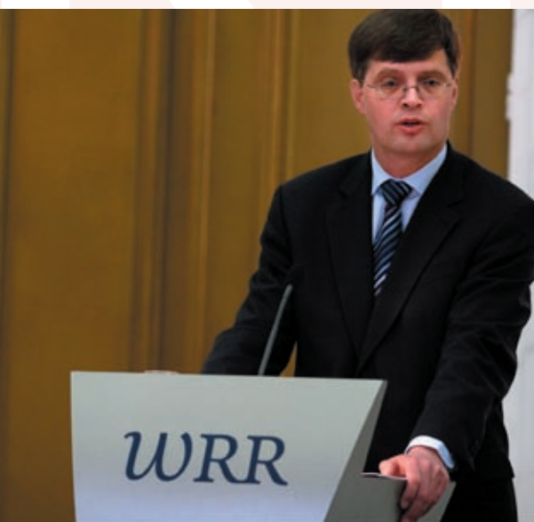
Minister-President Balkenende spreekt op symposium van de WRR.

De verkenning De staat van de democratie. Democratie voorbij de staat (2004) en Nederland en de Europese Grondwet (2003) zijn voorbeelden van een zelfstandige publicatie over een actueel onderwerp waarin bijdragen van binnen en van buiten de WRR gebundeld zijn. Ook de verkenning Vijfentwintig jaar later. De toekomstverkenning van de WRR uit 1977 als leerproces , is een voorbeeld van een gecombineerd werk.