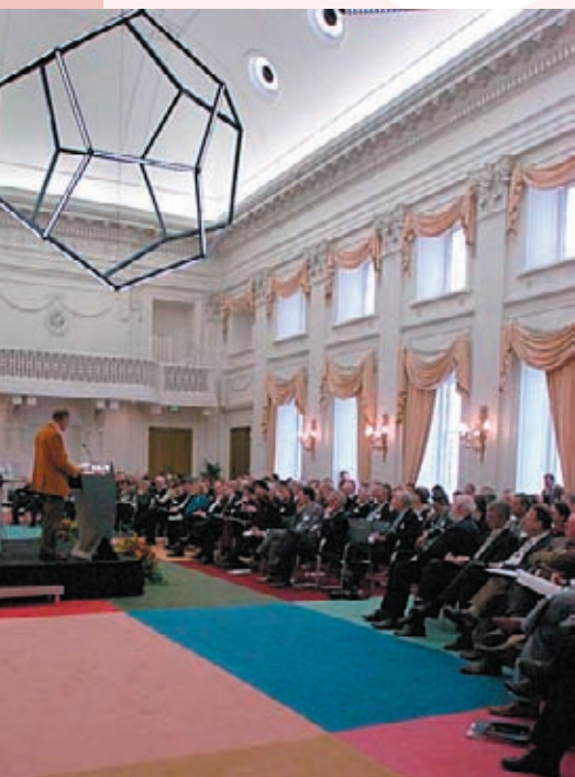
Symposium in de Oude Vergaderzaal van de Tweede Kamer.

Er zijn in de huidige maatschappij veel actuele problemen die een lange termijn effect hebben. Te denken valt aan problemen op het gebied van de economische structuur van Nederland, de gezondheidszorg en de bestuurlijke aspecten van de veiligheidsvraag van de burgers. Gebruikelijk is dat bij een nieuw onderwerp voor de raad, wordt gekozen voor een periode van diepgaand onderzoek voorafgaand aan het uitbrengen van een rapport. Als het onderwerp er zich toe leent, kan de raad indien de actualiteit daarom vraagt, op basis van aanwezige kennis en eerdere studies al relatief snel een advies uitbrengen. Ook komt het voor dat goed af te bakenen onderdelen van een grotere en meeromvattende studie eerder als een afzonderlijk advies naar buiten