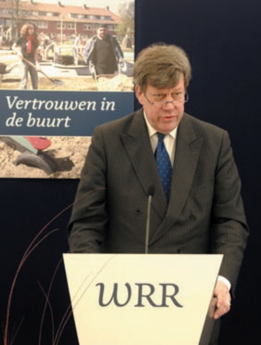
Burgemeester van Rotterdam, Ivo Opstelten, bij de presentatie van het rapport Vertrouwen in de buurt

rondom een onderwerp of thema wordt samengesteld. Geschreven concepten worden uitgebreid bediscussieerd, zowel in de projectgroep, in de staf als in de raad. De raad komt elke veertien dagen bijeen en bespreekt dan niet alleen de voortgang, maar vooral de inhoudelijke kant van de projecten. Op deze manier worden de onderwerpen vanuit verschillende disciplines