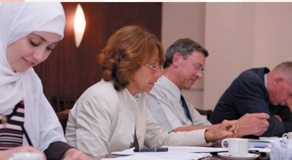
De raad aan het werk.