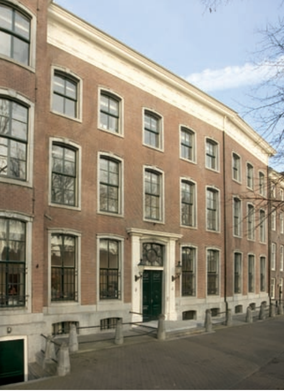
Het pand van de WRR aan de Lange Vijverberg.

Kenmerkend voor het werk van de raad is dat de vraagstukken vrijwel altijd meer beleidsterreinen omvatten (multisectoraal) en vanuit verschillende disciplines bekeken worden (multidisciplinair). Daarbij is de raad onafhankelijk. De WRR opereert los van politieke wensen en beleidslijnen en van wat de publieke opinie op een bepaald moment meent.