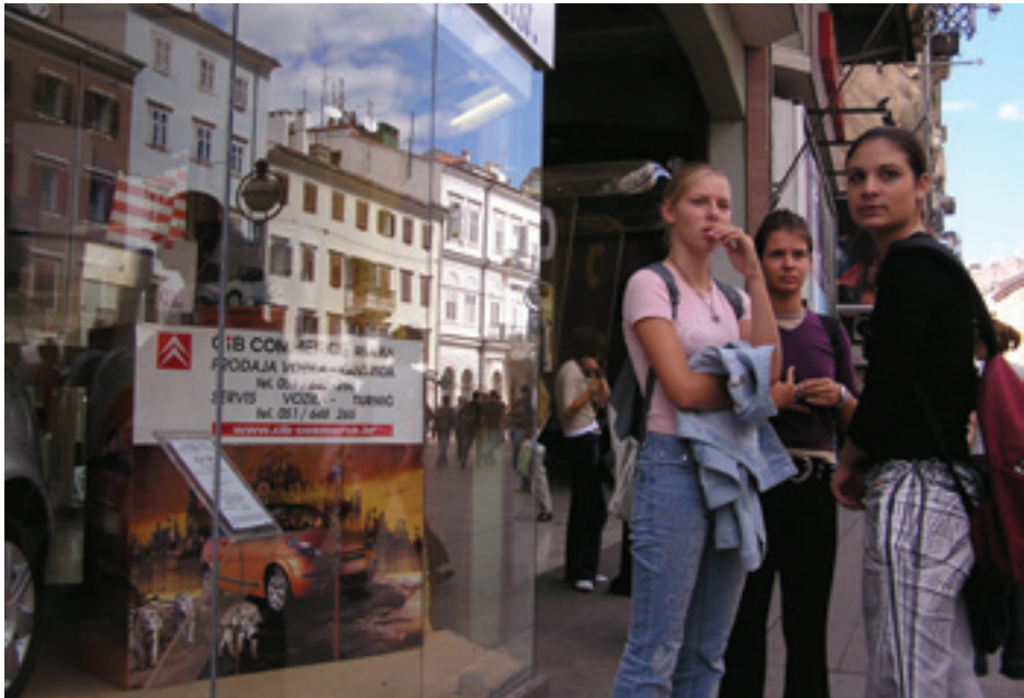
Fig. 8. Korzo, 2006

The popular cafés are, in fact, predominantly located in the central city area, and quite a number of them exist amid the colors and the sounds of numerous shops and stores located in the central pedestrian zone, in the street named Korzo. Korzo is the best attended part of the town, especially during the day. Even though he viewed it from the crowd, Dokmanović captured the atmosphere through details, as in the picture he took of a group of young people standing in front of a department store, bearing the name of the street: Korzo. The reflections in the shop windows reveal the crowded atmosphere surrounding the group: