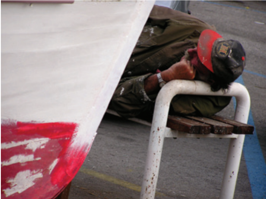
Fig. 4. A sleeper at Delta, 2006

details on the present-day Delta location, one of the more disturbing ones depicting a homeless person, or perhaps a poor worker, asleep on a bench. The picture was taken in the immediate vicinity of the Dead Channel, not far from the parking lot. The channel is used as anchorage for boats, some of them pulled ashore for reparation: