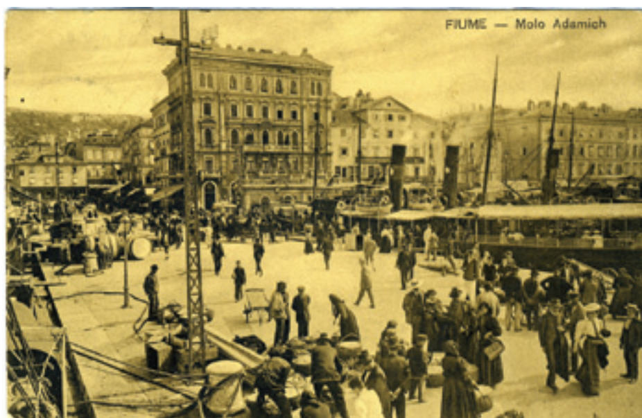
Fig. 2. Molo Adamich, 1910

Franks. There is little record of the place between the 9th and the 13th century, when it reappeared in records under the name Reka (Rika) Sv. Vida (lat. Flumen Sancti Viti, i.e. The River of St. Vitus). The toponym bears the name of Rijeka's patron saint, while the first part of the ancient syntagm, which has survived into the present (Rijeka), can be said to be an etymological testimony of the city's original position by the delta estuary of the Rječina River, at a point of contact with the Adriatic Sea. That precise point of contact with the sea was lost to the citizens after the construction of the new port in the 19th century. The port at the estuary of the Rječina River functioned well until the arrival of iron steam ships which began to replace much lighter sail-ships. The construction of the new port began at that time and the project was finalized by the beginning of the 20th century. By 1910, the new location was fully functional. The photograph showing a passenger dock of the new port reveals intense activity and movement: