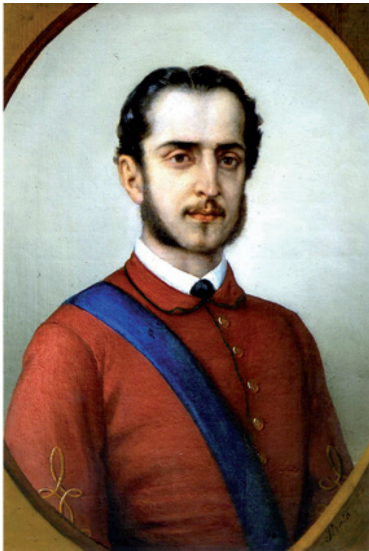
Fig. 1 Eugenio Popovich as a Garibaldist, Civici musei di Trieste (CMSA inv. No. 13/3910)