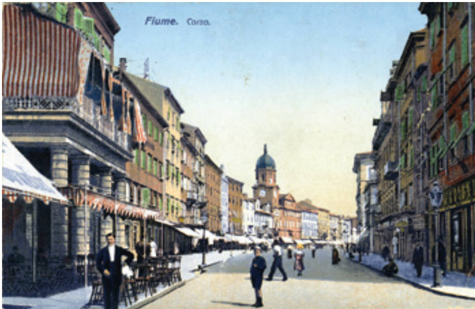
Fig. 9. Korzo, 1911

On the historical photograph of the same location taken in 1911, Korzo appears to have been quite different. In fact, only two figures on that picture are static: that of a waiter awaiting guests, standing in front of an empty cafe, and that of a young man in the sailor's uniform, apparently a foreigner to the city. All other figures seem to be moving through Korzo, as if on their way to reach some other destination. The street is not empty, but neither overly crowded: