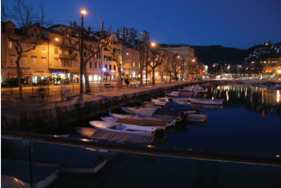
Fig. 5. Fiumara at night, 2006

One might wonder, observing Dokmanović's contemporary photographs, if the present-day city of Rijeka has any access to the sea left at all, and if the citizens have any contact with it whatsoever. On the other hand, the corpus of historical photographs clearly points to the interconnectedness of Rijeka's population with their part of the Adriatic. That connection keeps reappearing in various forms throughout the historical corpus, evidencing that the sea was, at the beginning of the 20th century, indeed the city's way of life. The next two photographs are a good example of this, as they provide insight into the ways in which the citizens of Rijeka once spent their free time.