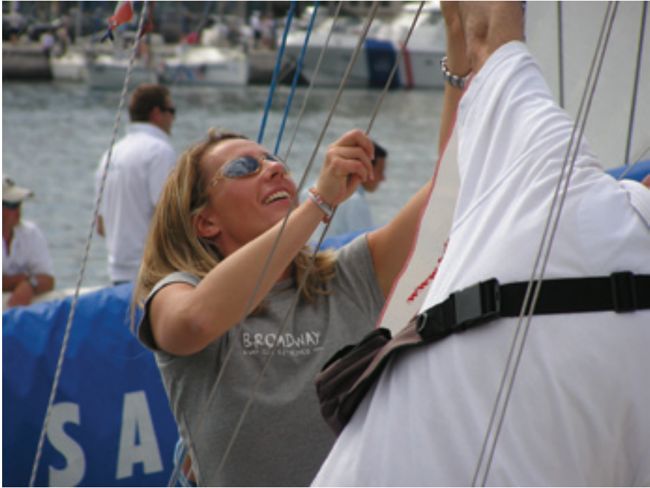
Fig. 11. The Regata, 2006