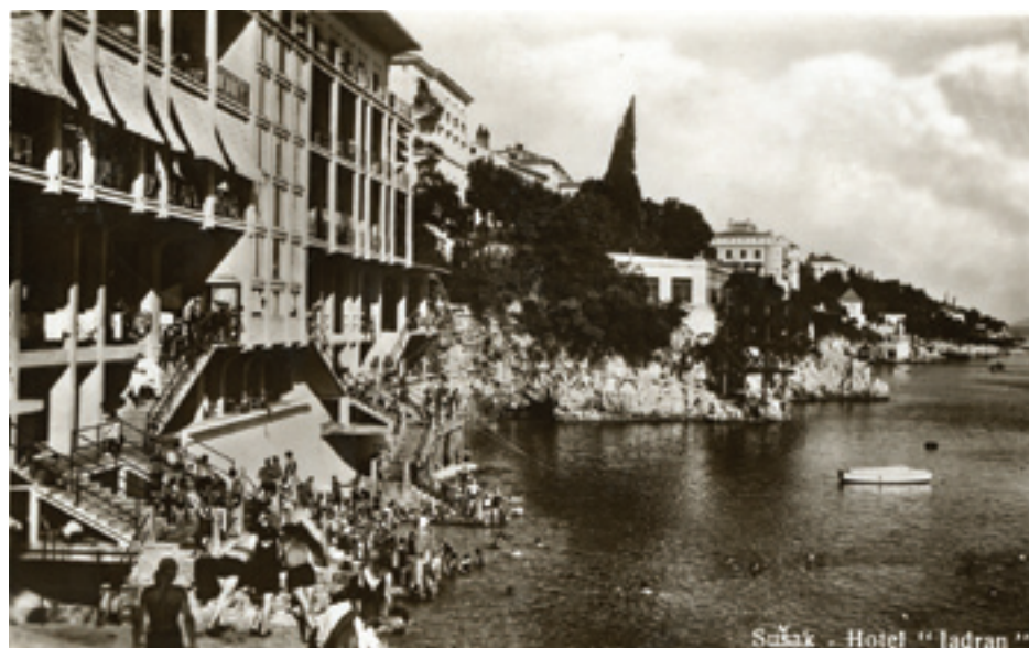
Fig. 7. Sušak, Hotel Jadran, 1935

The second photograph, taken in 1935, deepens the same impression. It shows a crowd of people on the beach in front of the Hotel Jadran, on the eastern side of the coast (Pećine, Sušak):