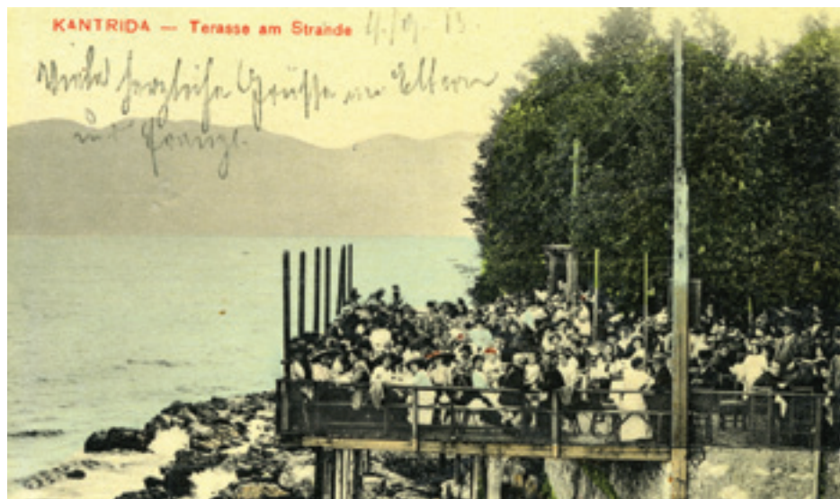
Fig. 6. Kantrida, 1913

The second photograph, taken in 1935, deepens the same impression. It shows a crowd of people on the beach in front of the Hotel Jadran, on the eastern side of the coast (Pećine, Sušak):