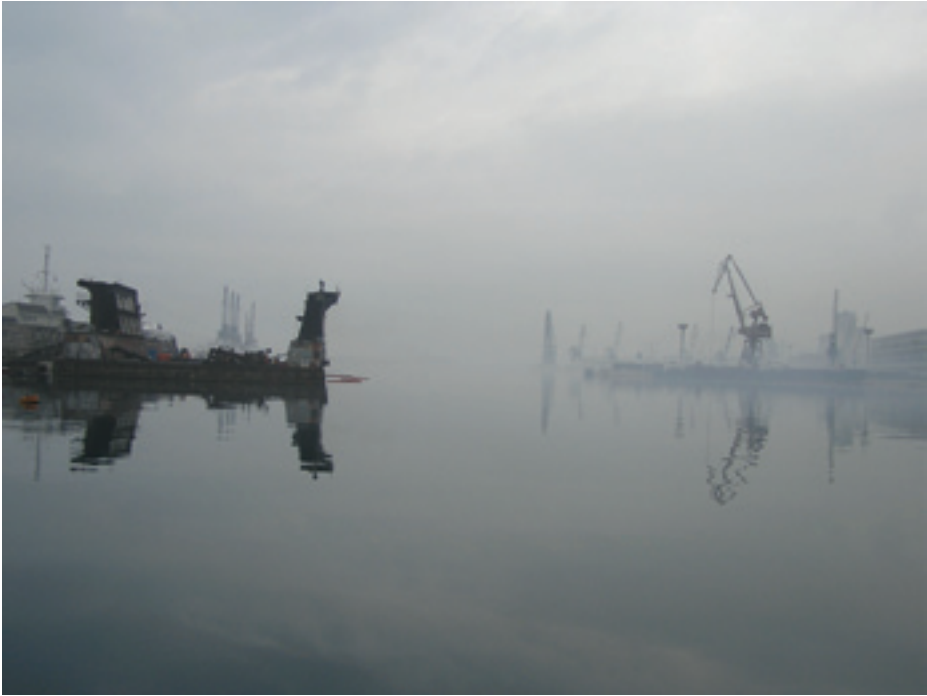
Fig. 3. The view of the port, 2006

The parking area spreading along the docks, but also the steady decline of the Croatian maritime industry after 1991, contributed to the construction of an invisible barrier between Rijeka and its waterfront, that barrier emerging as a virtual presence from Ranko Dokmanović's photographic interpretation of Rijeka. Other historical changes contributed to that barrier as well, one of them being the blockage of the Rječina estuary. The river was redirected to the east, and the so called Dead Channel was constructed in its original position. Between that channel and the redirected course of the Rječina River a peninsula was formed which was turned into an urbanized city zone. Nowadays, this area is filled with streets, historical buildings, the marketplace, and, to the east, yet another big parking zone. The coastal edge of the peninsula is blocked by fences and warehouses. The eastern end, with the parking lot on it, extends itself into the industrial and warehouse zone. The result of all this is that Delta is not, and has not been for a long period of time, the point where Rijeka meets the sea , as one of the slogans nostalgically referred to it. That particular slogan was used to promote a futuristic project to revive the area, but that project, still advertised on web pages, never came to life. Instead of the wished-for meeting with the sea, Dokmanović's camera captured gloomy