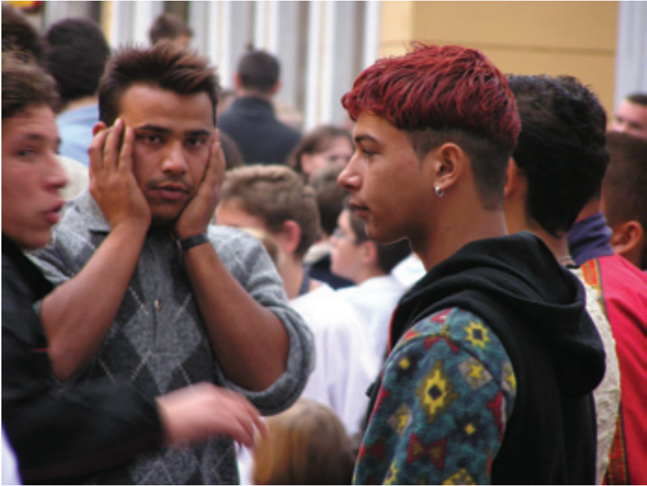
Fig. 10. Diversity, 2006

The visually transmitted impression on Rijeka's present-day cultural uniformity can be verified by numerical data: according to the 2001 population census, 80.39% of Rijeka's citizens are Croats, 6.21% are Serbs, 1.37% are Moslem's, 1.92% Italians, 1.09% are Slovenes, while all others jointly amount to 9,02% of the urban body. Rijeka's multinational character is, obviously, a fact referring to the past: in 1910 Croats made up 31.71% of the city's population, Slovenes – 7.94%, Germans – 4.99 %, Hungarians – 7.29%, Italians – 46.94% and the rest were English, French, Romanian, Checho-Slovak, Polish and Serbian (Barbalić 1910). The repeated reference of the examinees to historical notions, untraceable or poorly traceable in the present times, points to a misbalance between the two poles of human perception: the body motioned, direct perception and the mind-motioned, historicized perception. In other words, there seems to be a collision between the visually documented evidence on the city's present-day state and the historically transmitted knowledge about what the city ones was. The persistent reference to the sea and to the sea-related meanings as source of the city's (and their own) identity implies that the citizens of Rijeka failed in becoming fully aware of the present state of the urban organism which they are immersed in, their historicized perception overriding the effects of the direct sensory input which they are actually experiencing.