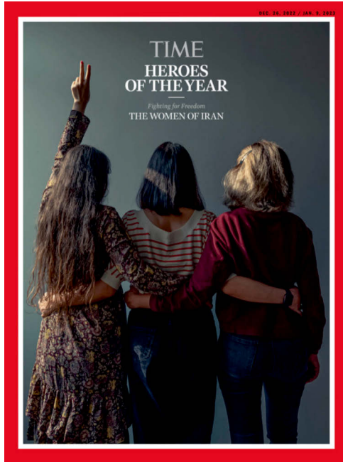
Abbildung 4: Time Magazine, Cover, Dezember 2022

Für die Dezember-Ausgabe 2022 des Time-Magazine kürte die Redaktion in New York die Frauen des Iran zu den »Heldinnen des Jahres 2022« (Abb. 4). Titel der Ausgabe ist: »Heroes of the Year. Fighting for Freedom. The Women of Iran« (Time Magazine 2022). Die Redaktion beauftragte die im Iran lebende Fotografin Forough Alaei mit der Gestaltung einer Fotostory und des damit zusammenhängenden Covers. Alaei übersetzt die auf den Sozialen Medien Twitter, Instagram, Snapchat und TikTok verbreiteten Rückenfiguren der iranischen Protestbewegung in