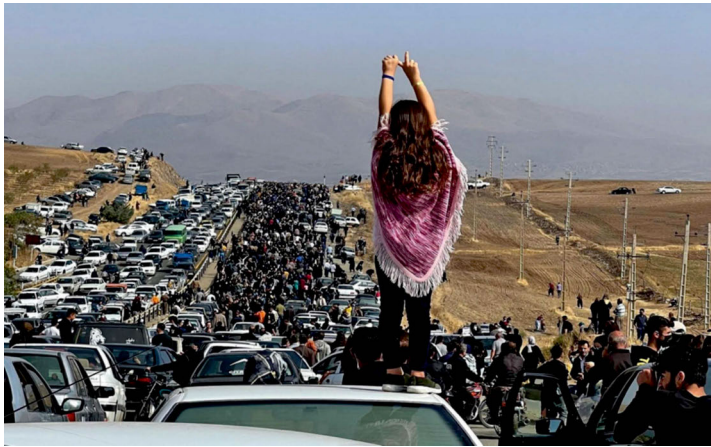
Abbildung 1: 26. Oktober 2022. Eine unverschleierte Frau steht auf einem Auto, während sich Tausende von Trauernden auf den Weg zu Mahsa Aminis Grab, das sich auf dem Aitchi-Friedhof in Aminis Heimatstadt Saghes in der westlichen Provinz Kurdistan befindet, machen.

Im Prozess der Bildbetrachtung stellen Rückenfiguren eine Herausforderung dar, denn: »The adoption of the rear-view presents an intriguing challenge, since the viewer must engage with a figure which sees without visible eyes. Considered here are some of the perceptual issues which arise from this unusual pictorial device.« (Schott 2020: 600)