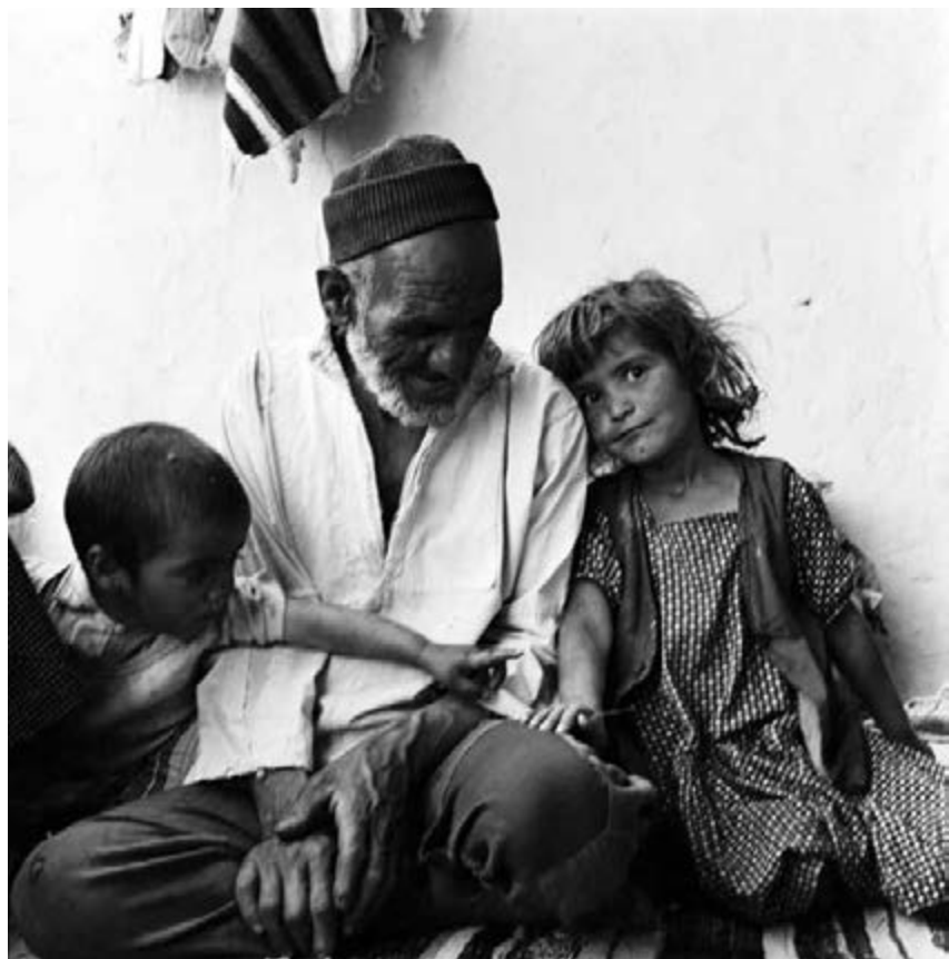
22. Bewoners in het oude Dousadj, 6 augustus 1963.