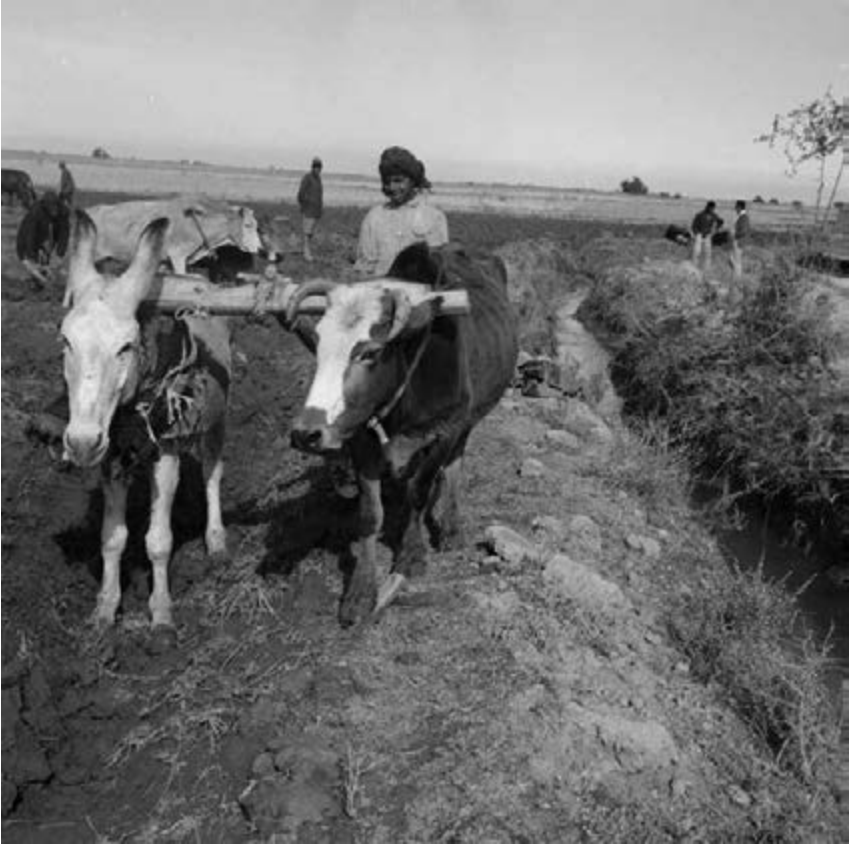
12. Landbouw in Dezful. Omstreeks 1960.