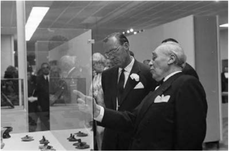
18. Prins Bernhard opent op 4 september 1962 de tentoonstelling 7000 jaar Perzische kunst in het Haags Gemeentemuseum. Met de ambassadeur van Iran Fereydun Adamiyat.