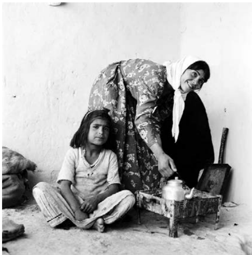
21. Bewoners in het oude Dousadj, 6 augustus 1963.