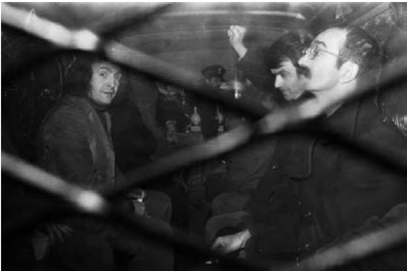
37. De bezetters van de Iraanse ambassade in een overvalwagen, vlak voor hun berechting op 12 maart 1974.