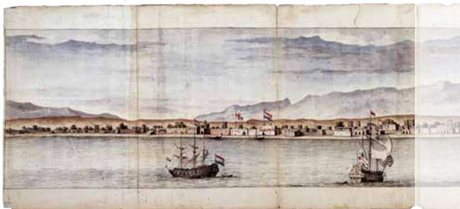
3. Cornelis de Bruijn, 1704. Aanzicht op de stad Gamron uit zee (Perzië), tegenwoordig Bandar Abbas (Iran), met de loges van de Nederlandse en Engelse Oost-Indische compagnieën.