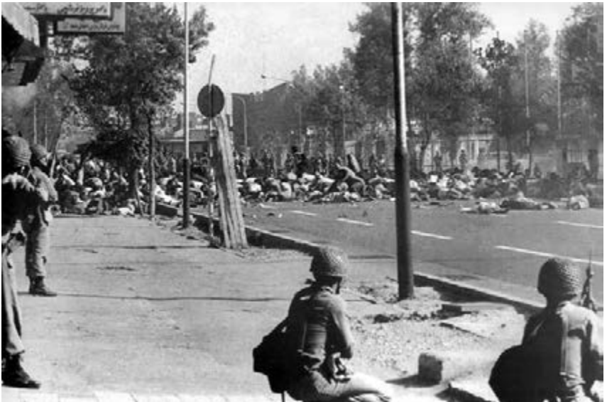
43. en 44. Demonstranten in Teheran tegen de Iraanse regering worden met machinegeweren neergeschoten (8 september 1978, Zwarte Vrijdag).