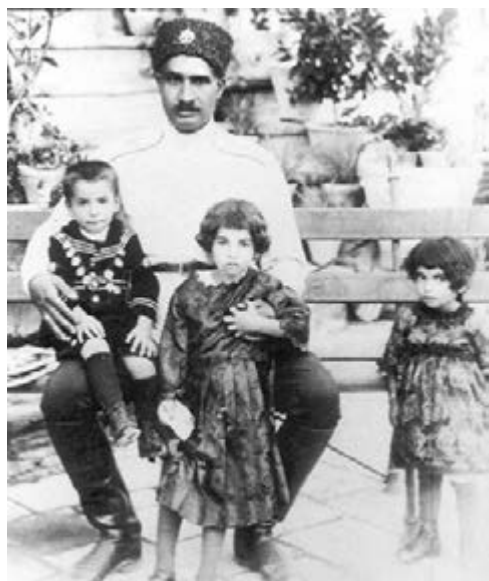
4. Reza Khan (later Pahlavi) met zijn kinderen Shams (1917–1996), Mohammad Reza (1919–1980) Ashraf Pahlavi (1919–2016). Wikimedia Commons.