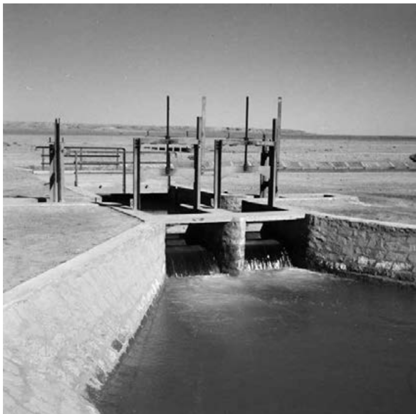
13. Dam in de Karkheerivier. Omstreeks 1960.