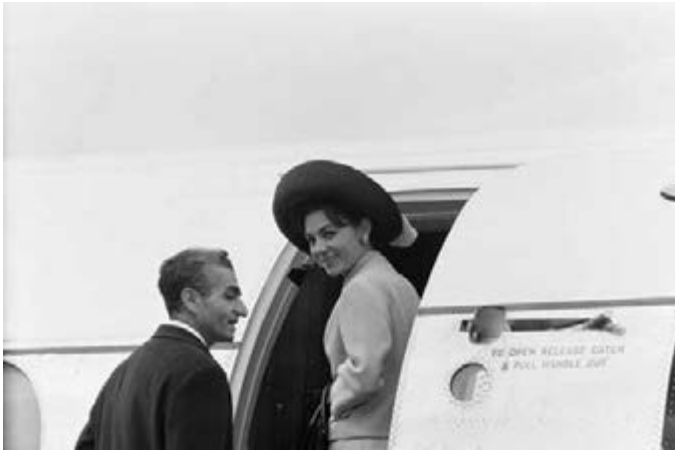
16. De sjah en Farah Diba verlaten Nederland na de viering van het 25-jarig huwelijksfeest van koningin Juliana en prins Bernhard, 3 mei 1962.