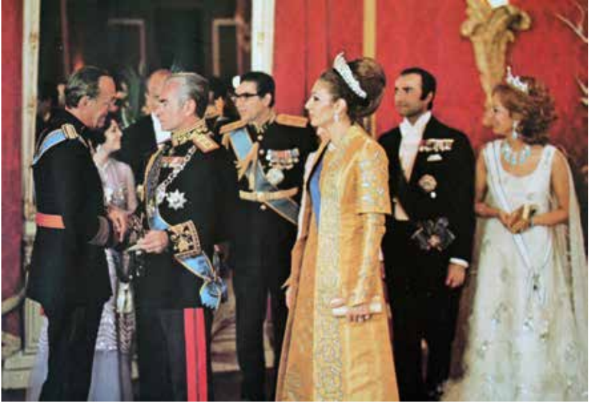
30. Prins Bernhard, de sjah en Farah Diba tijdens het gala in de grote tent te Persepolis op 15 oktober 1971.