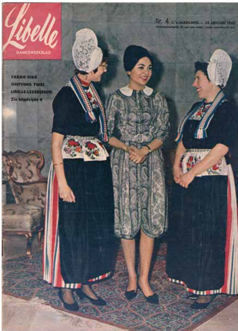
11. Lily en Leni met Farah Diba op de cover van Libelle , 27e jaargang, nr. 4, 23 januari 1960.