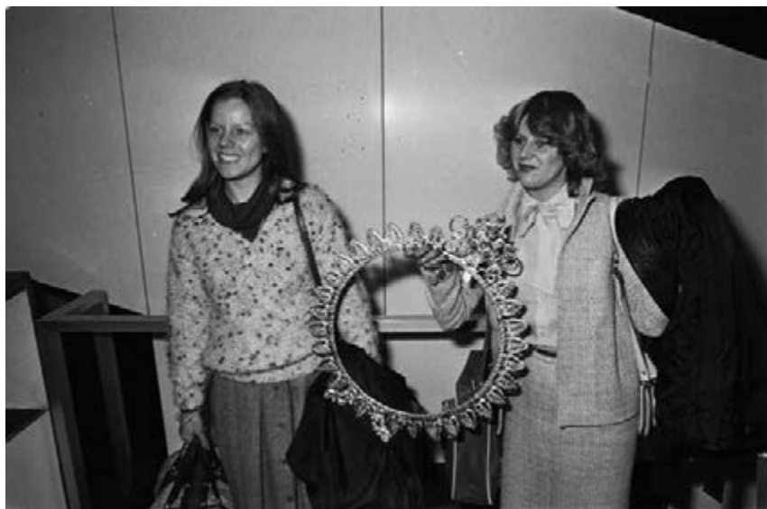
48. Op 20 februari komen de eerste Nederlanders die de omwenteling in Iran hebben meegemaakt aan op Schiphol.