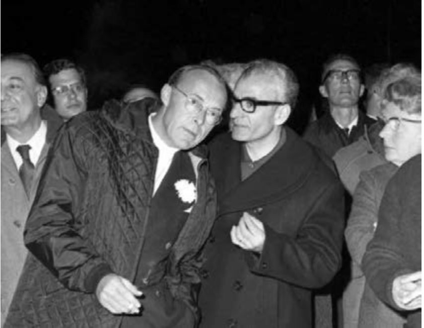
26. Prins Bernhard luister naar een opmerking van de sjaah tijdens het bekijken van een parade met tootsen door skileraren in de Oostenrijkse wintersportplaats Lech op 6 februari 1966. Rechts staat koningin Juliana.