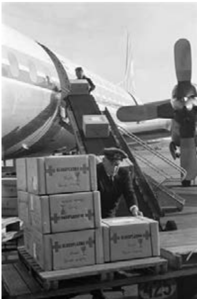
17. Na de aardbevingsramp van Boein Zahra vertrok op 4 september 1962 het eerste vliegtuig met medicamenten vanaf Schiphol.