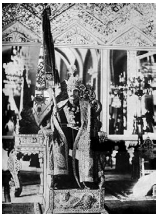
5. Reza Pahlavi bij zijn kroning op 25 april 1926 op de troon die onterecht de Pauwentroon wordt genoemd.