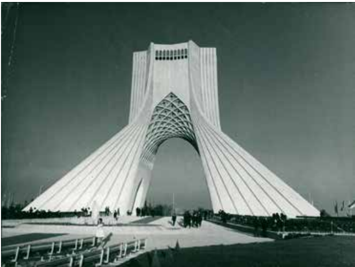
33. Sjahyadtoren omstreeks 1974.