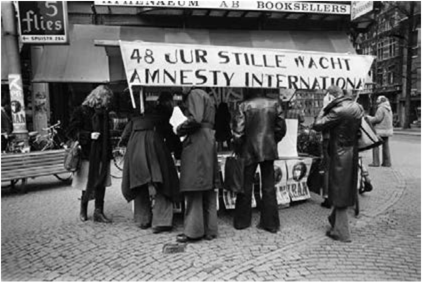
41. Amnesty International in Nederland organiseert de Week voor de onbekende politieke gevangenen in Iran (12-19 februari 1977)