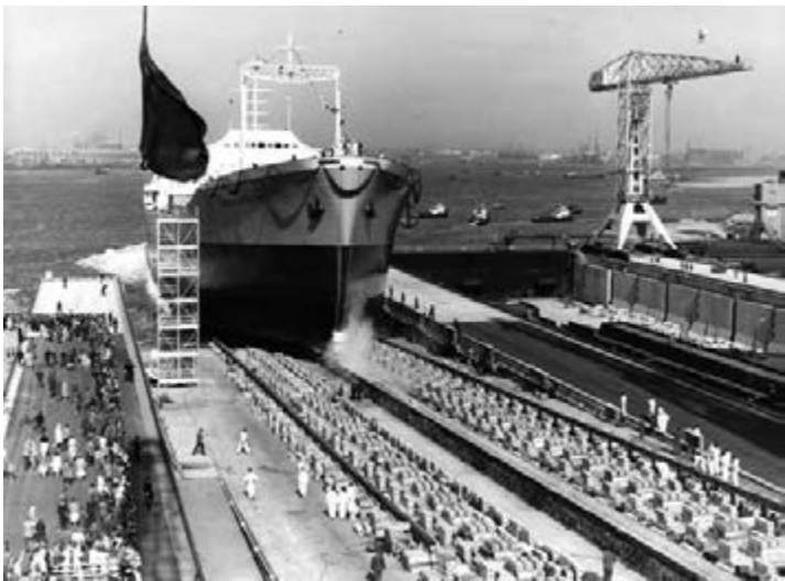
9. Tewaterlating van het schip Mohammed Reza Shah in het bijzijn van de sjah, 22 mei 1959.