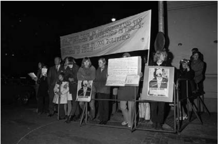
29. Gelijktijdige demonstratie buiten de Ridderzaal.