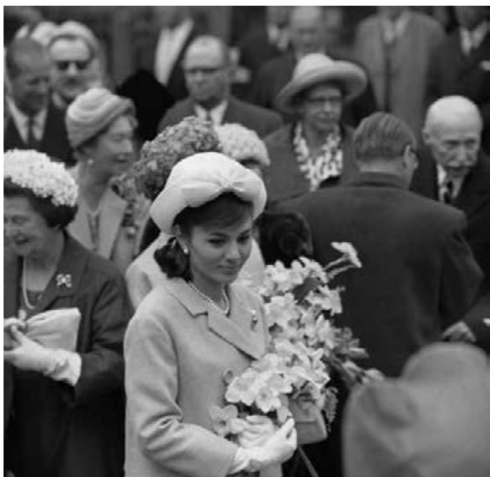
14. en 15. Het Iraanse koninklijk paar bezoekt Nederland ter gelegenheid van 25-jarig huwelijksfeest van koningin Juliana en prins Bernhard. Boven: Aankomst op Schiphol op 1 mei 1962. Onder: bezoek aan de Keukenhof op 2 mei 1962.