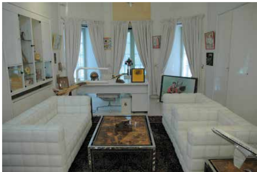
49. De verlaten kamer van Reza Pahlavi in 2008.