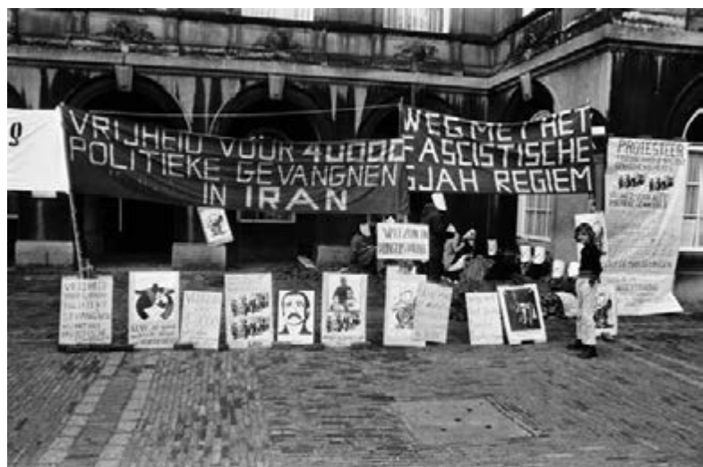
40. Demonstratie tegen de Iraanse regering op het Binnenhof, 8 mei 1975.