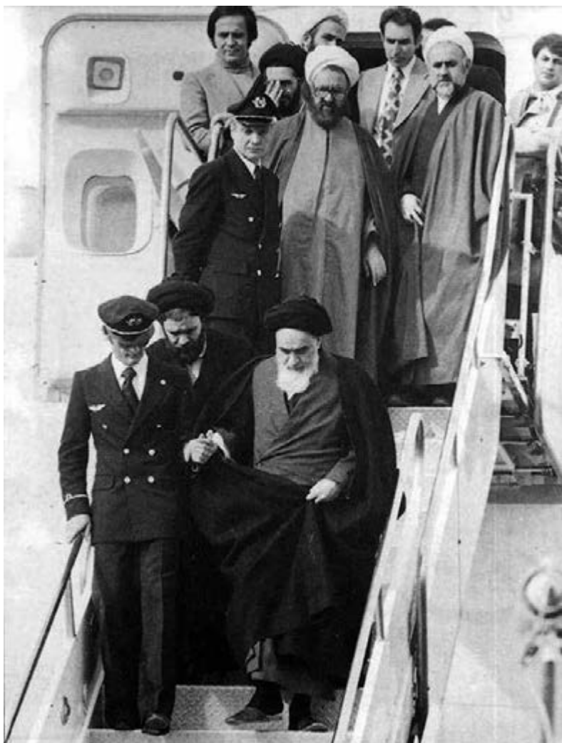
47. Terugkomst van Khomeini op Vliegveld Mehrabad, 1 februari 1979. Sadegh Ghotbzadeh staat achteraan, met op deze foto alleen zijn haar en schouder zichtbaar. Wikimedia Commons.