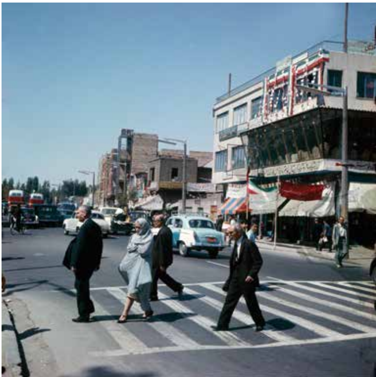
34. en 35. Straatbeeld Teheran omstreeks 1974