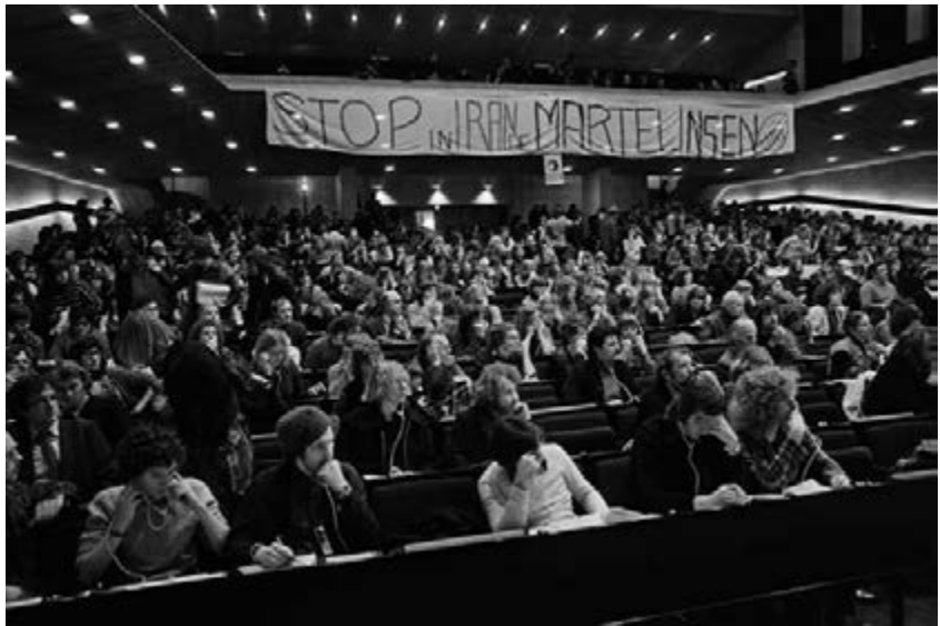
42. De week sluit af met een congres op de Vrije Universiteit.