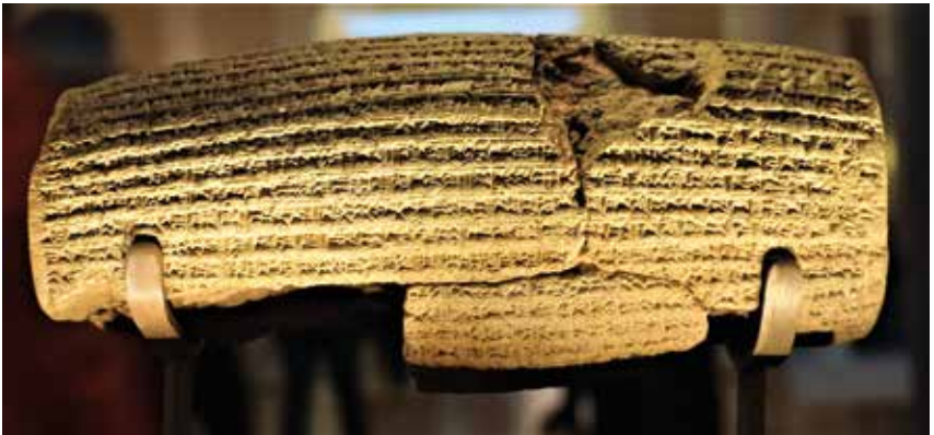
31. De Cyruscilinder in het British Museum, London.