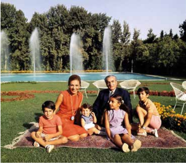
32. Mohammad Reza Pahlavi en Farah Diba met hun kinderen (v.l.n.r.) Reza, Leila, Farahnaz en Ali Reza, in 1973.