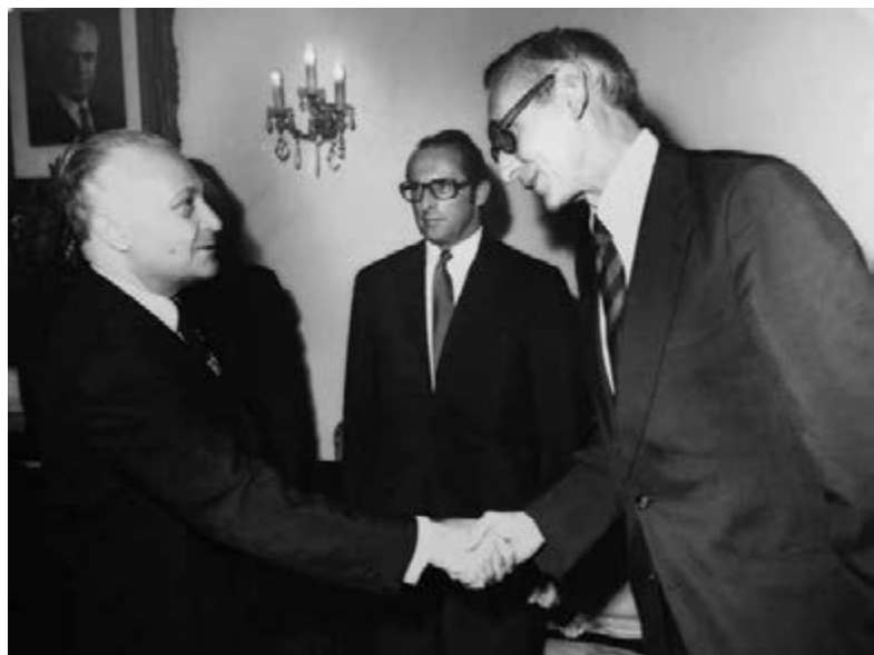
39. Minister van Buitenlandse Zaken Max van der Stoep schudt tijdens zijn bezoek aan Iran in juli 1974.