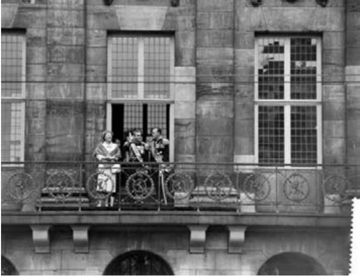
6. Staatsbezoek van Mohammad Reza Pahlavi aan Nederland. Hier met koningin Juliana en prins Bernhard op het balkon van het Paleis op de Dam.