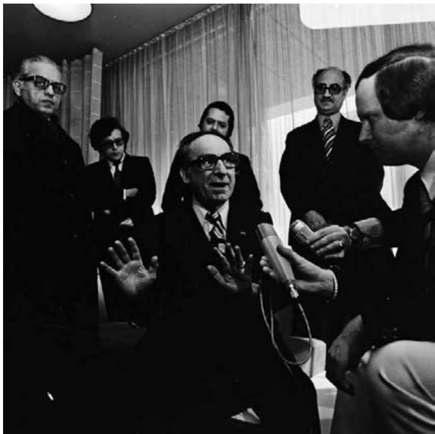
38. Ambassadeur Abbas Farzanegan staat de pers te woord bij zijn vertrek vanaf Schiphol op 16 maart 1974.