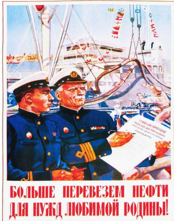
Abb. 7: Plakat »Bol'she perevezem nefti dlja nužd ljubimoj Rodiny!« aus dem Jahr 1950

Hinzu kamen unzureichende Transportkapazitäten, die selbst im Inland die Treibstoffdistribution immer wieder behinderten. Die Handelsflotte war sogar zu klein, um die Versorgung der östlichen Landesteile auf dem Seeweg zu gewährleisten, während das westliche Embargo die Möglichkeiten zum Ankauf geeigneter Schiffe einschränkte und die Anwerbung ausländischer Redereien häufig an ideologischen Vorbehalten scheiterte. 89 Das Grunddilemma der fehlenden Transportkapazitäten griff auch die sowjetische Propaganda auf, indem sie Seeleute und Hafentarbeiter 1950 mithilfe von Plakaten dazu aufrief, »mehr Erdöl [...] für die Bedürfnisse der Heimat« zu verfrachten. 90 Fehlende Schiffe konnten jedoch nur eingeschränkt durch härtere Arbeit kompensiert werden. Die neutralen Staaten und in erster Linie Finnland waren in dieser Situation die einzigen