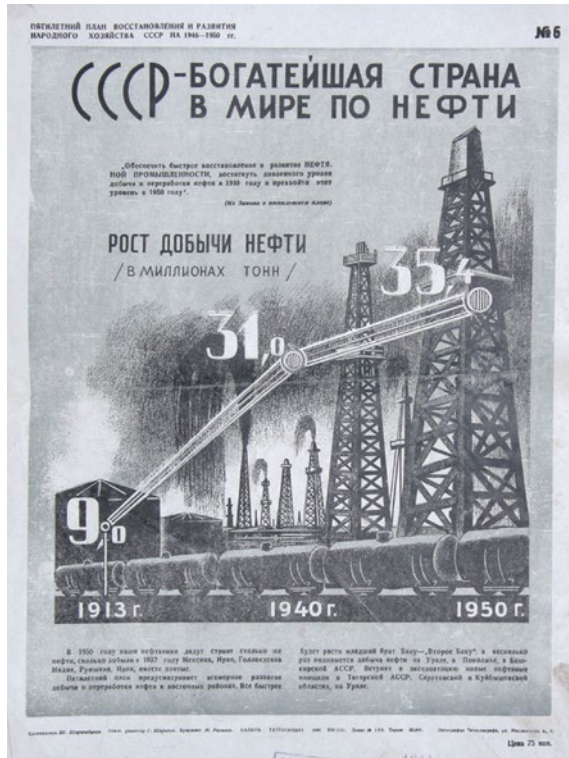
Abb. 3: Plakat »SSSR – bogatejšaja strana v mire po nefti« aus dem Jahr 1946

des Rohstoffes dringend benötigte Teile auch viele Monate nach Kriegsende nicht produziert, sodass es dem Narkommeff' gerade einmal gelang, die funktionstüchtigen Anlagen in Betrieb zu halten. 94 Eine nennenswerte Steigerung der verfügbaren Erdölmengen ließ sich auf diese Weise keineswegs erreichen.