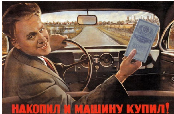
Abb. 8: Werbemotiv »Nakopil i mašinu kupil!« aus dem Jahr 1950

die Gefolgschaft der Massen sichern sollte, standen spätestens ab 1949 allerdings tatsächlich vereinzelt Privatfahrzeuge zum Verkauf. Als Motivationsanreiz für die zahllosen aufstrebenden, bereits von der Planwirtschaft geprägten und weitgehend systemtreuen Ingenieure und Manager, die »neue sowjetische Mittelklasse«, entstand in der UdSSR nach Kriegsende erstmals ein – streng limitierter – Markt für »einige tausend Automobile vom Typ »Pobeda««. 126