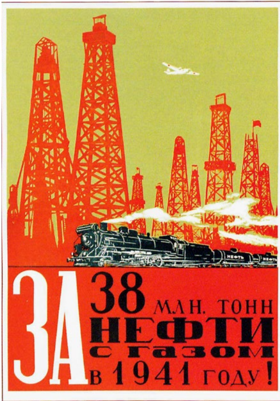
Abb. 2: Plakat »За 38 млн. тонн нефти с газом в 1941 году!« aus dem Jahr 1941

Ein Großteil der zusätzlichen Investitionen dürfte angesichts der umfassenden Pläne zum Ausbau der Kapazität zur Ausrüstungsproduktion und den Schwierigkeiten bei der Produktion von Flugzeugtreibstoffen in diesen Sektoren angefallen sein. Im Frühjahr 1941 erfolgte die erste bekannte großflächig angelegte Mobilisierungskampagne im Erdölsektor, welche die Neftjaniki durch Propagandaplakate zur Steigerung der Förderung auf »38 Millionen Tonnen Erdöl mit Erdgas im Jahr 1941« aufrief. 148 Im Morgengrauen des 22. Juni, nur wenige Stunden, nachdem der letzte Versorgungszug über die sowjetisch-deutsche Grenze gerollt war, setzte die Wehrmacht mit dem Überfall auf den einstigen