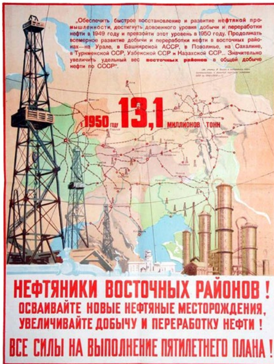
Abb. 6: Plakat »Нефтяники восточных районов!« aus dem Jahr 1947/48

den vielfach auch aus anderen verwandten Sektoren wie dem Maschinenbau oder der chemischen Industrie abgezogen, um den riesigen Personalbedarf des Erdölsektors für die Umsetzung der Perspektivziele zu stillen. 189