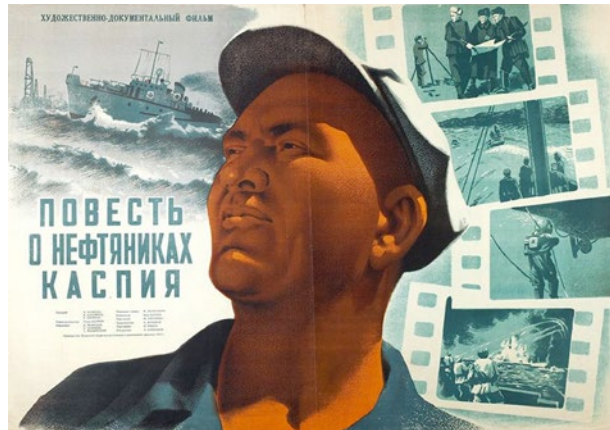
Abb. 9: »Povest' o neftjanikach Kaspija« aus dem Jahr 1953

Nahezu gleichzeitig endeten auch die Arbeiten am Film »Die Feuer von Baku« (»Ogni Baku«), der primär den selbstlosen Taten der kaukasischen Neftjaniki in den 1930er Jahren und deren Beitrag für die Abwehr der faschistischen Bedrohung während des ›Großen Vaterländischen Krieges‹ gewidmet war. Wenn gleich der Film aus unbekanntem Gründen erst nach Stalins Tod in den Kinos des Landes gezeigt wurde, weist die Entstehung gleich zweier Werke mit Bezug zum Erdöl in Anbetracht eines eingeschränkten Repertoires auf den veränderten Zeitgeist hin: Die sowjetischen Studios verwirklichte in dieser Periode jährlich nur knapp ein Dutzend Filmprojekte. 145 Die Anfang 1953 vollendete dokumentarfilmische »Erzählung über die Neftjaniki des Kaspischen Meeres« (»Povest' o neftjanikach Kaspija«) führte diesen Trend mit einem Ausblick auf die verheißungsvolle und von zahllosen technischen Errungenschaften begleitete Zukunft der Tiefseeförderung vor der Küste Bakus fort. Der Erdölsektor und seine Arbeiterschaft, so wirkt es in dem nur wenige Wochen nach Stalins Ableben abgedrehten Bericht, waren ein unverzichtbarer Aspekt der sowjetischen Moderne geworden. 146