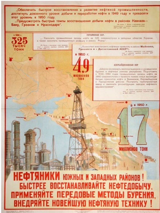
Abb. 4: Plakat »Neftjaniki južnych i zapadnych rajonov!« aus dem Jahr 1944

ten Technik auf. 4 Einflussreiche Parteikader aus dem Kaukasus bemühten sich unentwegt, die Vorzüge der in ihren Machtsphären befindlichen Ölfelder aufzuzeigen. Aus der Liste der Bittsteller sticht besonders Bagirov hervor, der sich wiederholt an seinen engen Vertrauten Berija wandte, um auf die Nöte der Neftjaniki in Baku hinzuweisen. Am 5. Mai 1944 äußerte die aserbaid-schanische Parteielite unter seiner Führung erstmals verhaltene Kritik an der Prioritätenverlagerung der Vorjahre: Um die aus den Evakuierungen hervorgehenden Materialdefizite auszugleichen und den Niedergang aufhalten zu können, musste in Baku nicht nur das Personal massiv aufgestockt, sondern