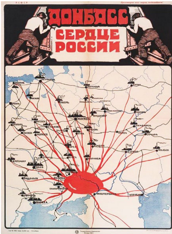
Abb. 1: Plakat »Donbass – Serdce Rossii« aus dem Jahr 1920/21

bereits 1920 als schlagendes »Herz Russlands« inszeniert, welches die Industriezentren des Landes am Leben halte. 73