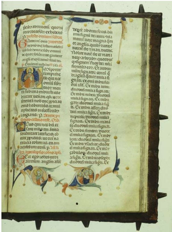
1. U.S.A., Coll. Priv., f. 240r: Messale dei Rossi .

quarto decennio del XIV secolo, reca all'inizio del libro dei Numeri un personaggio vestito di azzurro, colore araldico della famiglia, e di profilo 7 . La scelta del testo nel quale collocare l'immagine del committente è significativa, dato che il libro dei Numeri è legato al censimento e alla organizzazione del popolo ebraico al momento del suo ritorno in Israele, eventi che risultano collegabili a quelli che ebbero protagonisti i Rossi tra 1334 e 1344, cioè tra l'istituzione degli otto sapienti da parte di Rolando Rossi 8 e il ritorno dall'esilio padovano 9 .