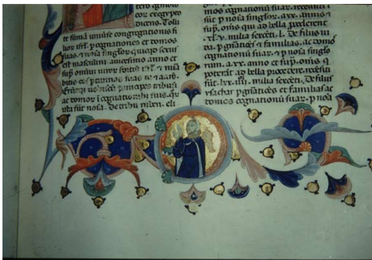
2. Genova, Biblioteca Durazzo, ms. B.IX.13, f. 57v: Bibbia dei Rossi .

giosi manoscritti liturgico-devozionali, i due Messali-Libri d'Ore 10 , e i codici di argomento classico fatti realizzare da una delle più prestigiose botteghe parigine, attiva anche per Gian Galeazzo Visconti, l' atelier del Ravanelle Master 11 ; nei primi due, attualmente conservati alla Bibliothèque nationale de France [fig. 3-4], il committente si fa ritrarre nel frontespizio, inginocchiato davanti alla Vergine, immediatamente riconoscibile a causa dell'abbigliamento, rigorosamente dell'eponimo colore. Nel ms. Lat. 757, destinato verosimilmente alla cappella di famiglia, come denuncia la scrittura su due colonne e le rubriche latine, Bertrando indossa abiti da corte con gioielli e l'impresa viscontea del sole raggiato, mentre la Vergine tra angeli musicanti e con ai piedi la falce lunare si presenta come la Regina dei cieli; nel più piccolo Smith Lesouëf 22, destinato all'uso privato, Maria è raffigurata seduta a terra, come Vergine dell'Umiltà, e il nobile parmense indossa semplici abiti rossi, mentre si inseriscono nella scena i santi intercessori, a spezzare l'orgoglioso rapporto diretto fra Bertrando e la Madre Divina. Nei due codici classici, traduzioni francesi della prima, terza e quarta decade di Livio (L'Aja, Koninklijke Bibliothek, ms. 71.A.16-17) e delle Epistolae ad Lucilium di Seneca (Bruxelles, Bibliothèque Royale Albert I er , ms. 9091), non vi sono ritratti, ma compare abbondante-