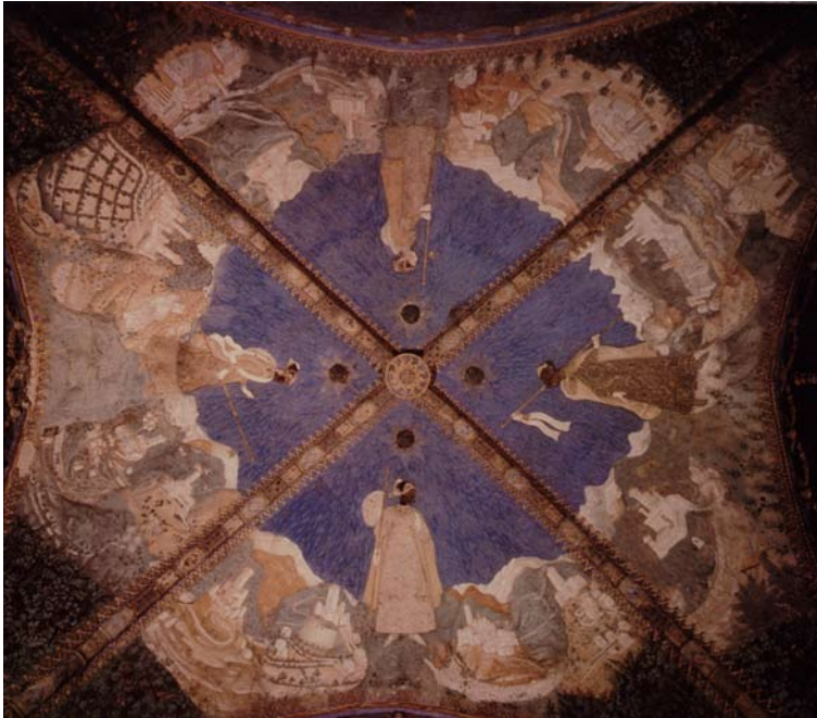
6. Torrechiarà (PR), Castello, Camera d'oro, Volta.

dal vassallo al proprio signore 34 . Ma è veramente Bianca l'unica protagonista di questi cicli narrativi?