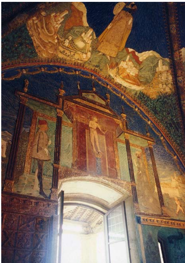
10. Torrechiara (PR), Castello, Camera d'oro.