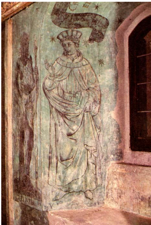
14. Torrechiara (PR), Castello, Camera d'oro, Studiolo.

ben testimonia la complessa cultura del committente e la sua devozione, cui rimanda in modo complesso ma inequivocabile l'idea stessa del pellegrinaggio.