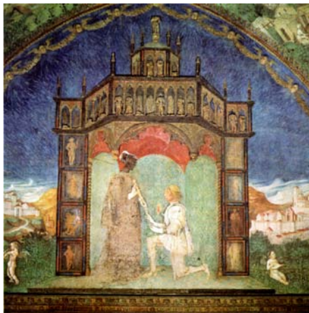
13. Torrechiarà (PR), Castello, Camera d'oro, Tempio della Fama.

greci raffigurati nello studiolo, filosofi, statisti, oratori e poeti ben illustra gli interessi del committente, tanto più che la stanza doveva servire anche come archivio privato del Rossi, come attesta l'armadio scavato nella parete sud-ovest, mentre la presenza di un Christus patiens , sovrastato dalla preghiera « Cristus rex venit in pace et Deus homo factus est », solitamente iscritta nelle campane e nelle torri, perché recitata come difesa contro i fulmini e le bufere,