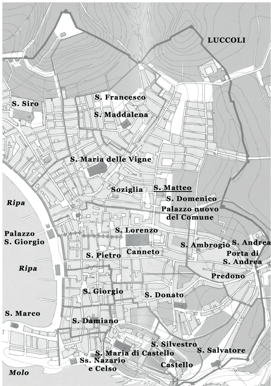
Fig. 2. San Matteo nel contesto di altri enti ecclesiastici nella Genova del secolo XIII.