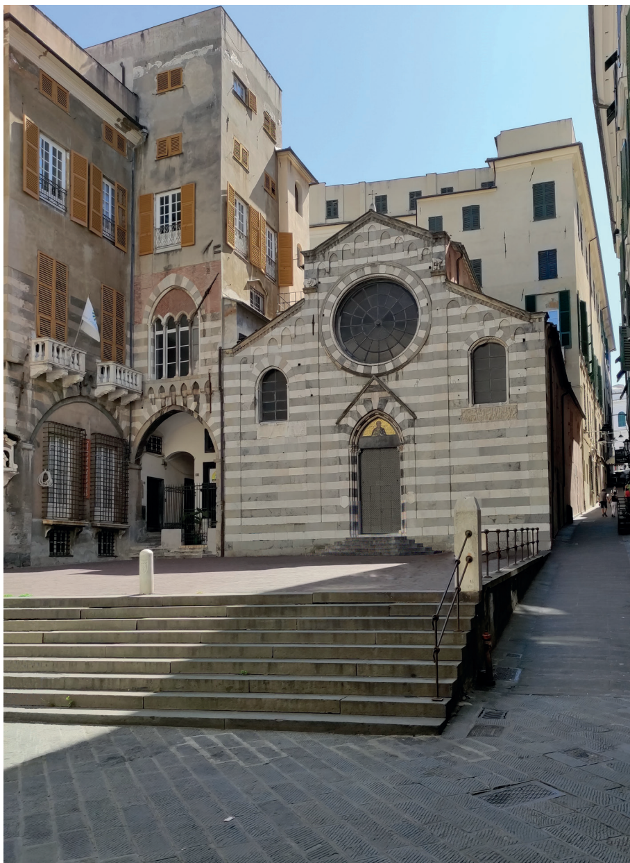
Fig. 1. La chiesa e la piazza di San Matteo, con l'accesso al chiostro sulla sinistra, visti dal portico di uno dei palazzi antistanti; sulla destra la salita San Matteo che portava alla chiesa di San Domenico (non più esistente e situata in corrispondenza dell'attuale Teatro Carlo Felice).