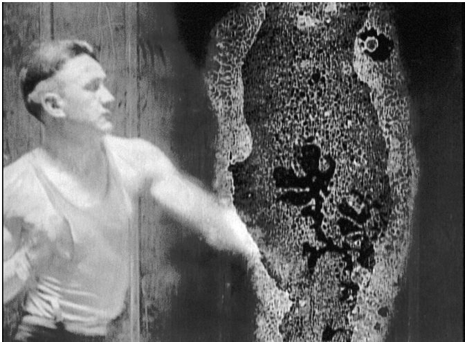
Decasia: Boxer kämpft mit der Auflösung des Zelluloids

Decasia kommt vollständig ohne Offkommentar aus und verzichtet als ein eher an der Materialität des Zelluloids interessierter Experimentalfilm auf Narration, im Sinne einer erzählerischen Figurenhandlung. Dennoch entsteht hier etwas, das im Kapitel zu William James' Stream of Thought als eine Dramaturgie