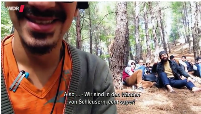
Meine Flucht: Selfie-Video

Meist wird das Selfie in der breiten Diskussion über digitale Kultur als Form einer narzisstischen Selbstinszenierung geschmäht. Sich mit einem filmenden Telefon zu sich und seiner unmittelbaren Umwelt in Beziehung zu setzen und sich zu ihr verhalten zu können, kann im Sinne des Konzepts der anthropomedialen Relation jedoch eine stabilisierende und selbstermächtigende Funktion haben. Mit dem Handy in der Hand kann man gewissermaßen zum Zuschauer der eigenen Situation werden, was auch entlastend wirken kann. In Meine Flucht wird das Handyvideo eines Mannes gezeigt, der mit seinem kleinen Sohn und weiteren Geflüchteten von den Schleusern im leeren Benzintank eines Busses über die Grenze geschmuggelt wurde. In dem dunklen Video sieht man nur eine hellgraue Metallwand, mit einem winzigen Loch, durch das die Eingeschlossenen mit dem