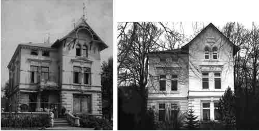
Abb. 3: Dockenhuden, Schanzkamp 52 (Fotos: Familie Carver).

überzeugter Antialkoholiker. Alle Getränke und Speisen, die Alkohol enthielten, durften in der Familie nicht auf den Tisch kommen. 108