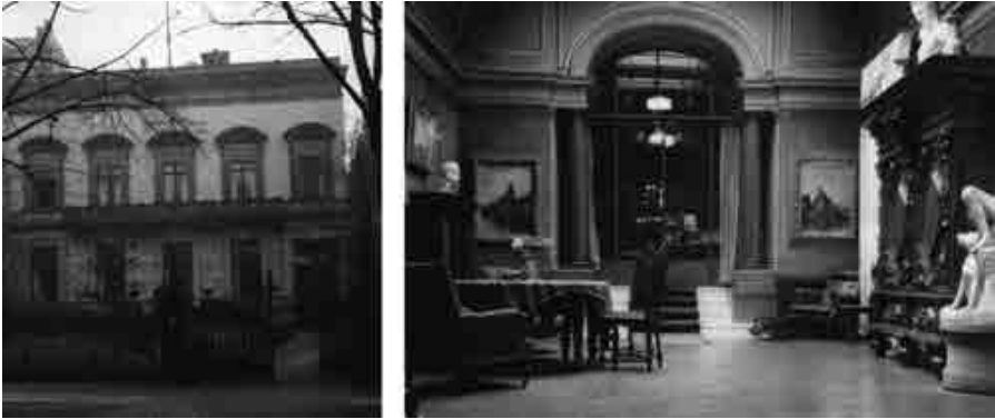
Abb. 4: Neue Rabenstraße 21.