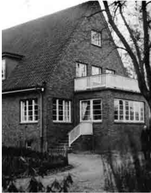
Abb. 11: Das Haus der Familie Liebeschütz, Schanzkamp 5 (Foto: Wolfgang Liebeschuetz; Hamburger Bibliothek für Universitätsgeschichte).