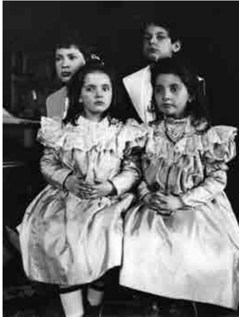
Abb. 2: Die Plaut-Kinder.

noch viele Wiesen, Parks und große Gärten umfasste. Hugo Carl Plaut richtete in der Nähe des Wohnhauses ein Labor ein. Die Tätigkeit als praktischer Arzt nahm er nicht wieder auf, sondern beschränkte sich auf seine Arbeit als Bakteriologe. 99