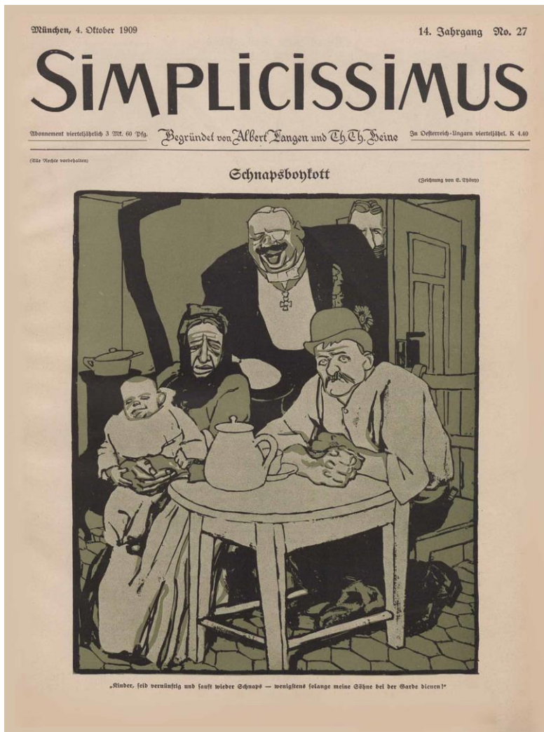
Kinder, seid vernünftig und faust wieder Schnaps - wenigstens solange meine Kinder bei der Garde dienen ( Simplicissimus , 4. Oktober 1909, Schnapsboykott ) Niños, sean razonables y beban aguardiente de nuevo, al menos mientras mis hijos sirvan en la Guardia. (Portada de la revista Simplicissimus , 4 de octubre de 1909, Schnapsboykott : boicot al aguardiente)

Como resultado de estas intervenciones, la resolución número 287 fue adoptada por unanimidad. Pero el boicot al consumo de aguardiente adoptado por el congreso de Leipzig en 1909 surtió muy pocos efectos, y no todos ellos fueron positivos.