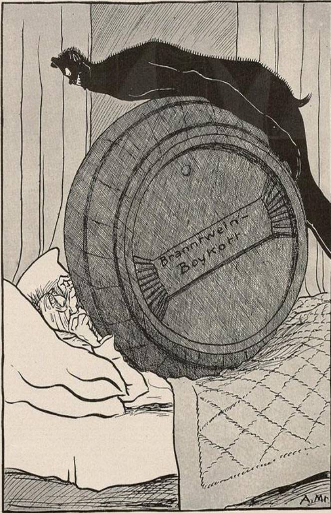
Schwerer Traum eines ostelbischen Schnapsbrenners.

Junkers Alpdrücken: Branntwein-Boycott: Schwerer Traum eines ostelbischen Schnapsbrenners (Der wahre Jacob, 1909, Jg. 26, Heft 607, 23. Oktober 1909, Seite 6405) Pesadillas de Junker: Boicot al brandy: Sueño pesado de un destilador de aguardiente del este del Elba (Revista Der wahre Jacob, 1909, vol. 26, número 607, 23 de octubre de 1909, página 6405)