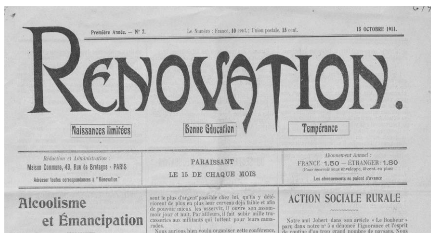
Portada del periódico neomalthusiano Rénovation , dirigido por Gustave Cauvin. Debajo del nombre de la publicación puede leerse preceptos malthusianos: “Nacimientos limitados”, “Buena educación”, “Temperancia”.

contrarrestar los argumentos guesdistas de que la lucha antialcohólica era una desviación de los objetivos revolucionarios reales. Igualmente, la fuerte prédica abstencionista de la Fédération des Ouvriers Antialcooliques le permitió rápidamente asociarse con prominentes neomalthusianos como Gustave Cauvin, animador de un pequeño, pero muy popular grupo denominado Confédération des Groupes Ouvriers Néomalthusiens que publicaba un periódico titulado Rénovation . Esta faceta del discurso abstinentista tuvo como corolario argumentaciones con poco o nulo respaldo empírico, como la afirmación de que el alcoholismo fomentaba la procreación de demasiados niños, lo que dificultaba el desarrollo de la clase obrera. 51