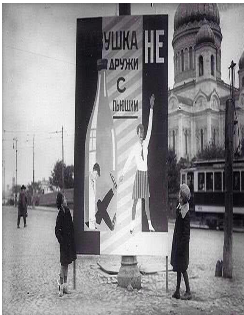
Девушка, не дружи с пьющим! Москва, Улица Волхонка, 1925-1930 гг. ¡Chica, no seas amiga de un bebedor! Moscú, calle Voljonka, años 1925-1930.