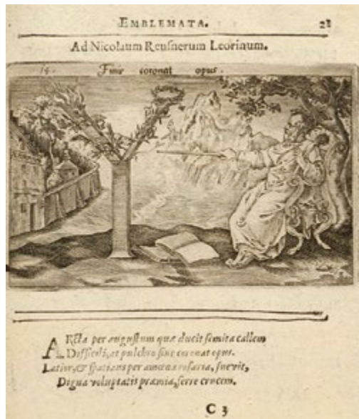
Fig. 3 – Jean Jacques Boissard, Emblematum liber / Emblemes latins, avec l'interpretation françoise , Metz, Jean Aubry, Abraham Faber, 1588. http://www.emblems.arts.gla.ac.uk/french/facsimile.php?id=sm415_c3r