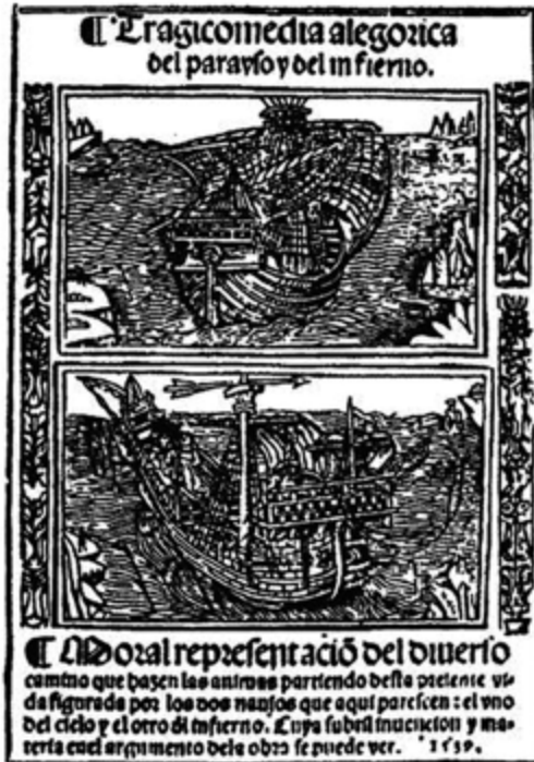
Fig. 4 – Tragicomedia alegórica del paraíso y del infierno (1539). https://commons.wikimedia.org/wiki/File:Tragicomedia_alegoria_del_parayso_y_del_infierno.jpg

immagini e di allusioni bibliche. Uno dei primi autos sacramentales in cui si mostra questo duello è El viaje del alma di Lope de Vega, composto intorno al 1598-1599, in occasione delle doppie nozze regali di Filippo III con Margherita d'Austria e della sorella del re Isabella Clara Eugenia con l'arciduca Alberto d'Austria (Wright 2001, 74-5; Izquierdo Domingo 2013, 116-21), e incluso, assieme ad altri tre, all'interno di El peregrino en su patria , pubblicato a Siviglia nel 1604 (Vega Carpio 2016, 185-237).