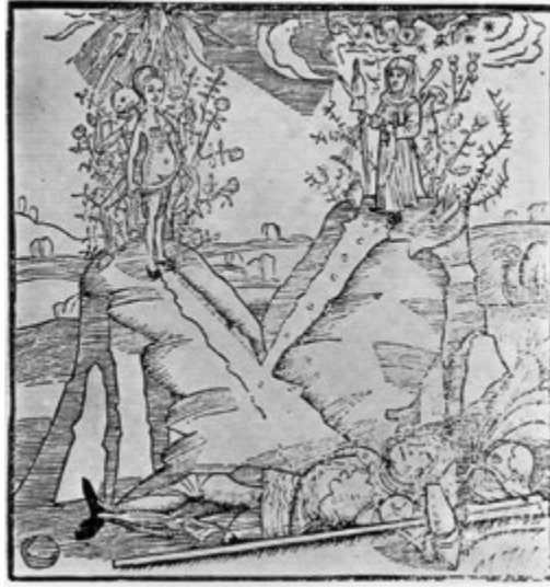
Fig. 2 – La decisione di Ercole , xilografia da Sebastian Brant, Stultifera Navis , Basilea, 1497, f. 130v (da 1930).