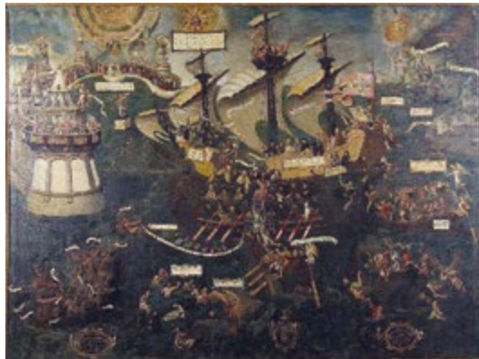
Fig. 6 – [Juan Pantoja de la Cruz, attr.] La nave de la Iglesia y el puerto de la salvación , Casa Museo Lope de Vega, Madrid. http://ceres.mcu.es/pages/Viewer?img=/CLVM/fondos_sello/CLVMFCE00097_S.JPG