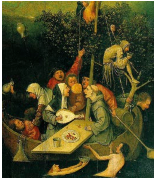
Fig. 5 – Hieronymus Bosch, La nave dei folli (1494), Museo del Louvre, Parigi. https://lostresanillos.files.wordpress.com/2016/06/navelocos2.jpg?w=830