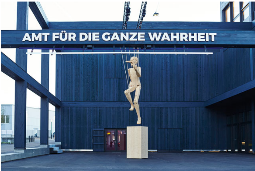
Abb. 1 Stapferhaus, „Amt für die ganze Wahrheit“.

der Besucherinnen und Besucher angewiesen: Sie sind eingeladen, Selbstverständliches zu hinterfragen, neue Perspektiven zu entdecken – und sie werden aufgefordert, selbst Position zu beziehen.