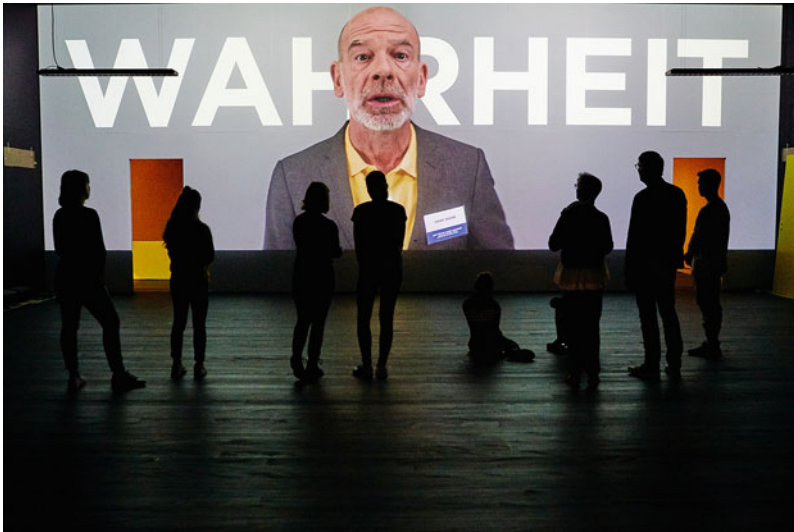
Abb. 2 Stapferhaus, Begrüssung durch den Chefbeamten.

sich selbst belügen? Und möchten Sie immer die Wahrheit wissen, auch wenn sie vielleicht wehtut? Die Besucherinnen und Besucher positionieren sich gemäss ihrer Antwort, sodass sich Hans Wahr – und gleichzeitig die anderen Besucherinnen und Besucher im Raum – ein erstes Bild ihrer Haltung zu Lüge und Wahrheit verschaffen können.