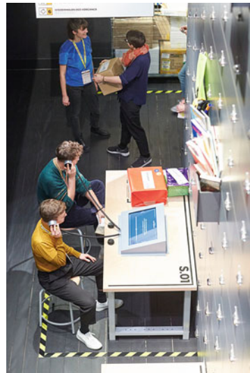
Abb. 5 Stapferhaus, „Zentrale Lügenanlaufstelle“.

Das Amt erhebt bei jeder Lügenbewertung Alter, Geschlecht und politische Einstellung der Besucherinnen und Besucher. So wird sichtbar, dass die Beurteilung bestimmter Lügen auch abhängig vom persönlichen Hintergrund ist. Je