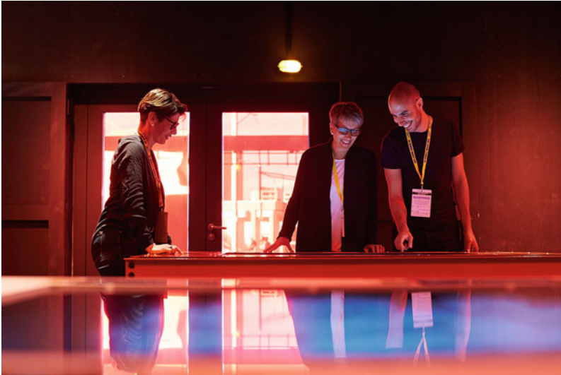
Abb. 4 Stapferhaus, „Dienststelle für Wahrheitsfindung und -sicherung“.

Die Besucherinnen und Besucher sind eingeladen, an zwei digitalen Tischen tatsächlich publizierte Nachrichten mittels verschiedener Instrumente auf ihren Wahrheitsgehalt zu prüfen. Sie können die einzelnen Nachrichten anwählen und lesen. Hilfsmittel wie die Möglichkeit zur Recherche von Hintergrundinformationen, Autorschaft und Quellen helfen, die Texte differenzierter zu betrachten. Auf dieser Grundlage bilden sich die Besucherinnen und Besucher eine Meinung, ob es sich bei der Nachricht um Fake News oder wahre Information handelt. Sie müssen den Artikel als wahr oder falsch einstufen – die allfällige Richtigstellung ihrer Einordnung folgt sofort. Der Faktencheck-Tisch fördert so auf spielerische Weise die Medienkompetenz.