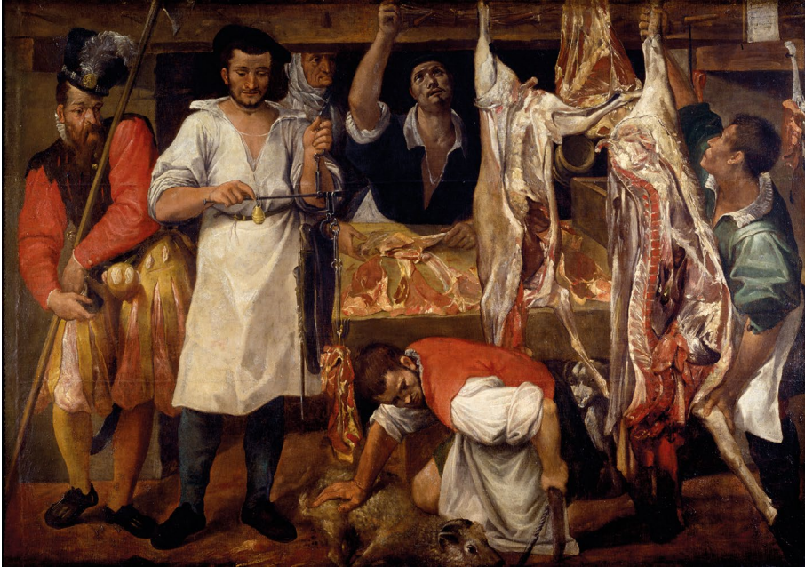
Abb. 7 | Annibale Carracci, Die große Metzgerei, nach 1580, Öl auf Leinwand, Christ Church Gallery, Oxford (Christ Church Gallery, Oxford).

aus, vergrößert die Nase, rundet die Augen ab, krönt das verzerrte Haupt mit einer übermäßigen Kopfbedeckung, deren weiße Feder das kurvige Antlitz burlesk fortsetzt, und bietet dem Betrachter somit eine lachhafte Karikatur des Autors der ‚Vite‘. Abschließend akzentuiert auch die überdimensionierte Schamkapsel die Lächerlichkeit des parodistischen Kryptoporträts Vasaris. 53