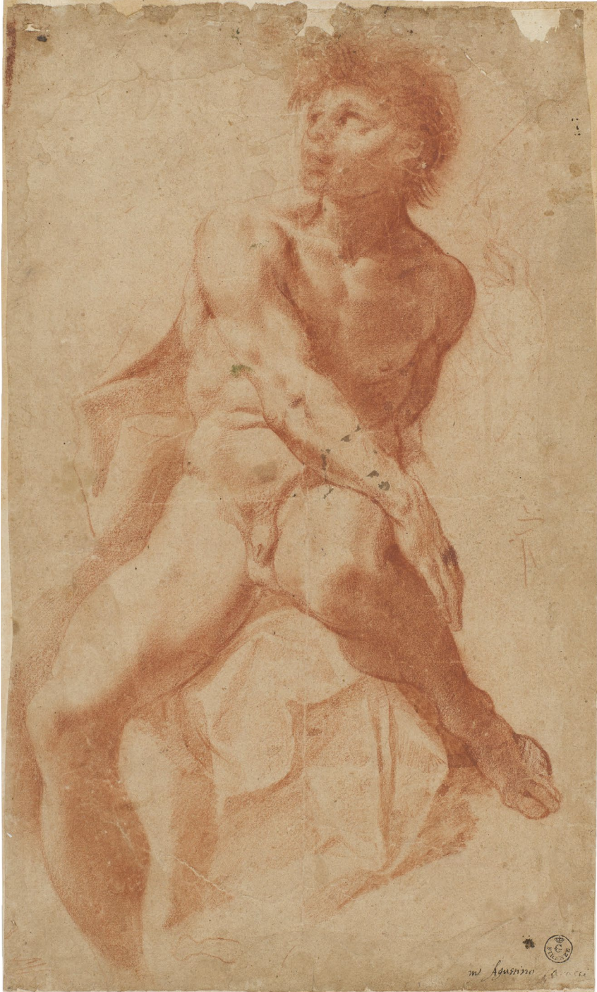
Abb. 14 | Agostino Carracci, Figurenstudie, o.J., Zeichnung, Gabinetto delle stampe e dei disegni, Uffizien, Florenz (Gabinetto delle stampe e dei disegni, Uffizi, Florenz).