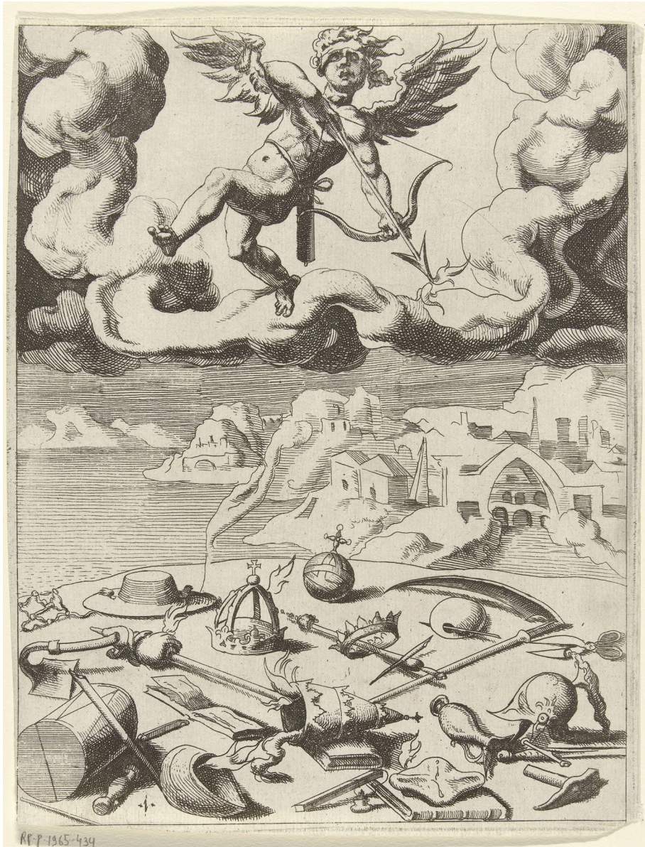
Abb. 3 | Dirck Volckertsz Coornhert (zugeschrieben), Triumph der Liebe, nach 1532, Kupferstich, Rijksmuseum, Amsterdam (Rijksmuseum, Amsterdam).