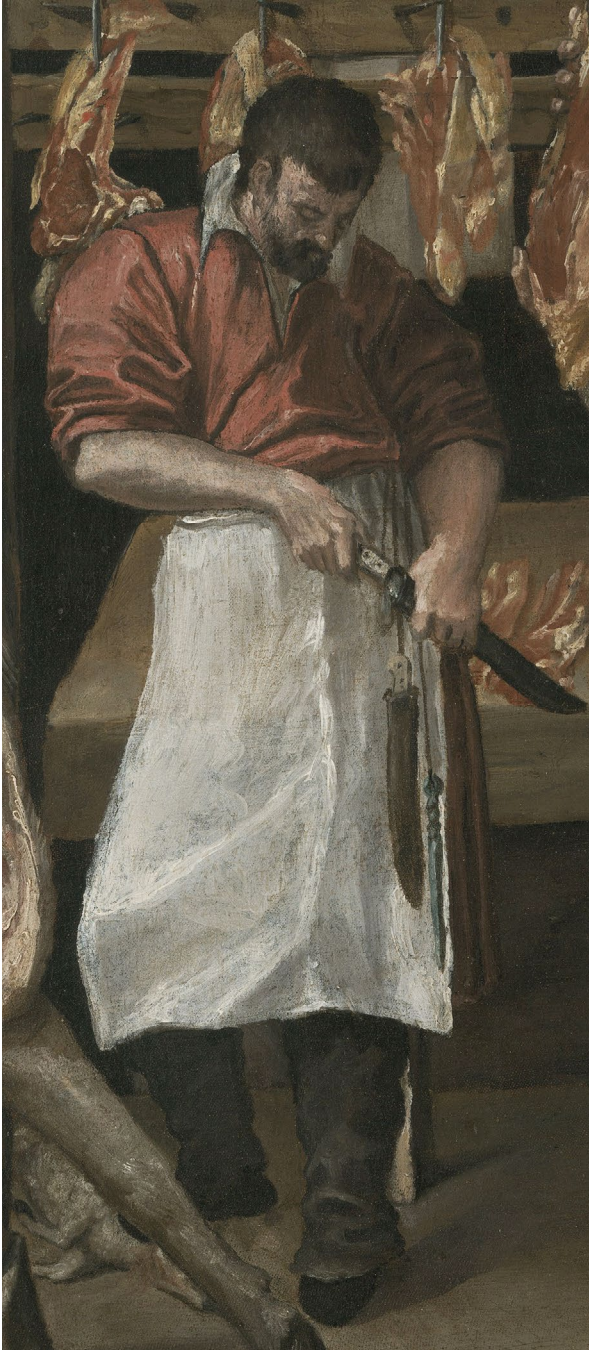
Abb. 12 | Annibale Carracci, Die kleine Metzgerei, nach 1580, Öl auf Leinwand, Kimbell Art Museum, Fort Worth, Texas (Detail; Kimbell Art Museum, Fort Worth, Texas).