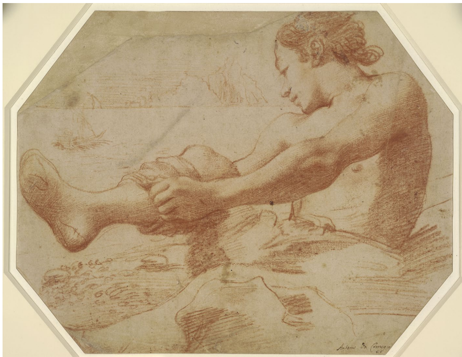
Abb. 13 | Annibale Carracci, Ein Junge seine Socken ausziehend, 1583–1584, Zeichnung, British Museum, London (The British Museum Images).

der Decke der Sixtinischen Kapelle gedeutet werden kann, lässt sich feststellen, dass das Imitationsverfahren von Agostino demjenigen seines Bruders Annibale entsprach (Abb. 14 u. 15). 80 Doch im Fall des Kupferstichs ‚Nymphe, kleiner Satyr und Kind‘ (Abb. 2) weicht er von dieser Konzeption deutlich ab. Das dissimulierte, variierte und naturgetreue Nachahmungsergebnis in Agostinos Studie aus dem Florentiner Gabinetto dei Disegni e delle Stampe der Uffizien steht in offenem Kontrast zu der offensichtlichen imitatio des Kupferstichs (Abb. 2 u. 6) – obwohl auch hier eine Dissimulation des Motivs durch eine Veränderung des Geschlechts der Figur stattfindet. Ausgehend von der theoretischen Positionierung Agostinos in der Kunstszene seiner Zeit und der Untersuchung seiner künstlerischen Verfahren bei der Imitation normativer Vorbilder stellt sich mit Blick auf den Kupferstich ‚Nymphe, kleiner Satyr und Kind‘ folgende Frage: Wollte Agostino durch seine deutliche, herabsetzende sowie lächerliche Nachahmung des Motivs Michelangelos – zumal dieser schon vor einigen Jahren verstorben war – eine witzige Invektive gegen die Kunsttheorie Vasaris, eine Verspottung der michelangiologisti und eine Parodie auf deren Imitationspraxis