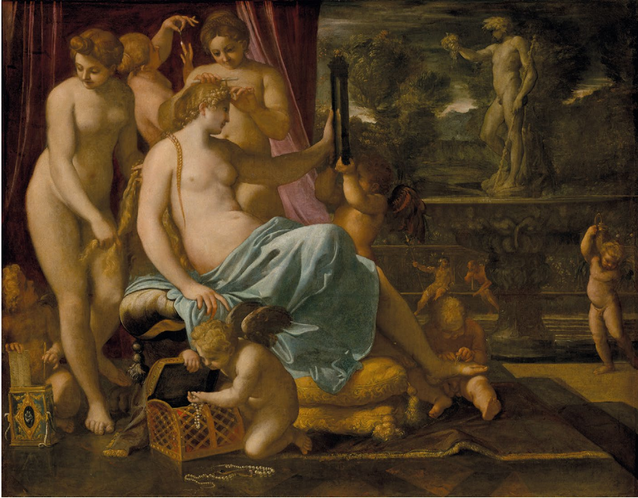
Abb. 3 | Annibale Carracci, Die Toilette der Venus, 1590–1595, Öl auf Holz, auf Leinwand übertragen, Samuel H. Kress Collection, National Gallery of Art, Washington D.C.