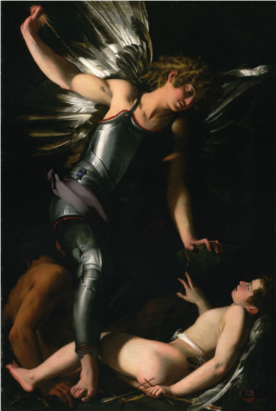
Abb. 14 | Giovanni Baglione, Der himmlische Amor besiegt den irdischen Amor, 1602–1603, Öl auf Leinwand, Inv. Nr. 381, Gemäldegalerie, Staatliche Museen zu Berlin, Berlin.