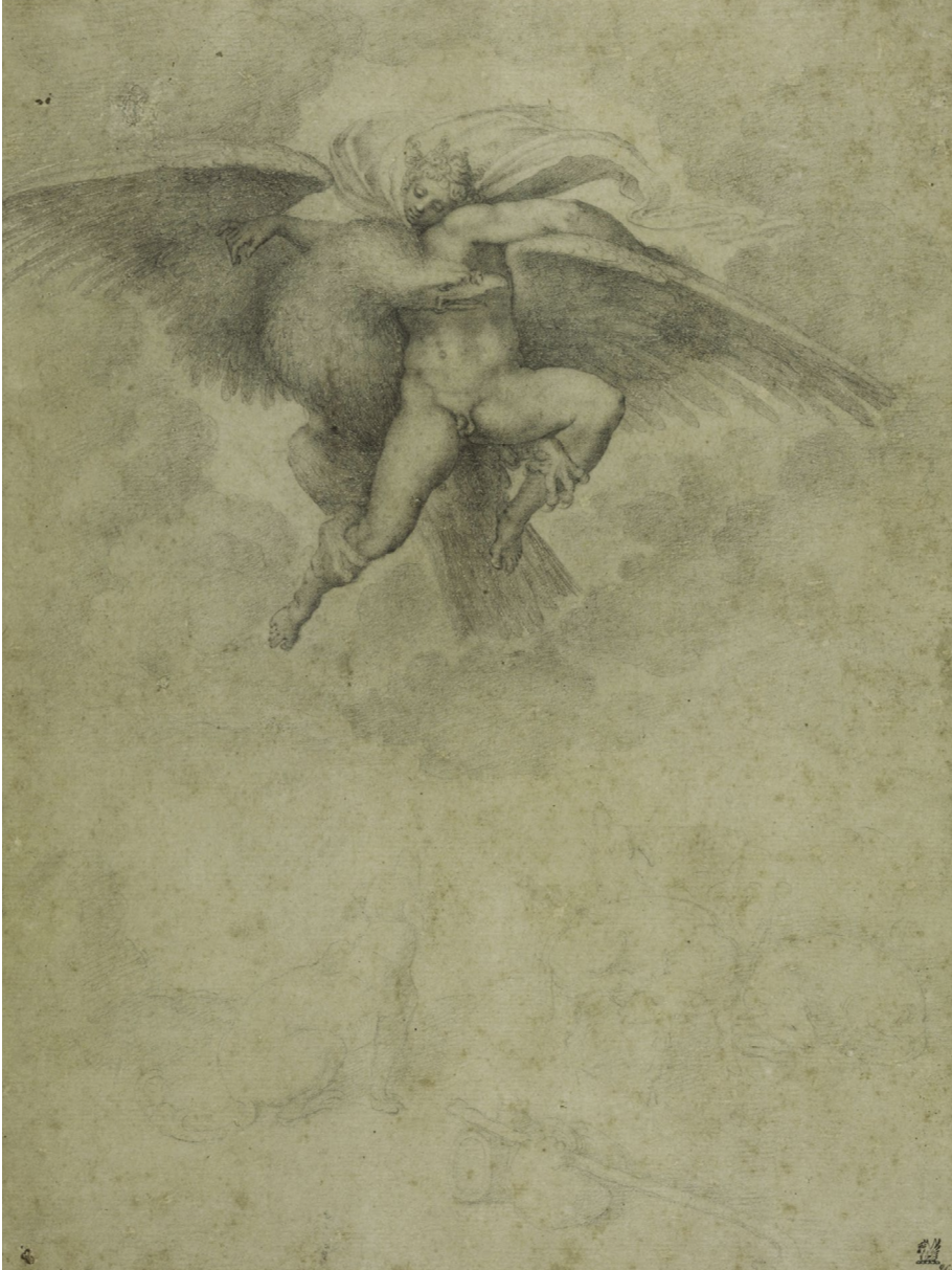
Abb. 7 | Michelangelo, Der Raub des Ganymed, 1532, Schwarze Kreide, Fogg Art Museum, Cambridge (Fogg Art Museum, Cambridge).