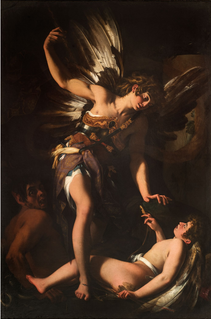
Abb. 15 | Giovanni Baglione, Der himmlische Amor besiegt den irdischen Amor, 1602-1603, Öl auf Leinwand, inv. n. 1268, Gallerie Nazionali di Arte Antica, Palazzo Barberini, Rom.