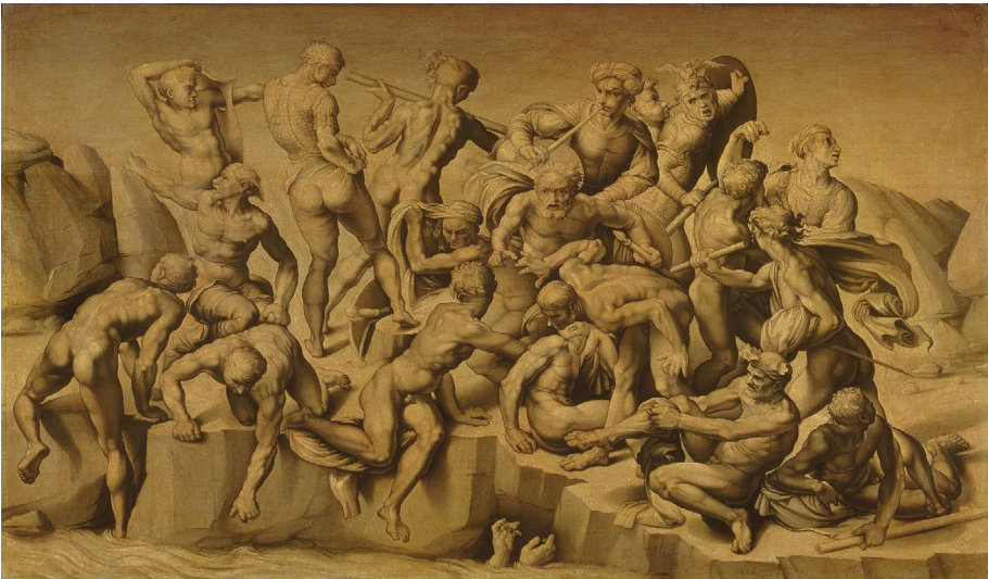
Abb. 5 | Bastiano da Sangallo nach Michelangelo, Die Schlacht von Cascina, 1542, Öl auf Holz, Holkham Hall, Norfolk.