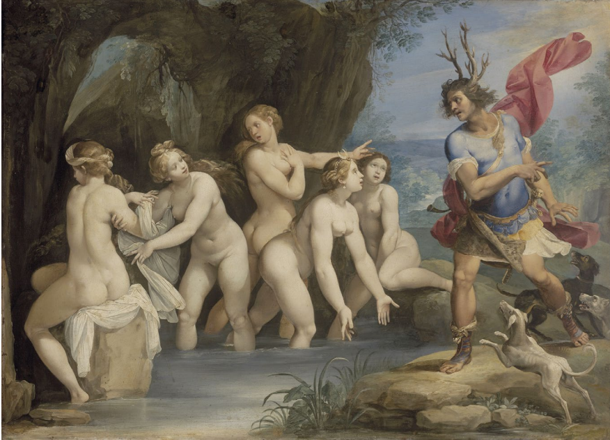
Abb. 10 | Giuseppe Cesari, Diana und Aktäon, ca. 1602–1603, oil on copper, Inventory number: 508, Szépművészeti Múzeum – Museum of Fine Arts, Budapest.