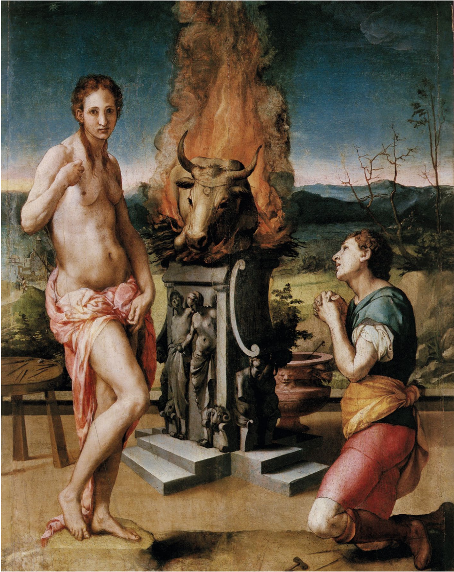
Abb. 16 | Bronzino, Pygmalion und Galatea, Öl auf Holz, 1529-1530, Uffizien, Florenz (Uffizi, Florenz).