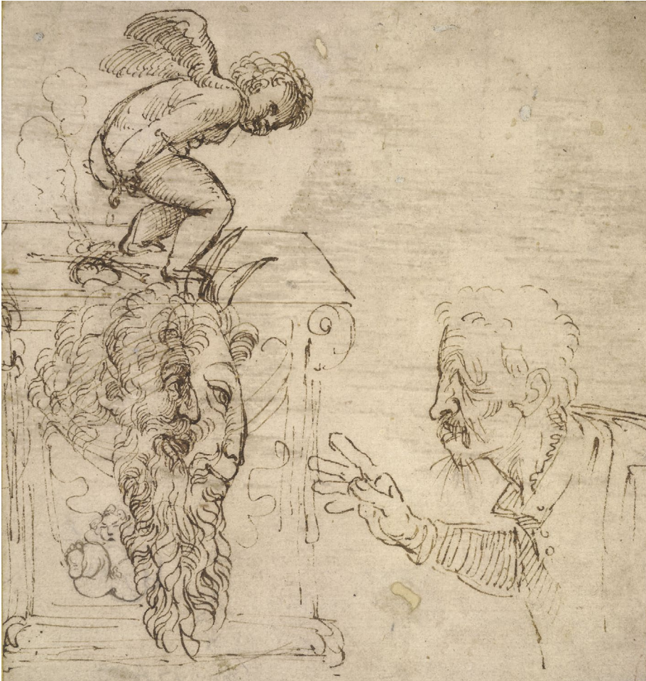
Abb. 2 | Annibale Carracci, Skizzenblatt mit einem defäkierenden Putto, o.J., Zeichnung, British Museum, London.