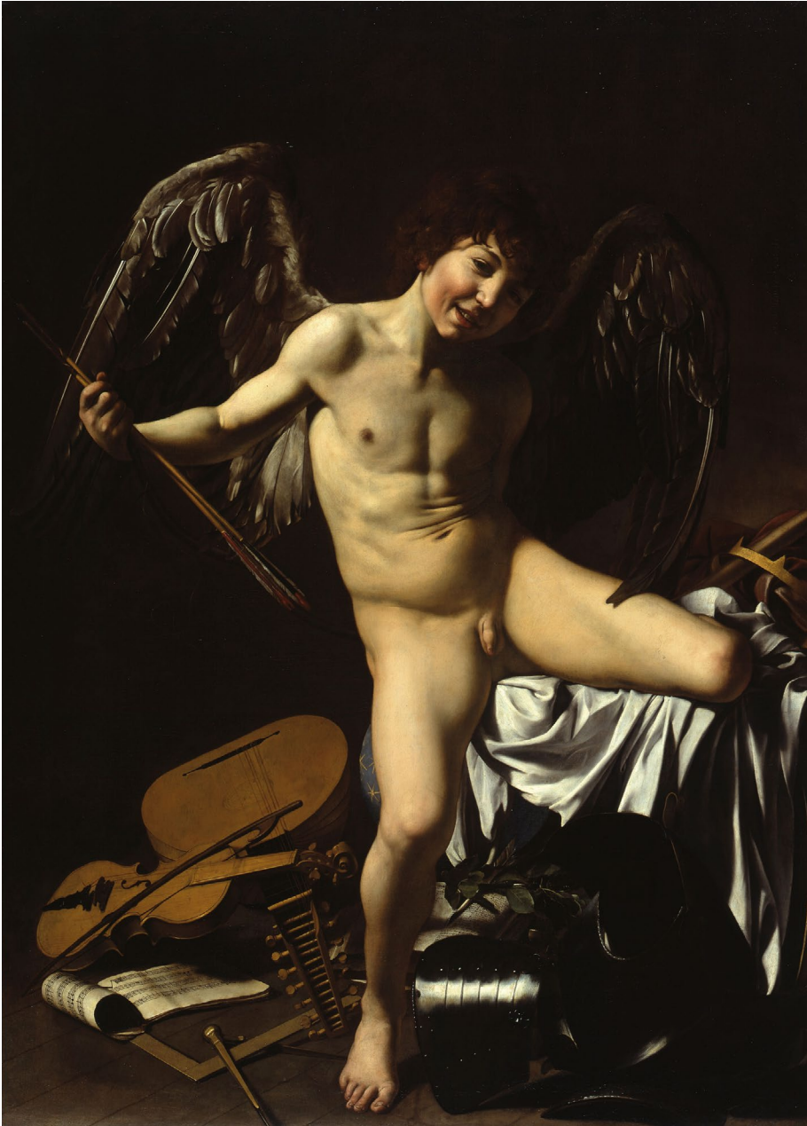
Abb. 1 | Michelangelo Merisi da Caravaggio, Amor als Sieger, 1601–1602, Inv. Nr. 369, Gemäldegalerie, Staatliche Museen zu Berlin, Berlin.