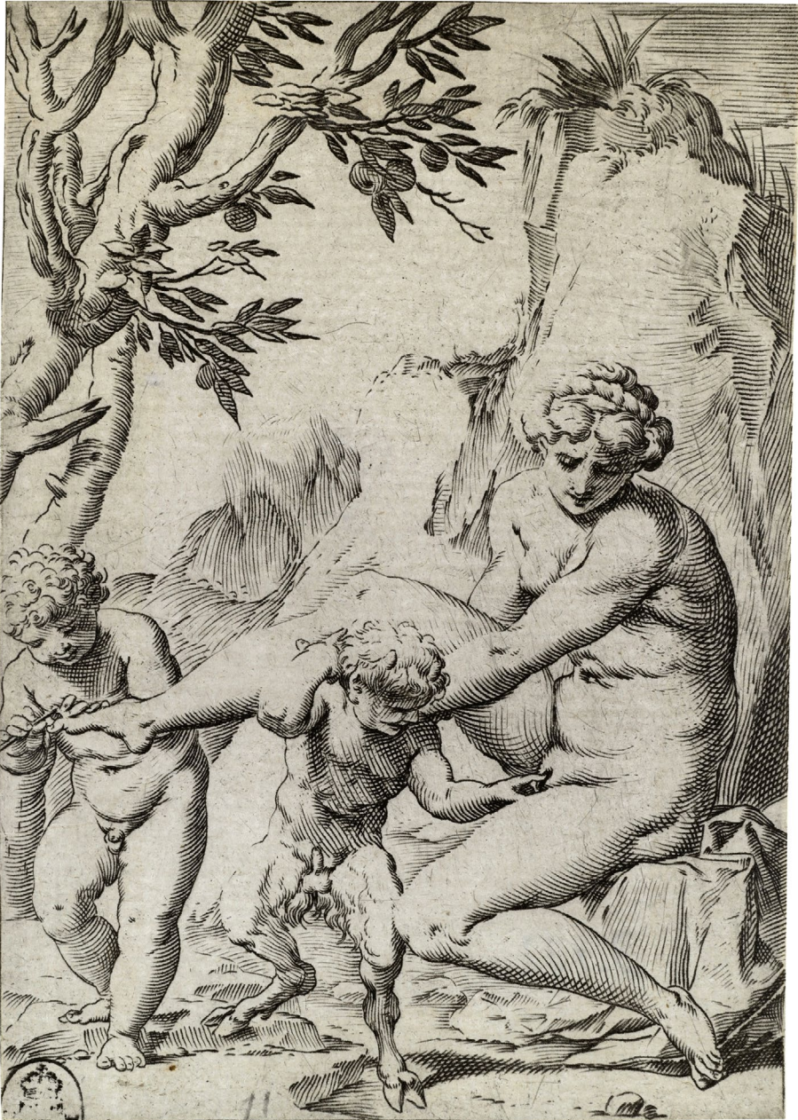
Abb. 2 | Agostino Carracci, Nympha, kleiner Satyr und Kind, 1580–1590, Kupferstich, Kupferstich-Kabinett, Staatliche Kunstsammlungen Dresden (© Kupferstich-Kabinett, Staatliche Kunstsammlungen Dresden, Foto: Herbert Boswank).