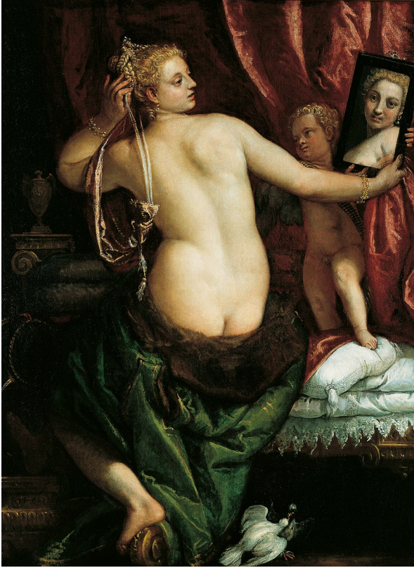
Abb. 4 | Paolo Veronese, Venus bei der Toilette, um 1582, Öl auf Leinwand, Joslyn Art Museum, Omaha.

findet, welche die Liebe sowohl entzünden als auch auslöschen können. Das Gemälde konfrontiert uns mit dieser offenen Frage, wissen wir doch nicht, für welchen Pfeil sich der Knabe entscheiden wird, wenn er seinen Bogen wieder spannt. 29 Caravaggio kombiniert Triumph- und Venus-Ikonographie, um die Macht des Sehnsinns zu präsentieren. Zugleich modifiziert er den Aspekt der Verführung, weil nicht der Körper der Venus, sondern jener ihres Sohnes und Vertrauten als homoerotisches Objekt ins Zentrum der Komposition tritt. Amor hat die Macht, die Betrachter verliebt zu machen. Auf diese Weise kann Caravaggio das Thema der Knabenliebe präsentieren und es zugleich verbergen. 30