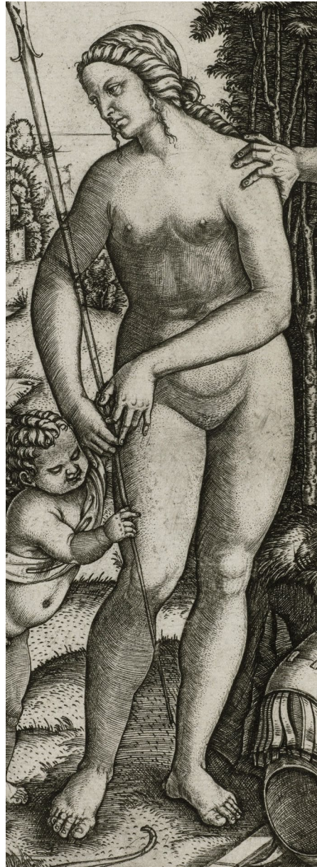
Abb. 11 | Marcantonio Raimondi, Venus, Mars und Cupido, 1508, Kupferstich, Kupferstich-Kabinett, Staatliche Kunstsammlungen Dresden (Detail; © Kupferstich-Kabinett, Staatliche Kunstsammlungen Dresden, Foto: Herbert Boswank).