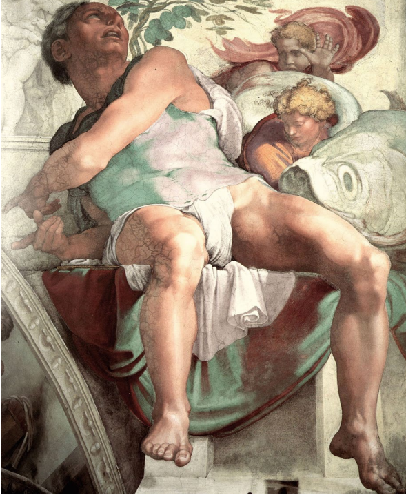
Abb. 15 | Michelangelo, Jonas, 1511 – 1512, Fresko, Sixtinische Kapelle, Vatikanstadt.

inszenieren? Und könnten der Putto und der Satyr metaphorisch die Verehrer Michelangelos verkörpern?