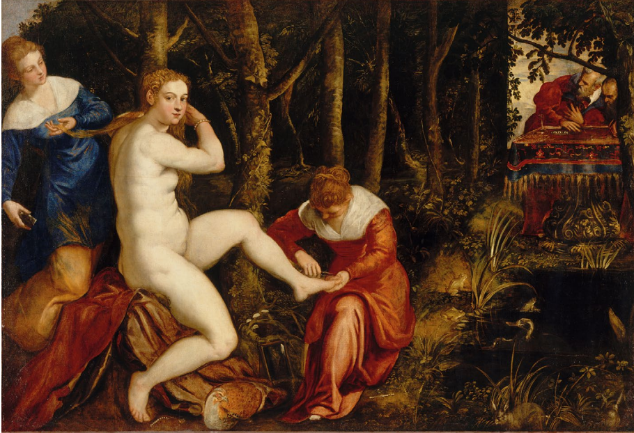
Abb. 4 | Tintoretto, Susanna und die beiden Alten, um 1550, Öl auf Leinwand, Louvre, Paris.