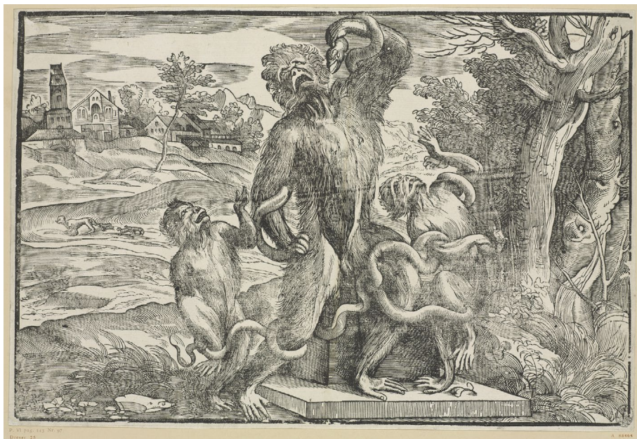
Abb. 1 | Niccolò Boldrini nach Tizian, Der Affenlaokoon, 1540er Jahre, Holzschnitt, Kupferstich-Kabinett, Staatliche Kunstsammlungen Dresden (© Kupferstich-Kabinett, Staatliche Kunstsammlungen Dresden, Foto: Estel/Klut).

Kunstauffassung bedingungslos vertreten, werden durch die Bildparodie verächtlich als scimmie (wörtlich Affen, gemeint Nachäffer) der Antike betrachtet, weil sie die antiken Meisterwerke ständig scimmiottano (nachäffen). 4 Ohne den Blick nach links oder rechts zu wenden, folgen sie nur einem Vorbild, genauso wie im Hintergrund des Holzschnitts die drei Welpen dem Hund nachfolgen. 5 Der ‚Affenlaokoon‘ kann also als eine invektive sowie spöttische venezianische Kritik an der römischen und florentinischen Kunst, Kunsttheorie und Nachahmungspraxis interpretiert werden. 6