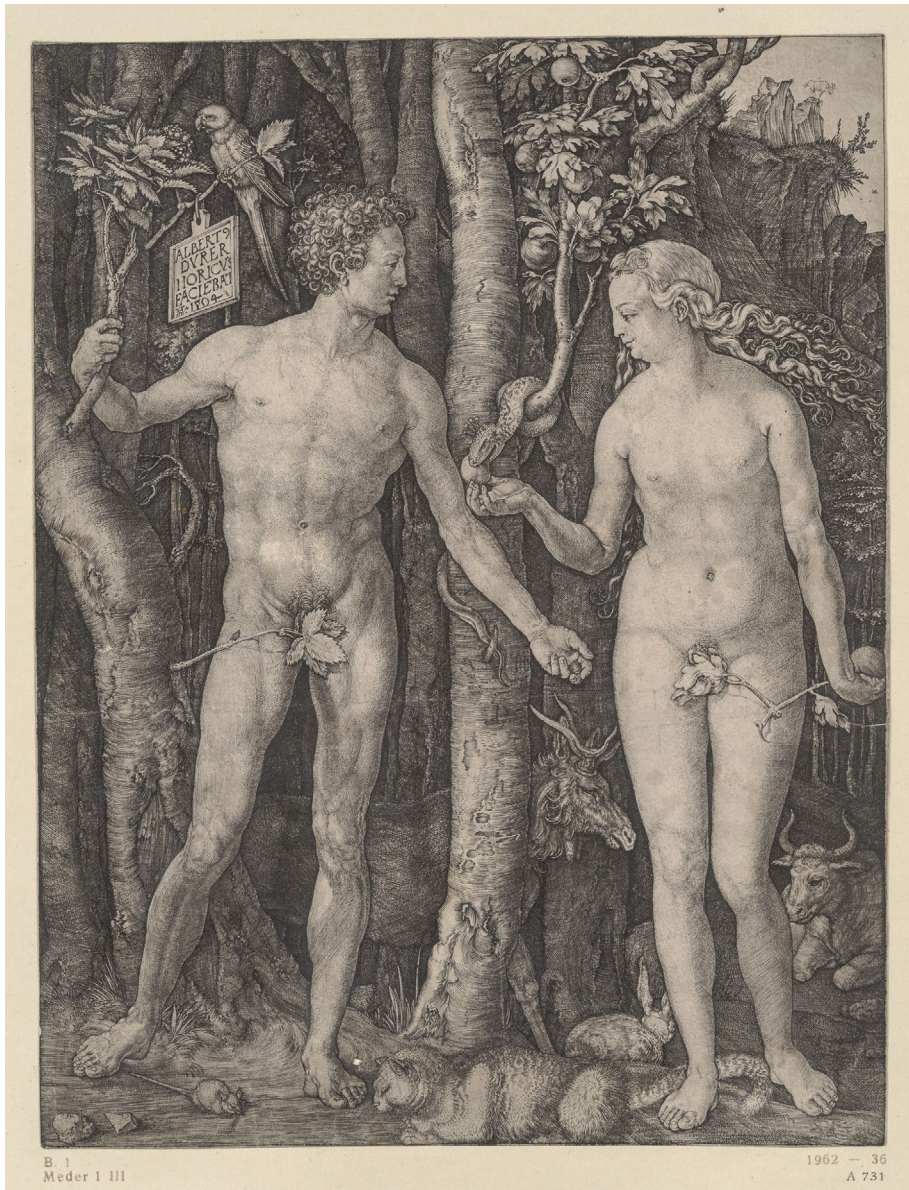
Abb. 13 | Albrecht Dürer, Adam und Eva, 1504, Kupferstich, Kupferstich-Kabinett, Staatliche Kunstsammlungen Dresden.