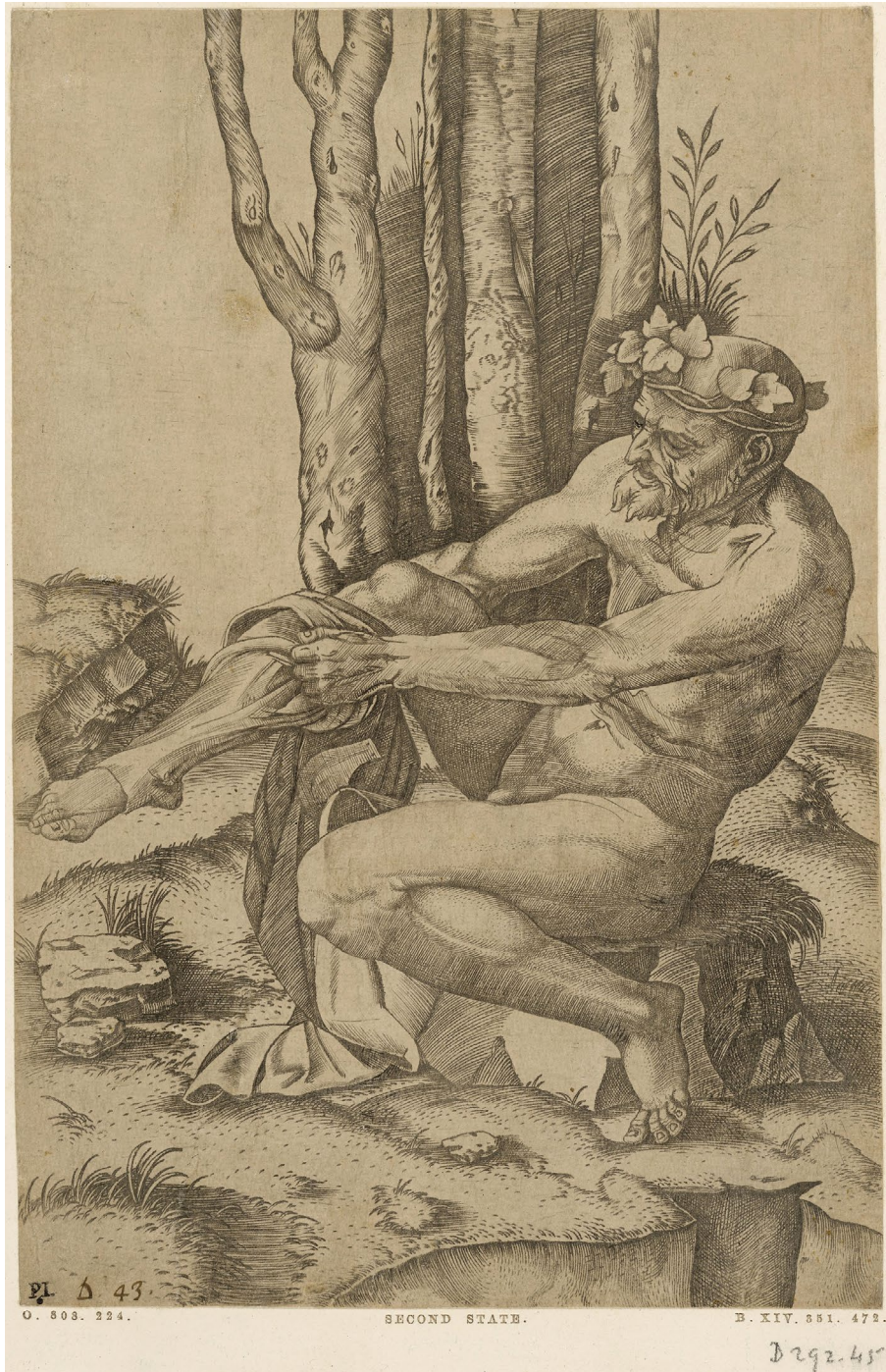
Abb. 6 | Marcantonio Raimondi nach Michelangelo, Ein sich die Hose anziehender Mann, 1508, Kupferstich, British Museum, London (The British Museum Images).