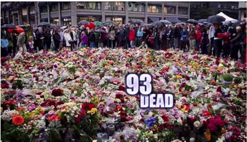
Figure 10.3: Hundreds gather in Oslo to remember the victims of the 2011 Norway attacks.

media help audiences to construct a simulation of a causally connected series of events—this happened, this is happening.