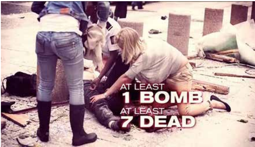
Figure 10.1: Bystanders and medical professionals help the wounded after a bomb explodes in Oslo.

“Facts” in the news are actually selected and sensationalized with non-factual features—graphics, music, audio clips and emphatic headlines. The manipulation brings about a “television effect”, in which viewers at home see themselves in the scene. This in turn creates “emotion potential”, a tension that spurs audience action or, at the very least, heightens interest in the story and empathy for those involved. News