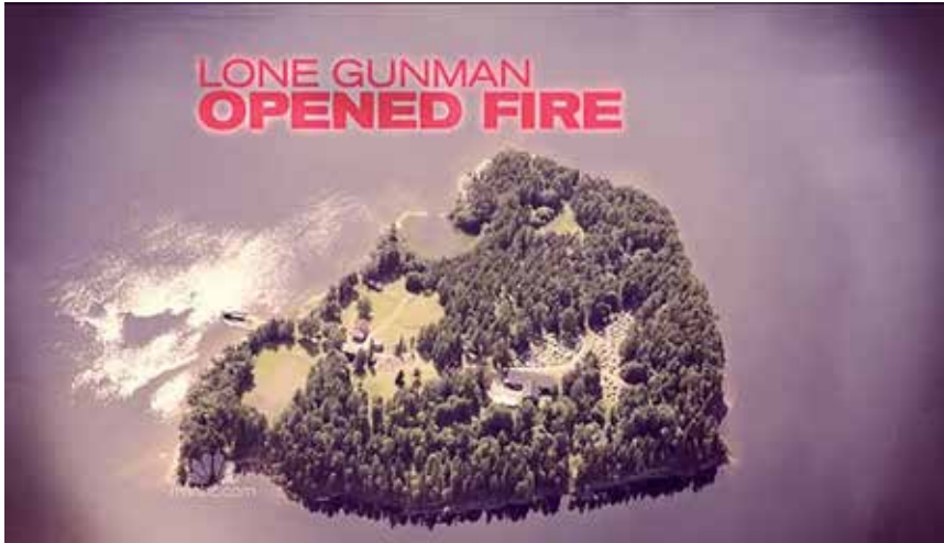
Figure 10.2: The island of Utøya, where a gunman opened fire during the Norwegian Labour Party's AUF youth camp.