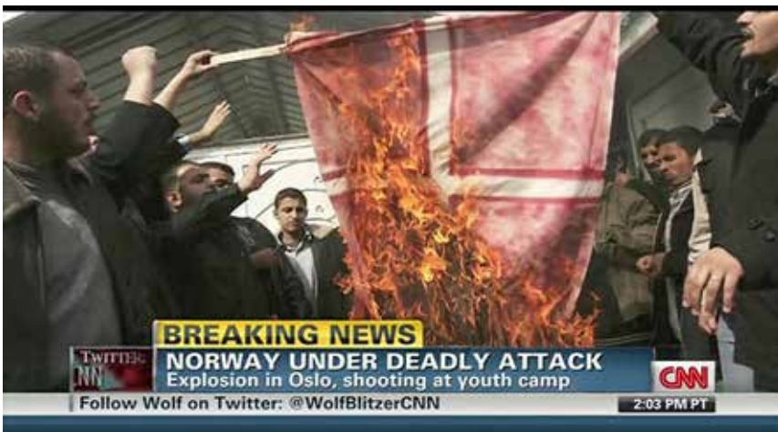
Figure 10.5: The Muslim community protests in response to the Jyllands-Posten Muhammad cartoons controversy.