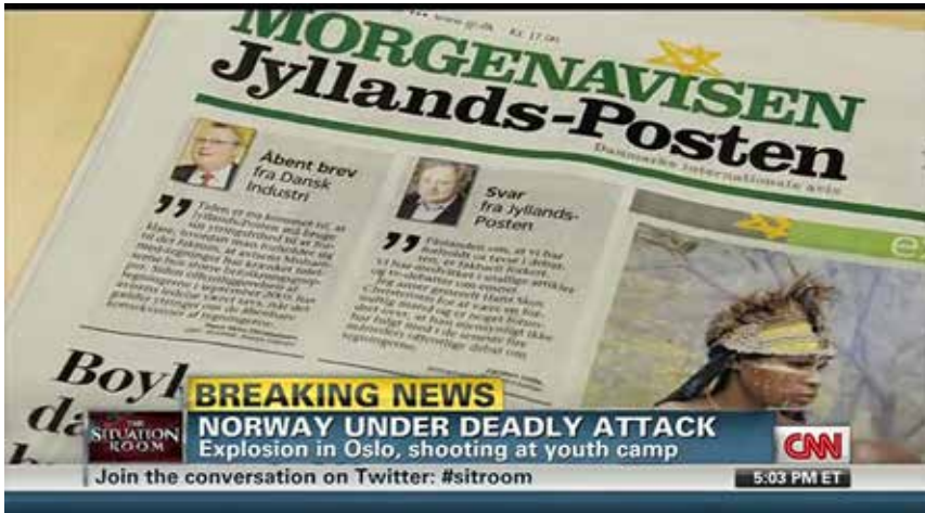
Figure 10.4: Danish newspaper Jyllands-Posten was criticized for publishing a series of controversial cartoons of Prophet Muhammad in 2005.