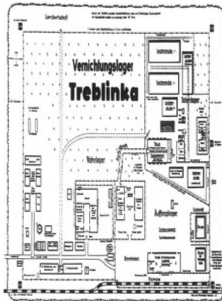
Figura 4 – Una riproduzione della planimetria del campo di concentramento di Treblinka.