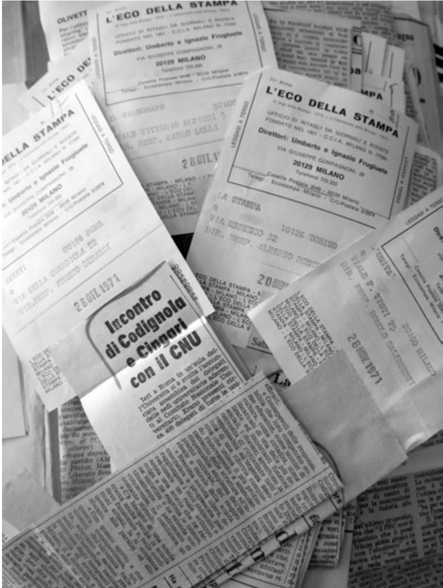
Figura 6 – Rassegna stampa.