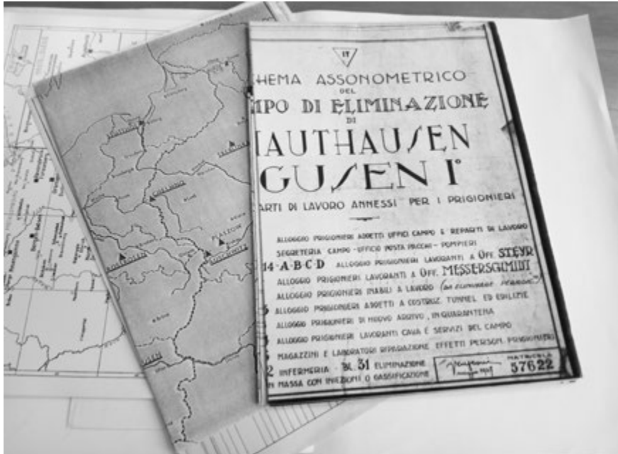
Figura 3 – Cartografie e planimetrie di campi di concentramento nell’archivio di Andrea Devoto.